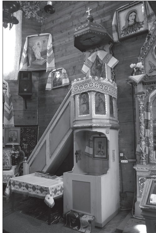
Зразок розміщення раки в інтер'єрі православного храму Троїцького монастиря у Чернігові

звичай, в південно-західному куті бабинця греко-католицьких церков зберігається Гріб Господній, натомість у православному храмі подібного типу конструкція, призначена для зберігання мощей святих (рака), як правило, акцентовано стоїть перед солеєю на окремому підвищенні, частіше — зліва, в північній частині нави, рідше — в південній.