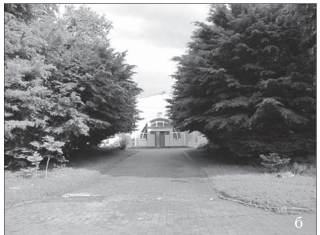
Павільйон Польського промислового банку, а), б)

ти первісний об'єм фасаду будівлі, із влаштуванням мансардного поверху для приміщень різноманітних гуртків тощо.