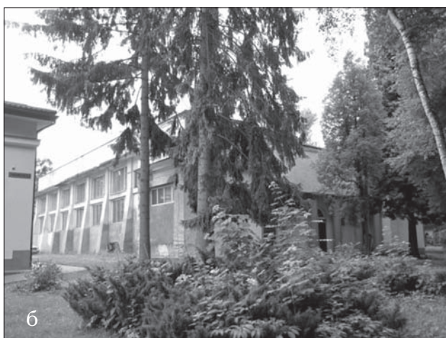
Павільйон Земського кредитного банку, а) фото міжвоєнного періоду з сайту http://www.nac.gov.pl/ , б) фото автора 04.06.2014

захованих у товщі горизонтальних тяг на фасадах, звідки відводилась по ринвах.