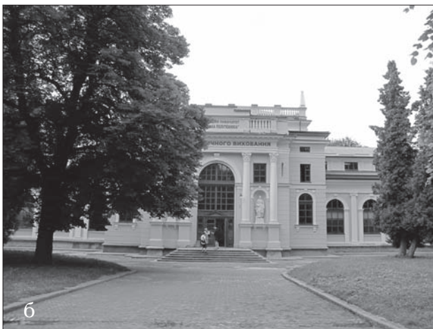
Палац мистецтв, а), б)

вхід вирішений у вигляді тріумфальної арки з чотирма пристінними колонами та аттиком, увінчаним скульптурною групою (на сьогодні втрачена), по обидві сторони входу, в нішах поміж колонами розташовані дві алегоричні скульптури; площини фасадів бічних крил почленовані чергуванням пілястрів та арок. Первісно планувальну структуру палацу утворювала шеренга невеликих анфіладних приміщень, що по периметру оточували групу з трьох крупних залів, які освітлювались через верхній ряд вікон, влаштованих у залах дахів. Зі сторони головного фасаду є вестибюль [18, с. 7].