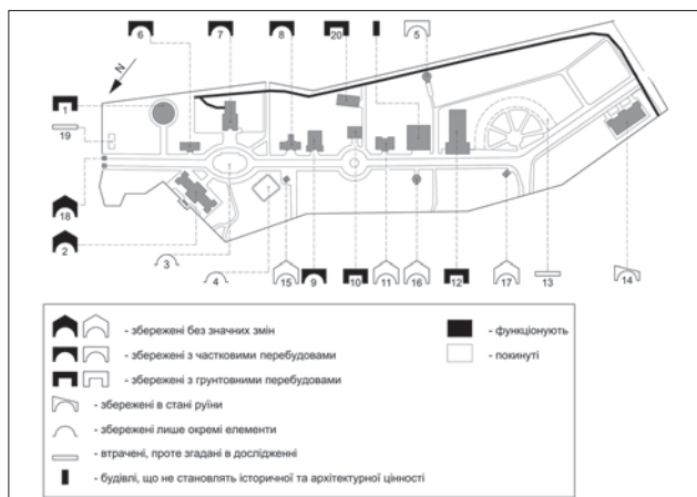
Схема збереження архітектурних об'єктів на території комплексу Східних торгів у м. Львові (креслення автора)

війська вторглися на територію Східної Галичини і 22 числа зайняли Львів. Внаслідок обстрілу території та діяльності військових, значну частину будівель було пошкоджено чи зруйновано. Під час війни та в перші післявоєнні роки терен «Східних торгів» займали різноманітні військові режимні об'єкти.