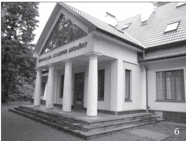
Павільйон рільництва та лісівництва, а), б)