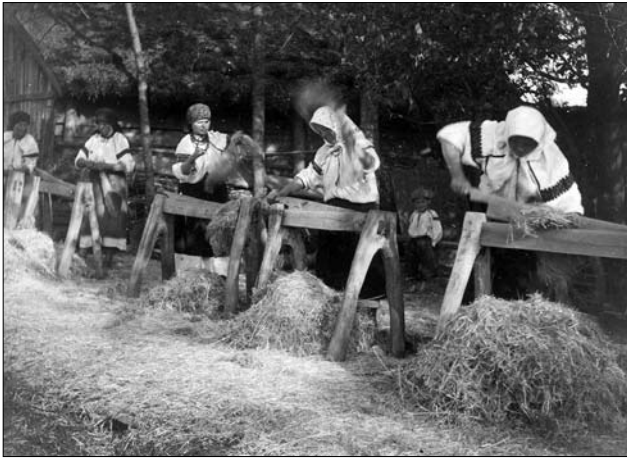
Толока в колгоспі «Перше травня» с. Стецева Снятинського р-ну Івано-Франківської обл. 1960-ті роки. Архів ІН НАНУ. Інв. №12953

ти на три купи. Господар вибирав собі дві купи, третя залишалася тому, хто брав за третину 31 . Так само «за третину» брали буряки. Їх три рази сапали, прополювали, викопували, складали в три кліті. Дві кліті забирав господар поля, одна йшла тому, хто їх виростив.