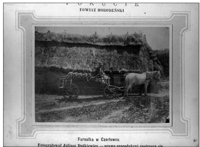
Покутський фірман в с. Чортовець Городенківського р-ну Івано-Франківської обл. Покуття

зонні роботи (сапати, косити, збирати картоплю, цукрові буряки, кукурудзу та ін.). Оплата була натуральна або грошова.