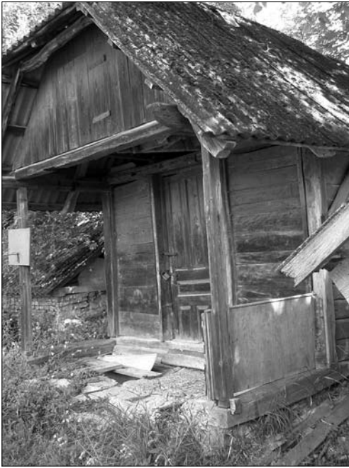
Комора, с. Буківна Тлумацького р-ну Івано-Франківської обл.

розділені перегородками на різні сорти зернових, у верхній частині по периметру приміщення під стелею розташовані полиці (дошка, підтримувана кілками, вбитими у стіну). Стіни складені «в вугли» з топовелих пластин завтовшки 7 см. Слід зауважити, що на Снятинщині з такого матеріалу комори складали доволі рідко: як будівельний матеріал тут зазвичай використовували колоди. Як зазначають у с. Залуччя (Снят.): «В нас комори в зрубі робили з грубого круглого дерева».