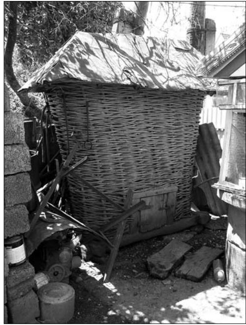
«Кошниця», с. Пилипи Коломийського р-ну Івано-Франківської обл.

В окремих населених пунктах Снятинського району (с. Будилів), подібно, як у деяких районах По-