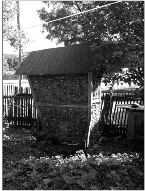
«Кошниця», с. Олеша Тлумацького р-ну Івано-Франківської обл.

насипу картоплі настеляли соломку, горіховий лист і присипали землею (сс. Вікняни Тлум., Клубівці Тис., Залуччя Снят.). Як зазначають респонденти, горіхове листя «давали від мишей»: с. Залуччя (Снят.). У підгірській частині Покуття, подібно, як і на прибойківському Підгір'ї [10, с. 385], для цієї мети («аби миши не їли мандибурки») по житній соломці настеляли смерекову хвою (с. Угорники Кол.). Для того, щоб картопля не підмокла унаслідок попадання дощової води, при потребі навколо ями (на відстані приблизно 0,2—0,3 м від неї) викопували неглибокий рівчак («фосу»). Землю (глину), що вибирали із цього рівчака накидали на солом'яну прокладку (сс. Баб'янка, Тростянка). Зазвичай земляний насип був невеликий: «штих землі» (с. Вікняни Тлум.), «троха більше, як штих глини» (с. Белелуя Снят.). Взимку («як випав сніг») товщину земляного насипу збільшували (с. Вікняни Тлум.). Місцями для утеплення на зимовий період, зверху на каптопляну «яму», по землі ще насипали лист і гній (с. Великий Ключів Кол.). В деяких населених пунктах у тому разі, коли яму заглиблювали у ґрунт до 1 м, у ній могли одночасно зберігати різні коренеплоди: у нижню частину (до рівня землі) засипали картоплю, а вище — буряк (с. Белелуя Снят.).