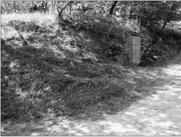
Пивниця, с. Сокирчин Тлумацького р-ну Івано-Франківської обл.

матеріалів дослідників тут, як і на Поділлі [15, s. 60], «кошниця» із вузьких дощечок інколи робили вже у кінці ХІХ ст. [17, s. 60].