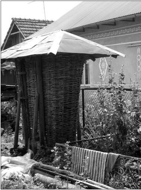
«Кошниця», с. Тростянка Коломийського р-ну Івано-Франківської обл.

форми (сс. Великий Ключів Кол., Підвисоке, Белеуя Снят., Красилівка Тис.).