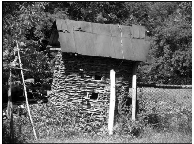
«Кошниця», с. Долина Тлумацького р-ну Івано-Франківської обл.

«Кошниці» завжди піднімали над поверхнею ґрунту на 0,3—0,5 м, встановлюючи їх підвалини на дерев'яні чи кам'яні підкладки. Кінці вертикальних кілків плету закріплювали в отворах, виверчених у підвалинах та платвах (щоправда верхні кінці окремих кілків у місцях кутів споруди в отвори могли не заганяти). Саму конструкцію укріплювали чотирма вертикальними стояками, розташованими по два з кожного із з довших боків споруди, які зарубували у верхню та нижню обв'язки. Стояки мали незначний нахил назовні (повторюючи конфігурацію коша). При потребі між ними закріплювали попе-