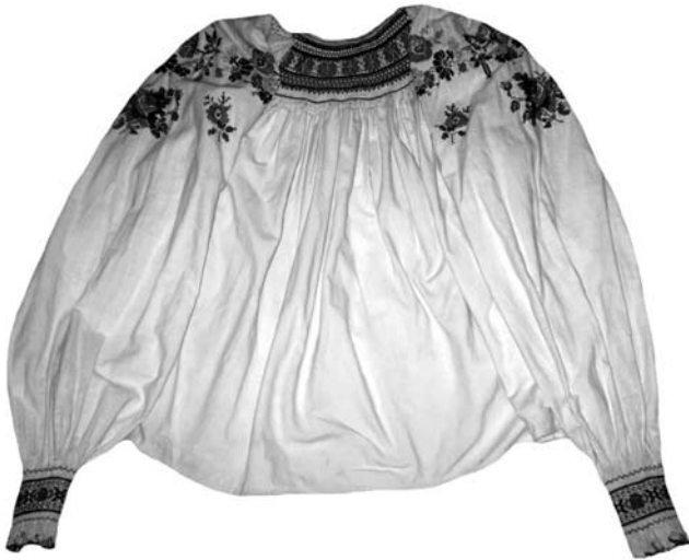
Святкова жіноча сорочка, с. Невицьке Ужгородського району. Домоткане полотно, вишивка, низина, хрестик. 20-ті рр. XX ст.

на шлюб, з'єднавав їх праві руки, а молоді обмінювались хустинками. Саме такий спрощений варіант заручин був характерний для виняткової більшості сіл Закарпаття. Обмін хустинками або персями називали «мінянками». Після «мінянок» священник в книгу оголосків записував молодих і три неділі підряд виголошував їх прізвиська як таких, які хочуть одружитись. Якщо хтось знав причини, через які шлюб був небажаним, то протягом трьох тижнів міг його опротестувати у священника 1, 2 [23, с. 280].