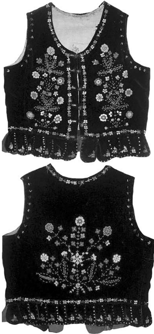
Жіноча безрукавка («лайбик», «камізька»), м. Ужгород. Чорна оксамитова матерія, фабричні стрічки, бісер, гудзики. 30—40-ві рр. ХХ ст.

верхній плечовій частині рукавів вишивали широку (5—8 см) поперечну орнаментальну смугу, яка складалась з ромбів та трикутників з різьками. Площину рукава між даною смугою та манжетами оздоблювали вишивкою у вигляді трьох великих восьмипелюсткових квіток («косиць») та багатьох дрібних трілисників. На манжетах вишивали смугу з ромбів, закомпонованих стилізованими квітками. Обрамляючу функцію виконували різноманітні обмітувальні шви. Поверх морщення, біля манжет, могли вишивати ламану лінію («кривулю») та смужки із дрібних квадратиків [7].