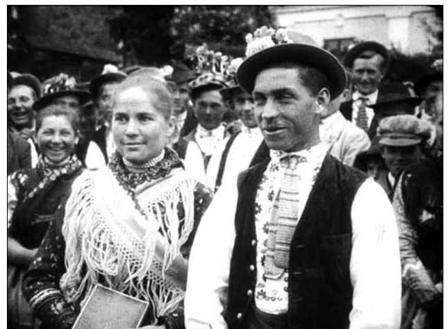
Весілля, с. Невизьке Ужгородського району. 30—40-ві рр. XX ст.

При «обзорах» домовлялись, коли перепишуть землю на молодих, коли і яку худобу їм дадуть і в який день справлять весілля.