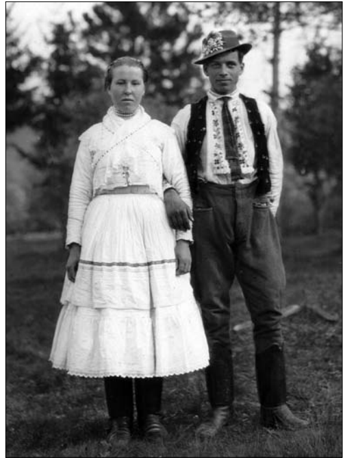
Наречені з околиць Ужгорода. 1920 р.

ISSN 1028-5091. Народознавчі зошити. № 4 (142), 2018