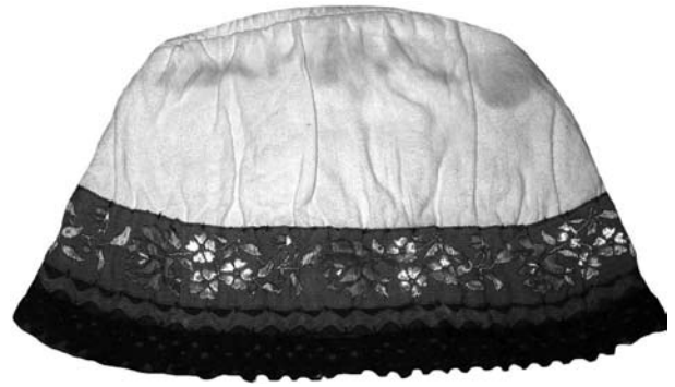
Чепець («чепак»), с. Оріховиця Ужгородського району. Домоткане полотно, фабрична матерія, шовкова стрічка. 20-ті рр. XX ст.

У 20—40-х рр. XX ст. на Ужгородщині побутували жіночі безрукавки, оздоблені бісером. Це