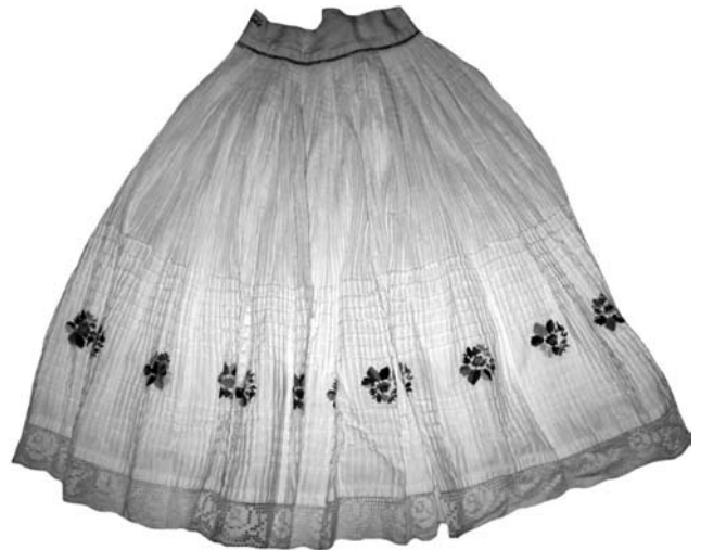
Спідниця («сукня»), с. Кибляри Ужгородського району. Домоткане полотно, вишивка, хрестик. Початок XX ст.

Особливості святкових жіночих сорочок ужгородських долин проявились у крої та варіантах їх оздоблення. Поширеними були декілька способів крою святкових сорочок: з двома бічними швами, з вузькою пілкою-вставкою з правого боку, з вузькими пілками-вставками посередині передньої або задньої частини стану сорочки. Інколи на святкових со-