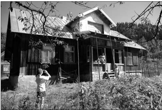
Хата Окуневських в Яворові на Гуцульщині. Сучасна світлина.

браження всього сюжету підкреслюють експресію цієї сцени» [3, с. 130]. Відтак цей рисунок став певним еталоном розкриття теми, на яку налаштував Йоганнес Іттен у своєму курсі.