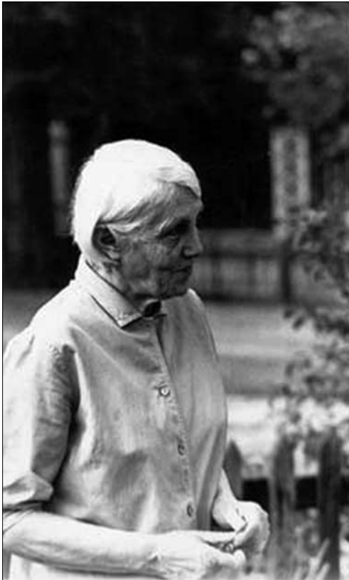
Оля Окуневська. Лондон, початок 1980-х років.

щодо мистецьких образів. Численні рецептурні новації відрізняли її малярство з-поміж творів інших сучасних мистців. Із зафіксованих іспанцем 23 збережених праць домінували сакральні теми («Голова воскреслого Христа», «Тереза з Лізьє», «Святий Франциск Сальський», «Благовіщення» та ін.). Окремими деталями концептуальні розробки Олі Окуневської перегукувалися з шуканнями стилю видатним українським авангардистом Михайлом Бойчуком, а також її віденською подругою Марією Дольницькою.