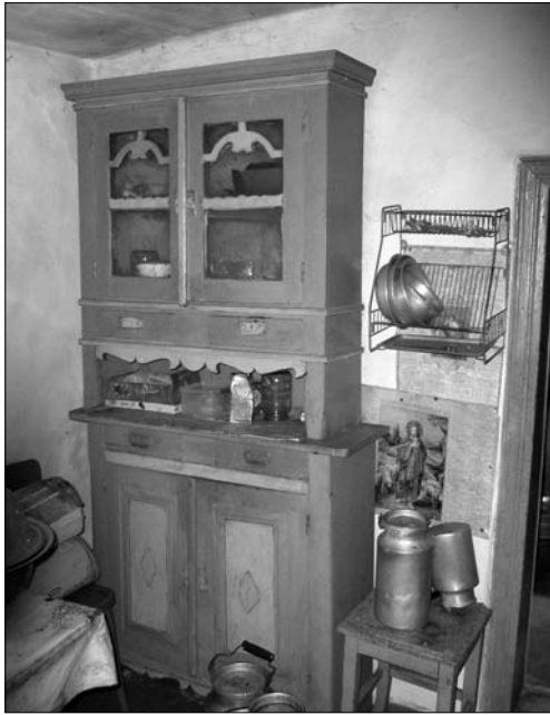
Іл. 8. Мисник-креденс, с. Гарасимів Тлумацького р-ну Івано-Франківської обл.