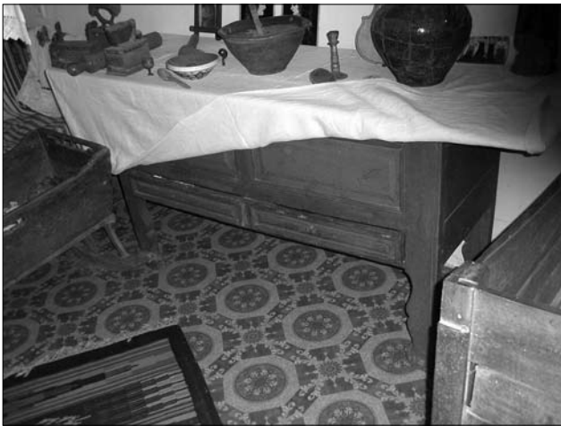
Іл. 2. Стіл-скриня, с. Кутище Тлумацького р-ну Івано-Франківської обл.