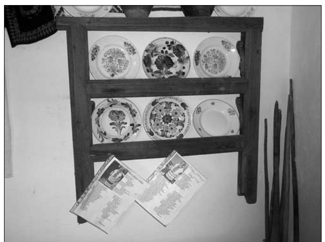
Іл. 7. Мисник, с. Кутище Тлумацького р-ну Івано-Франківської обл.

уздовж тильної стіни приміщення (їх кінці зарубували у поперечні стіни): хати 1846 р. у с. Малий Ключів