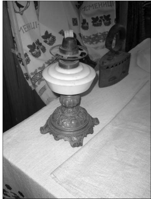
Іл. 13. Газова лампа, с. Клубівці Тисминецького р-ну Івано-Франківської обл.

Уже принаймні з кінця XIX — початку XX ст. для освітлення житла використовували ліхтарі («ліхтарні»). «Ліхтарні» мали переважно форму видовженого по вертикалі куба (Іл. 14). У кон-