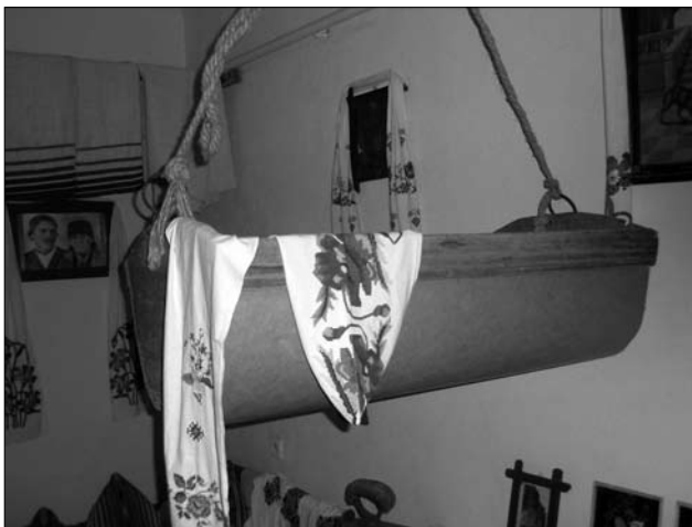
Іл. 9. Колиска, с. Кутище Тлумацького р-ну Івано-Франківської обл.

чів (Кол.); середини ХІХ ст. у сс. Мишин, Верхній Вербіж, Нижній Вербіж (Кол.), Тростянець (Снят.) та ін. «Греди» використовували як жердки або полиці. На покутьсько-гоццувальському пограниччі по парі «гред» могли розташовувати уздовж тильної і лицевої стін хати (сс. Вербівець, Кути Кос.).