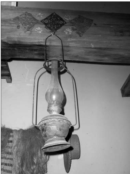
Іл. 12. Газова лампа, Тлумацький р-н Івано-Франківської обл. (скібки), як цеколись було у звичаю в людності усієї Польщі» (с. Чортківець Гор.) [4, s. 59].

Освітлення житлового приміщення за допомогою спалювання лучива [4, s. 59] — колених трісок дерева завдовжки 0,25—0,5 м («скіпки», «скіпочкі», «скібке») було одним із найдавніших. На Покутті «скіпки» найчастіше виготовляли з галуззя смереки (сс. Баб'янка, Пилипи, Жукотин Кол.; Луквиця Бог.