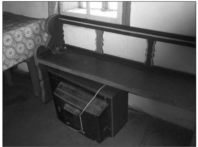
Іл. 4. Лава, с. Гарасимів Тлумацького р-ну Івано-Франківської обл.

бно й у с. Обертин (Тлум.): «Малі сім'ї не сідали їсти до стола, а ставили їжу на закриту накривкою діжу, самі ж члени сім'ї всідалися довкола і так споживали страву. Зберігали діжу за столом-скринєю на лаві, на покуті» 9 .