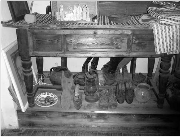
Іл. 1. Стіл, Тлумацький р-н Івано-Франківської обл.