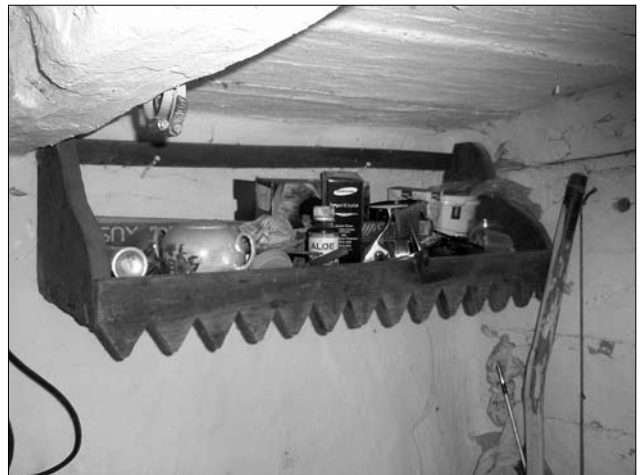
Іл. 6. Полиця, с. Вікняни Тлумацького р-ну Івано-Франківської обл.