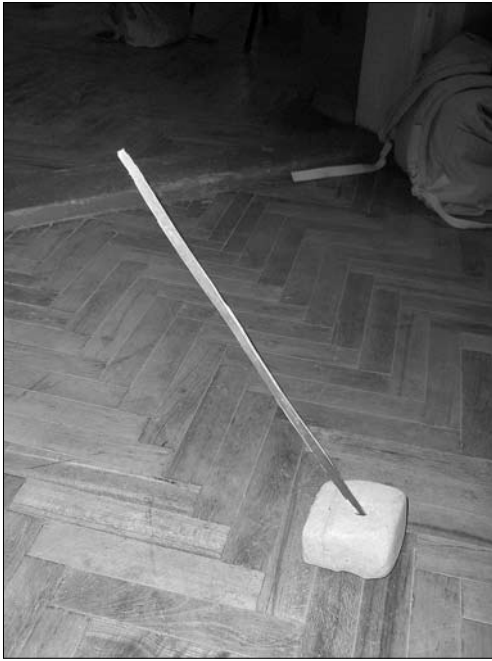
Іл. 11. «Камінь» — світильник для спалювання скипок, с. Колінці Тлумацького р-ну Івано-Франківської обл.