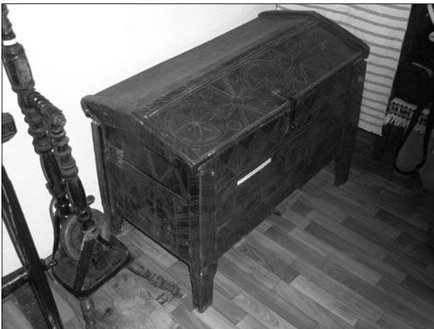
Іл. 3. Скриня, с. Олешів Тлумацького р-ну Івано-Франківської обл.

як і скрізь в Україні, був стіл (чи стіл-скриня), який вважався своєрідним хатнім вітварем. Передовсім слід відзначити, що цей предмет інтер'єру (власне