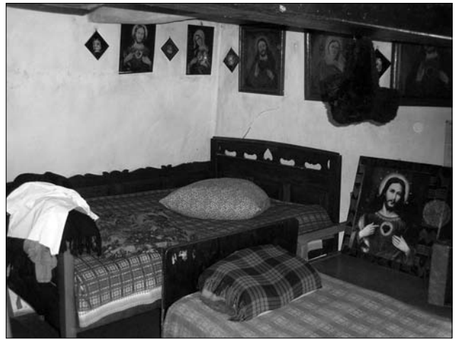
Іл. 5. «Постіль», с. Гарасимів Тлумацького р-ну Івано-Франківської обл.

Для інтер'єру давніших осель були притаманні також «греди» — пара тесаних брусів, які тягнулись