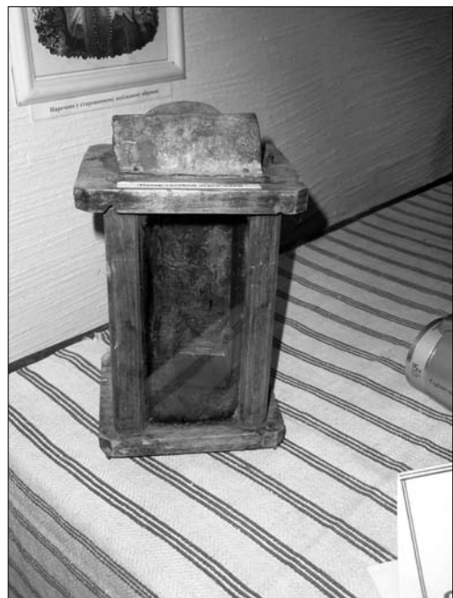
Іл. 14. «Ліхтарня», с. Олешів Тлумацького р-ну Івано-Франківської обл.

структивному сенсі вони склалися з чотирьох планочок з пазами для скла, закріплених до верхньої і нижньої дощечок. У верхній дощечці вирізали отвір (для доступу повітря). В одному із боків ліхтарні влаштовували дверцята. Для перенесення (чи підвішування) у верхній частині ліхтаря кріпили ручку з дроту. Усередину ліхтаря ставили не-