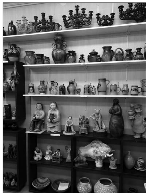
Іл. 7. Експозиція зарубіжного гончарства у Музеї кераміки Вітуатаса Валюшиса у м. Лелюнай, Литва. 2019 рік

Постійний девіз симпозіуму — «Традиції та сучасність». У розумінні учасників це використання і розвиток на сучасному рівні традиційних технологій, прийомів та способів роботи при створенні унікальних авторських творів різного характеру. На Міжнародний симпозіум, що проходив з 18 по 26 серпня 2019 р., приїхали представники з Литви, Латвії, України, Японії. Участь у симпозіумі майстрів з різних країн свідчить не тільки про значимість цього пленеру як явища, а й дає змогу обмінюватись інформацією технічного і творчого характеру безпосередньо під час роботи. Цей симпозіум, як форма існування сучасного гончарного мистецтва, приваблює майстрів, що бажають попрацювати у середовищі од-