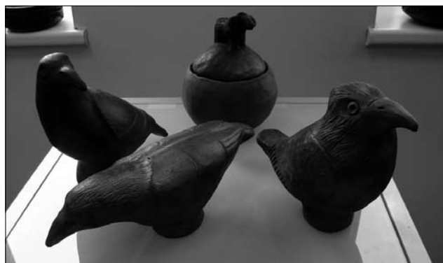
Іл. 9. Виставка гончарства на Міжнародному симпозиумі кераміки у м. Лелюнай, Литва. Серпень, 2019 рік