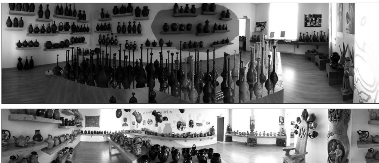
Іл. 2. Музей кераміки Вітуатаса Валюшіса у м. Лелюнай, Литва. 2019 рік.