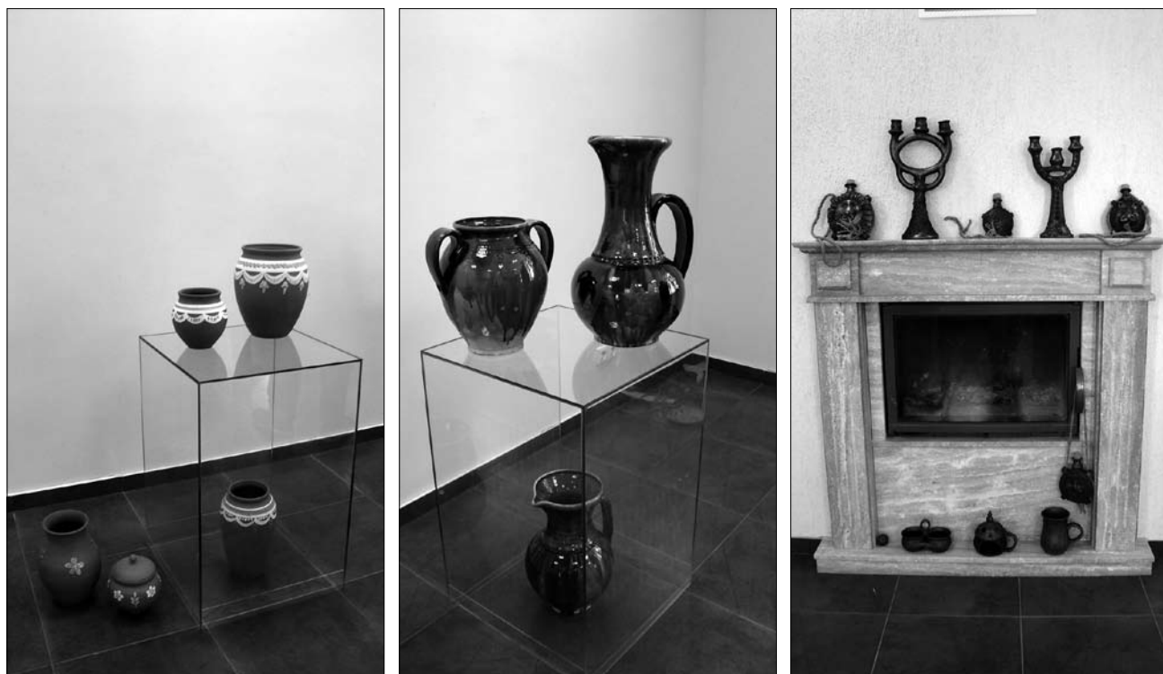
Іл. 8. Виставка гончарства на Міжнародному симпозиумі кераміки у м. Лелюнай, Литва. Серпень, 2019 рік