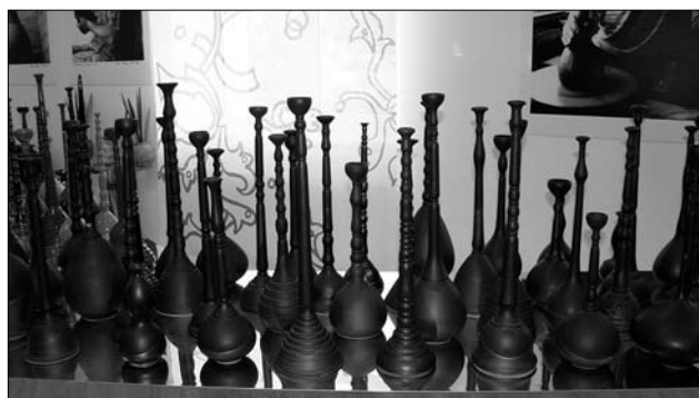
Іл. 5. Вітуатас Валюшіс. Гончарні імпровізації. Глина, гончарний круг, ліплення, лискування, димлення. Музей кераміки Вітуатаса Валюшіса у м. Лелюнай, Литва. 2019 рік