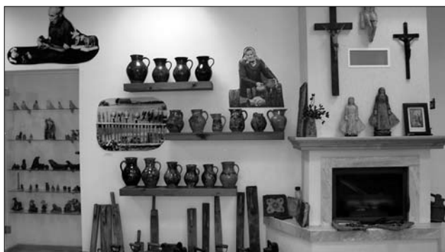
Іл. 4. Експозиція гончарства у Музеї кераміки Вітуатаса Валюшіса у м. Лелюнай, Литва. 2019 рік