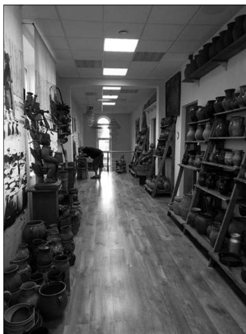
Іл. 3. Експозиція гончарства у Музеї кераміки Вітуатаса Валюшіса у м. Лелюнай, Литва. 2019 рік