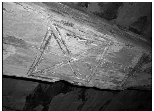
Іл. 4. Косий хрест на сволюку; с. Гута Богородчанського р-ну Івано-Франківської обл.

вих парах «кізлів» («З двох боків будови, на послідних кізлах ставили косицю — дві маленькі смерічки, вбрані лентами»: с. Плав'я; «На кізли ставили смерічку по двох краях даху»: с. Козева; «На кізли — дві косиці по краях... смерічка і ленти»: с. Хитар); очевидно це торкається будівель з двома житловими приміщеннями, розташованими обабіч сіней. Стосовно спорадичного звичаю «класти косицю» посередині даху («Косицю прибивали на хаті до середнього кізла... посередині будови»: с. Красне Рож.), то тут, очевидно, ідеться про домівки типу «комора + хата + сіни», тобто «косицю» встановлювали на крайніх східних кроквах власне житлового приміщення.