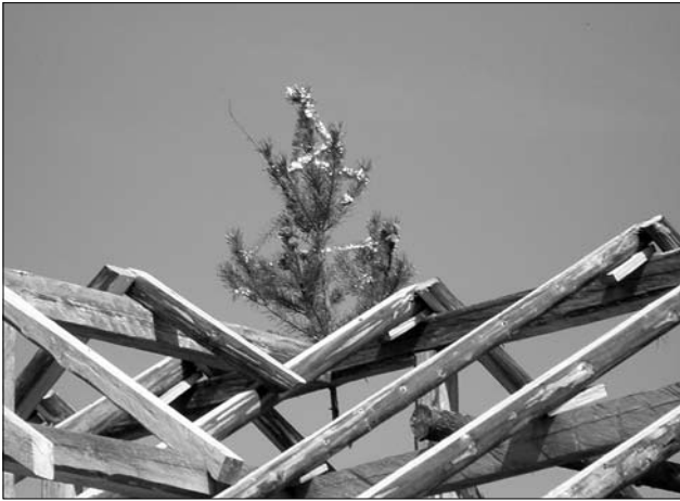
Іл. 5. Будівельне деревце; с. Петранка Рожнятівського р-ну Івано-Франківської обл.