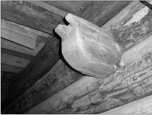
Іл. 2. Головка сволока; с. Луквиця Богородчанського р-ну Івано-Франківської обл.

тям підвалин обов'язково спалювали: «Тріски з замків спалювали» (с. Космач Бог. ІФ). У с. Хмелівка (Бог. ІФ) вважали: «Як лишити тріски всередині [зрубу] з замків підвалин, то все будуть мати смітє в хаті», тому «перед тим, як майстер запечатував, то всьо вимітали і спалювали». Як і повсюдно в Карпатах, та Україні загалом [1, с. 170—171], на сході Бойківщини побутувала низка приписів стосовно поводження з основним інструментом майстра — сокирою. Відповідно до народного повір'я, у той час, коли майстер відпочивав, сокиру не можна було зарубувати в будову (особливо у підвалини) — вона мала лежати — «відпочивати», як і майстер: «[Як майстри відпочивали], сокири в підвалини не зарубували» (с. Ілемня Рож. ІФ); «Як [майстри] відпочивали, сокири в підвалини не можна зарубувати, а тільки поставити» (с. Сенечів Дол. ІФ); «Сокиру майстер ніколи не забивав в дерево, а клав, — поки він відпочиває і сокира має відпочити» (с. Космач Бог. ІФ); «Як майстри відпочивали, сокири не зарубували, а клали, аби сокира відпочила» (с. Красне Рож. ІФ); «Сокиру в підвалину не можна зарубувати (так само не можна [зарубувати у повалений стовбур] і як ліс рубають). Сокиру ложили, щоб вона відпочивала, так як і майстер» (с. Петранка Рож. ІФ). Ціоправда у с. Липа (Дол.) побутував локальний звичай, відповідно до якого під час відпочинку майстрів, сокиру «в підвалину можна зарубувати», але не можна тільки «там, де поріг».