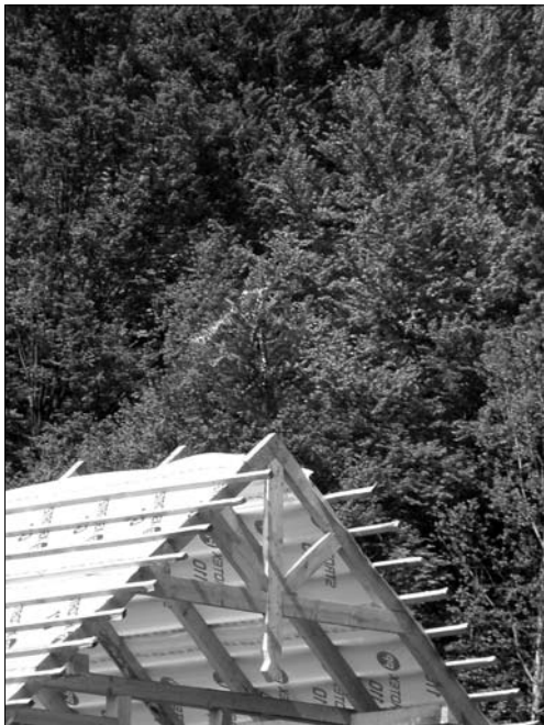
Іл. 6. Будівельне деревце; с. Лужки Долинського р-ну Івано-Франківської обл.

В окремих випадках етнофори наголошують, що будівельне деревце встановлювали (як і починали будівництво хати) у вівторок та четвер (в «скоромні дні») і в ніякому разі цього не годилось робити у «пісні дні» (понеділок, середу, п'ятницю): с. Красне (Рож.).