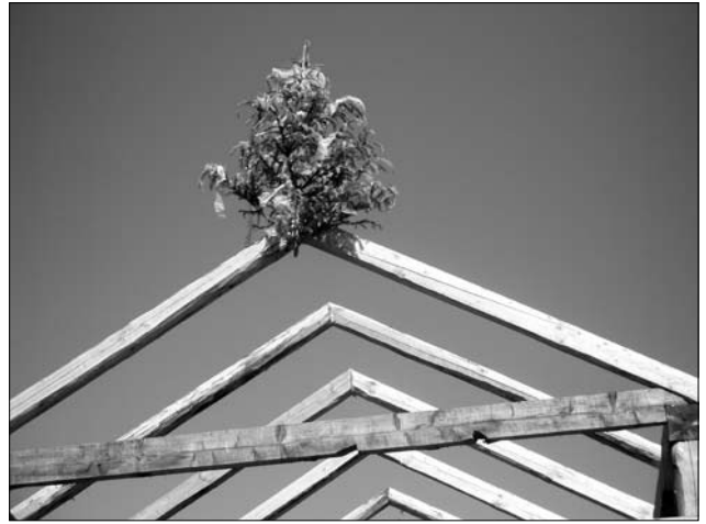
Іл. 7. Будівельне деревце; с. Хмелівка Богородчанського р-ну Івано-Франківської обл.

Відповідно до звичаю, смерічку у лісі рубав господар або майстер, прикрашала господиня, а встановлював її на крокви завжди «старший майстер»: «Газда косицю рубав, газдиня вбирала, майстер чіпав» (с. Міжгір'я Бог.); «Косицю рубав господар, вбирала господиня... Косицю господар виносив — так, як вона має стояти, як росла в лісі — чубком вверх... передавав [майстрові]... прибывав майстер» (с. Глибока Бог.); «Косицю різав газда» (с. Петранка Рож.); «Робит косицю газдині, вішають майстри» (с. Хмелівка Бог.); «Косицю робила газдині, а майстер мав садити її на гору» (с. Хмелівка); «Смерічку рубав господар, жінки в хаті її вбирали, господар брав і давав майстрові, а той чіпав» (с. Вишків Дол.); [Косицю] рубав або газда, або майстер; вбирав газда, чіпав старший майстер» (с. Глибока Бог.); «Рубав смерічку майстер, вбирали газди, а майстер прибывав її» (с. Сенечів Дол.); «Її рубав старший майстер, вибирав квітками господар, а зачіпав на кізлі знов старший майстер» (с. Липовиця Рож.); «Ялинку... прибывав майстер... Ліз по драбині до першого кізла і прибывав» (с. Ілемня Рож.). У с. Красне (Рож.) фіксуємо локальний звичай, відповідно до якого, «рубав косицю сусідський дітвак — була така мода», знову ж «прикрашували її господарі, а прибывав майстер». У с. Тухля (Скол.) «зачіпав косицю хтось з робітників, якому казав майстер... той, що найліпше робив (найкраще працював на будові. — Р. Р.)». Відпо-