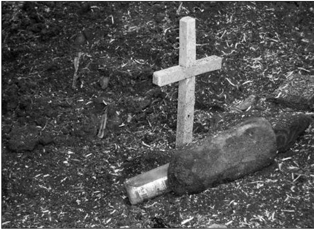
Іл. 1. Ритуальний «хресток», встановлений на місці новобудови перед початком будівництва; с. Липа Долинського р-ну Івано-Франківської обл.

диру зверху [зрубу]» (с. Липа Дол. ІФ). У с. Саджава (Бог. ІФ) записано оповідку: «Майстри будували церкву. Затягли сокири в підвалини і пішли на обід... Піп витягнув сокиру і зарубав в друге місце, промовив: «Що днець, то мрець». Майстер то почув, витягнув сокиру і зарубав в інше місце, проказав: «Що рік, то піп» І, як зазначає оповідач: «З того часу в селі кожного року міняли попа».