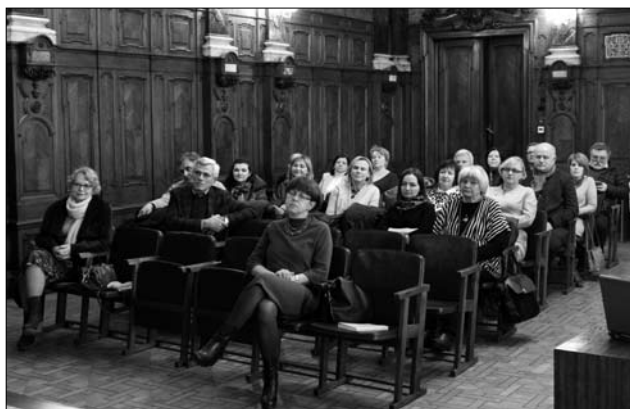
Іл. 4. На презентації монографії