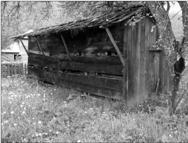
Іл. 7. Будівля закритої пасіки, с. Руська Путильського р-ну Чернівецької обл. 2007 р.

висоті 1 м від стін влаштовано виріз, призначений для вильоту бджіл. В середині під стінами, накритими дашком, встановлені вулики. Між їх рядами утворюється дворик (1,5 x 6 м), який забезпечує зручний виліт кохам та роботі пасічника (іл. 6). Майже подібний тип пасіки зафіксовано в с. Криворівня Верховинського р-ну. Відмінність споруди полягає в тому, для льотків робили не суцільні прорізи, а для кожного вулика окреме вічко [21, с. 49]. Закриті пасіки функціонували і на Буковинській Гуцульщині; окремі з них збереглися практично до нашого часу (с. Руська Путильського р-ну Чернівецької обл.) 1 (іл. 7). На теренах Гуцульщини побутував і другий тип закритих стаціонарних пасік у вигляді прибудови до хати чи господарського приміщення. Такі «пасіки» зафіксовані під час наших польових обстежень 90-х рр. ХХ ст. у селах Шепіт та Селятин Путильського р-ну Чернівецької обл. [6, арк. 16—17, 20]. У них на лавках стояли зарублені в стіни вулики, в яких були прорізи для вильоту бджіл, що виходили назовні. Вхід до приміщення вів через двері. Окрім