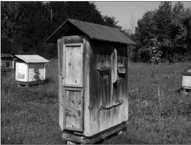
Іл. 3. Слов'янський вулик-«чворак». Пасіка св. Миколая, с. Кобаки Косівського р-ну Івано-Франківської обл. 2013 р.

на було розбирати, що утруднювало докладний огляд бджолиного гнізда. У цих вуликах важко було підсадити нову матку у випадку її втрати чи заміни; нелегко було розпізнати появу хвороб. Мед і віск вибирали з кошів, знищуючи комах. Та, все ж, солом'яні вулики збереглися у селянських пасіках деяких місцевостей до кінця 30-х рр. ХХ ст. [11, с. 77].