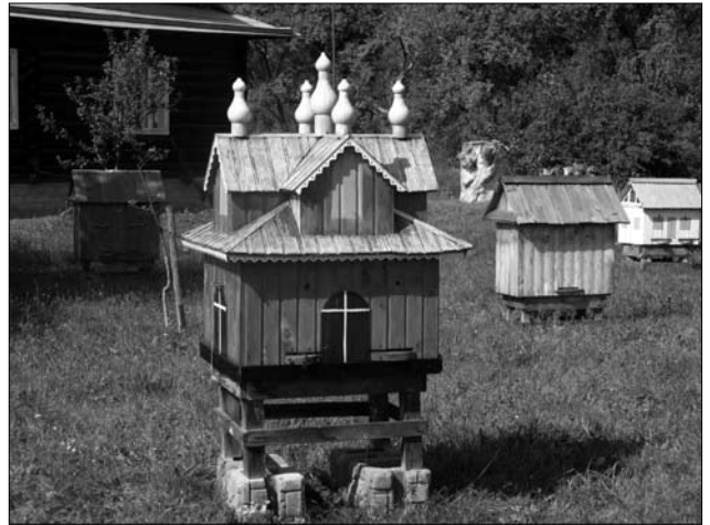
Іл. 4. Вулик у вигляді церкви роботи В. Петричука з с. Бабин. Пасіка св. Миколая, с. Кобаки Косівського р-ну Івано-Франківської обл. 2013 р.

Поряд з розміщенням вуликів на відкритому повітрі на Гуцульщині побутували і закриті пасіки, в яких стаціонували вулики. Зібраний етнографічний матеріал дозволяє виділити два типи пасічних споруд закритого типу: окремі будівлі та прибудови до