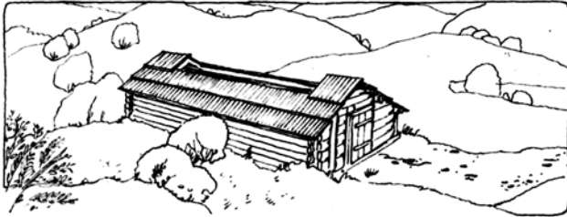
Іл. 6. Пасічницька споруда закритого типу, с. Замагорів Верховинського р-ну Івано-Франківської обл. МНАПЛ