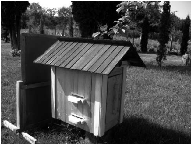
Іл. 2. Слов'янський вулик. Пасіка св. Миколая, с. Кобаки Косівського р-ну Івано-Франківської обл. 2013 р.