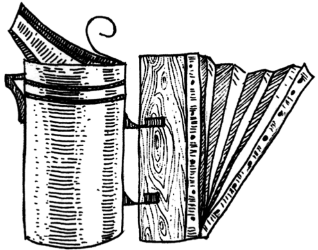
Іл. 8. Димар з механічним роздмухуванням вогню

Невід'ємний компонент пасічницького приладдя становила помпа («сикавка») — пристосування, яким скроплювали привиті на деревах та рої-втікачі.