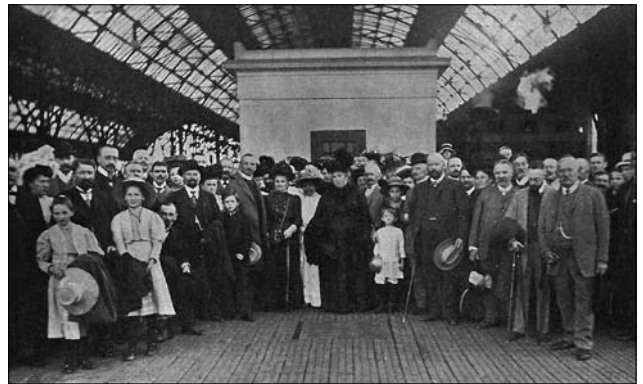
Іл. 5. Поїздка «Ліги Промислової Допомоги» на Виставку до Ченстохови (10.09.1909). Учасники поїдки на Львівському дворі перед від'їздом. Джерело: Sprawozdanie z działalności Ligi Pomocy przemysłowej za czas od 15. sierpnia 1908, do 31. grudnia 1909. t. j. za szesty rok istnienia. Lwów, 1910. S. 304

ті грошової підтримки діяльності організації за посередництва державних органів влади [27].