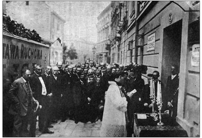
Іл. 4. Посвячення Вагону Пересувної Виставки.

Тематика рефератів охоплювала відомості про географію регіону, популярні технології, товарознавство, а насамперед акцентування уваги на реаліях господарського життя і практичне значення промислово-торгівельного фаху, що було особливо актуальним на той час. Майже завжди з Виставкою поєднували промислові віче, під час яких обговорювали стан місцевого промислу, визначали ключові проблеми чи, навпаки, акцентували на поступі та позитивних змінах. Теоретичні виклади ілюстрували світлинами, фаховою літературою. Важливе видання «Ліги Промислової Допомоги» — Промислово-торгівельний довідник (1906, 1912) ( Skorowidz przemysłowo-handlowy ), в якому було подано інформацію про владні структури, підприємців, купців, максимально зібрану з усієї Галичини та укладену тематично чи за абеткою. Фінансові витрати на друк були доволі великі, оскільки не було жодних субвенцій, окрім самофінансування коштами «Ліги ПД». Це ще раз підтвердило дискусійне питання щодо необхіднос-