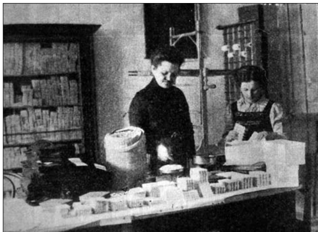
Іл. 6. Підготовка нитяних гудзиків і металевих кілець для постачання до сільських майстерень.

До сталих виставкових інституцій «Ліги Промислової Допомоги» належав Експортний музей, створений у Львові в листопаді 1911 р., де було представлено вироби ремісничої і промислово-домашньої продукції. Матеріальну підтримку музей отримував від Австрійського Міністерства торгівлі. Діяльність Музею полягала головню в налагодженні торгівельних зв'язків із закордоном, передовсім з'ясовувалися можливості експорту домашнього промислу. Увагу акцентували на двох напрямках: зразках продукції місцевого виробництва, які вже мали попит за кордоном, та імпортних зразках, що могли слугувати взірцями для виробництва «на місці» у значно дешевшому варіанті. Експортні зв'язки було налагоджено з Німеччиною, Австрією, Грецією, Туреччиною, Англією, Францією, Італією, країнами Балкан, Америкою, Бразилією, Швейцарією, Африкою та ін. [9; 11; 16; 18].