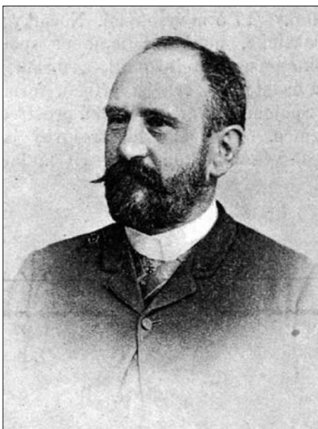
Іл. 1. Володимир Шухевич (1849—1915)

Перспективи подальших студій обраної проблематики полягають у висвітленні маловідомої іпостасі громадського діяча та етнографа В. Шухевича як автора першої україномовної путівникової інформації Львовом та популяризації ним українського павільйону на Крайовій виставці 1894 р. серед громадськості.