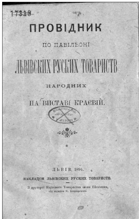
Іл. 4. Провідник по павільоні Львівських руских товариств народних на виставі Краєвій. 1894 р. Обкладинка