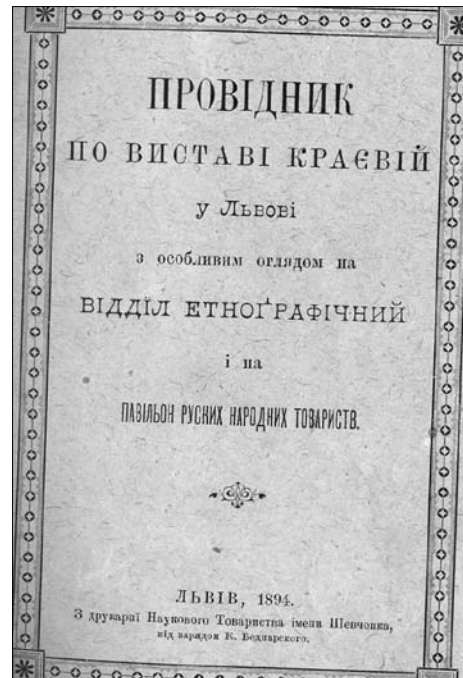
Іл. 2. Провідник по виставі Краєвій у Львові. 1894 р. Обкладинка