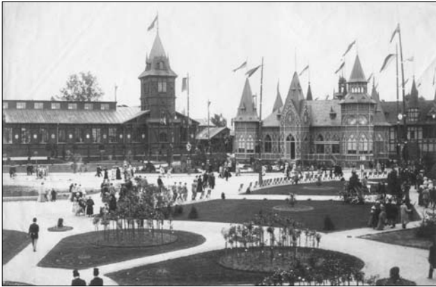
Іл. 5. Крайова виставка. Загальний вигляд