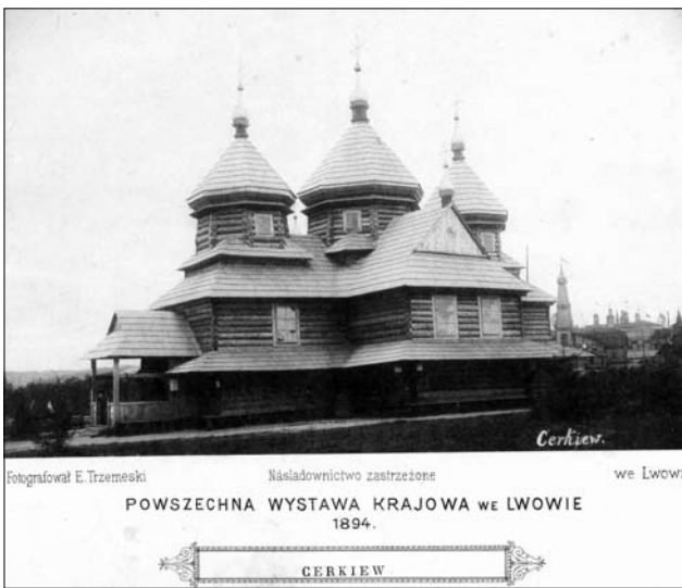
Іл. 6. Гуцульська церква з с. Яворів на Крайовій виставці. Тепер перебуває в с. Красів на Львівщині

гляд українця на галицьку столицю кінця XIX ст. — її історичну долю від часу заснування князем Львом та немало роль українства у розвитку міста (домінування у княжому поселенні, участь членів Львівського братства у піднесенні ремесел, торгівлі та шкільництва XV—XVII ст.) аж до сучасного авторіві суспільно-культурного тла в умовах Габсбурзької монархії, короткий архітектурно-функціональний огляд її найважливіших історичних пам'яток, а також практичні поради щодо розміщення й заповнення дозвіля українських учасників виставки та її гостей.