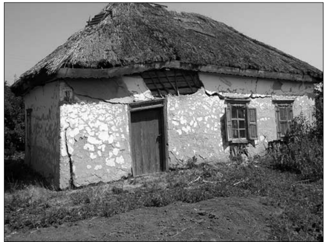
Іл. 2. «Ощіп» хати, змонтований з чотирьох вінків; с. Антипівка Золотоніського р-ну Черкаської обл.

Кількість стовпів каркаса залежала від розмірів споруди (а в каркасно-дильованих домітках — також від якості будівельного матеріалу, заготовленого на закидню. — Р. Р.) 4 . Зазвичай респонденти зазначають, що стовпів було від дванадцяти до двадцяти чотирьох (найчастіше 16—20: с. Хвильово-Сорочин Зол.). Скажімо, як відзначав М. Русов, для побудови хати-мазанки «...вкопують у землю