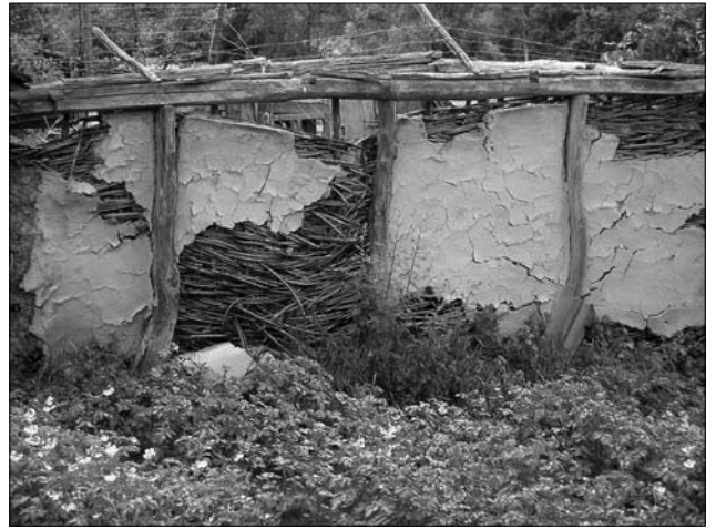
Іл. 8. Заповнення стін хати горизонтальним плотом («лісою»); с. Шабельники Золотоніського р-ну Черкаської обл.

Як і в інших регіонах України [24, с. 450—452; 25, с. 61; 26, с. 86], тут існувало декілька варіантів заповнення стін плотом. Зокрема, описуючи каркасне будівництво Полтавської губернії, М. Русов відзначав будівлі, в яких у вертикальні стовпи каркаса задовбували кілька горизонтальних лат, а простір між стовпами заповнювали пучками хмизу («хворосту»), встановленими вертикально («в торч»). Хмиз переплітали поміж латами або просто прив'язували до них [1, с. 98], тобто хмиз могли просто прив'язувати до горизонтальних перекладин каркаса або заплітати між ними у вигляді вертикального (сторчового) плоту. В обстеженому регіоні згадок про такі модифікації стін домівок нам зафіксувати не вдалося, проте в окремих селах (сс. Домантово Зол.; Озериче, Ліплява Кан. та ін.) з вертикального плоту влаштовували стіни «клунь». Знову ж, згадки про хати зі стінами «городженими плотом в торч» зафіксовані нами на правобережжі Середньої Наддніпрянщини, зокрема у Корсунь-Шевченківському р-ні Черкаської обл. (сс. Деренківець, Глушки та ін.): «Колись давно були хати [...] стовпи, між ними три попережки, городили плотом і закидали [глиносоломою]. Їх називали в торч» (с. Деренківець). Слід зауважити, що вертикальне плетіння з доволі товстих гілок лози, верби, граба, бука, акації чи навіть дуба (городження «патиками нашторцак») відоме у житлобу-