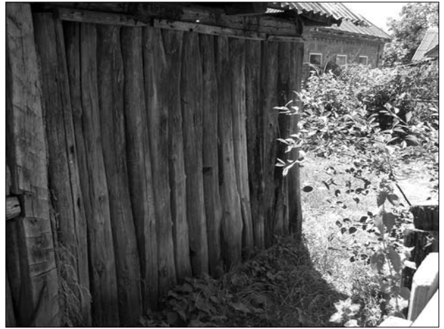
Іл. 3. Конструкція стіни «торчової хати» (без горизонтального пояса)

ISSN 1028-5091. Народознавчі зошити. № 6 (162), 2021