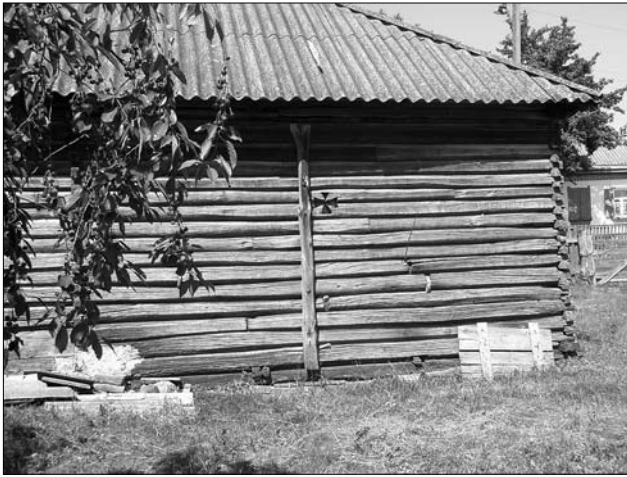
Іл. 1. Фрагмент зрубу хати; с. Антипівка Золотоніського р-ну Черкаської обл.

ловець, Антипівка, Плешкані, Деньги, Хвильово-Сорочин Зол.; Прохорівка, Ліплява, Келеберда, Сушки Кан.), респонденти зазвичай зазначають, що за їх пам'яті (починаючи з другої чверті ХХ ст.) у селі таких хат було дуже мало (переважно, як релікти давнини: «Тільки дуже старі хати були в зруб»: с. Прохорівка; «Колись давні хати були в зруб»: с. Бубнівська Слобідка)). Скажімо, у сс. Ковтуни, Богусловець, Деньги старожили запам'ятали лише по одній «рубленій хаті», у с. Хвильово-Сорочин — дві, у с. Скориківка — п'ять. Натомість в окремих селах, за словами респондентів, їх не було цілком (Озерище Кан., Кропивна Зол.). Нам вдалося обстежити декілька хат зрубної (чи частково зрубної) конструкції лише у кількох населених пунктах (хати: початку ХХ ст. у с. Сушки, останньої чверті ХІХ ст. у с. Ліплява, кінця ХІХ ст. у с. Келеберда Кан.; кінця ХІХ ст. у с. Антипівка Зол.). У с. Мицалівка (Зол.) було зафіксовано зрубну комору середини ХІХ ст., а в селі Деньги (Зол.) — «саж» кінця ХІХ — початку ХХ ст. такої ж конструкції.