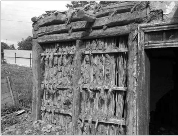
Іл. 6. Конструкція стіни «хати з очерету» (пучки очерету, прив'язані з одного боку «глиць»); с. Хвильово-Сорочин Золотоніського р-ну Черкаської обл.