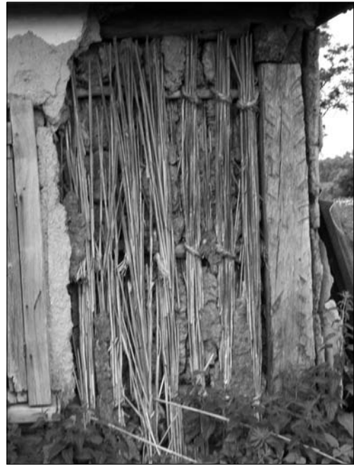
Іл. 5. Конструкція стіни «хати з очерету» (пучки очерету, прив'язані з двох боків «глиць»); с. Сокирівка Золотоніського р-ну Черкаської обл.

Як і в попередніх випадках, основою каркасу будівель були вкопані в землю стовпи («сохи», «присохи»), які зверху зв'язував «ощіп». До стовпів каркаса на певній віддалі одна від одної задовбували кілька горизонтальних «лат» («глиць», «поясів»), до яких закріплювали вертикально встановлені «кулі» («кульки») очерету. Для глиць у середній частині бокових площин стовпів вибирали подовгуваті (овальні) «гнізда» («пазки»). Кількість глиць коливалась у межах (4—5): «У сохи і присохи впоперек вдовбують лати чи глиці числом 4—5» [1, с. 98]. Скажімо, у с. Драбівці (Зол.) на стіну заввишки 1,8—2 м ішло 4 глиці, у с. Скориківка (Зол.) давали 5 горизон-