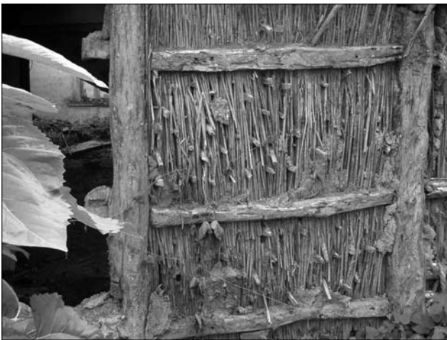
Іл. 7. «Клинцювання» стіни у «хаті з очерету»; с. Хвильово-Сорочин Золотоніського р-ну Черкаської обл.

ного (в розбіжку). Проте цей конструктивний варіант застосовували переважно під час будівництва господарських споруд чи допоміжних приміщень житлового зв'язку (сіней, комори). В окремих випадках одержуємо інформацію, що верства очеретяних кулів була майже суцільною, однак, як твердять респонденти, техніка в розбіжку була більше практичною, оскільки при такому розташуванні «кульків» глиносолома («вальки»), якою закидали стіни, краще зчіплялася з очеретяним заповненням.