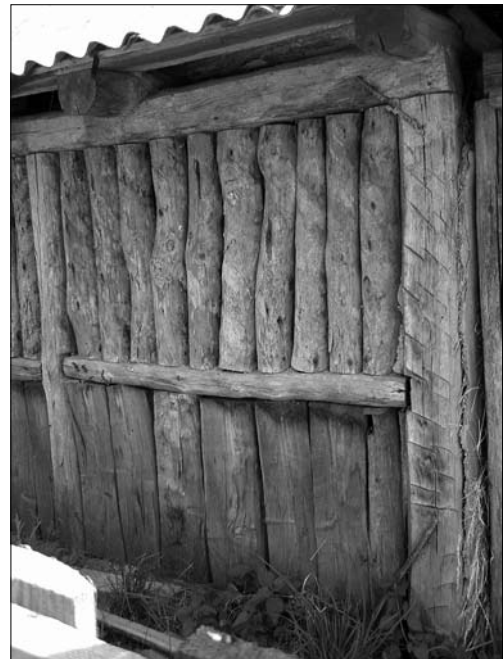
Іл. 4. Конструкція стіни «торчової хати» (з горизонтальним поясом)

во, горизонтальних «поясів» («глиць») могло бути й два-три: «Хата на присохах з торчі... Закопували чотири вуглові порисохи, потім — проміжні присохи... проміжні присохи на два метри одна від одної... Стіну глицювали і торчували. Залежно від висоти дерева (торчі) на висоту стіни ішло дві-три глиці... В глицях — пази, а торчів краї затісували» (с. Антипівка Зол.).