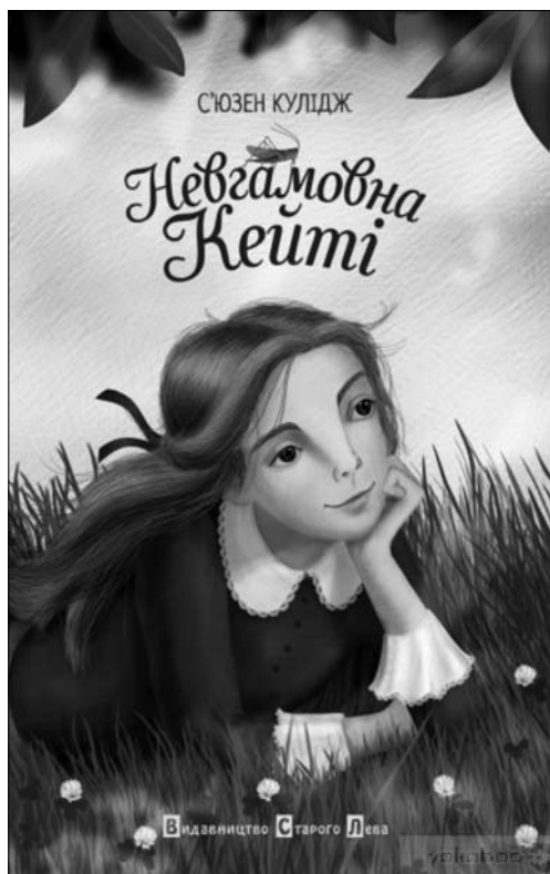
Іл. 4. С'юзен Кулідж «Невгамовна Кейті». https://www.yakaboo.ua/ua/nevgamovna-kejti.html#media_popup_photos (06.01.2022)

жень в характері рисунку, в колористиці малюнків. Авторське рішення найбільш вдале в поєднанні колажу створене засобами комп'ютерної графіки. Загалом, ілюстрації справляють позитивні емоції та легкість у сприйнятті.