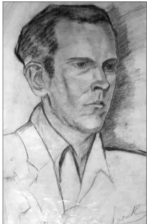
Іл. 7. «Портрет чоловіка», графіка, 1943, фото з приватної колекції Дарії Даревич

Наступним цікавим образом є «Портрет жінки з намистом» (іл. 8). Він привертає увагу жіночністю образу, прослідковується певна ритмічність у лініях волосся, дробовий ритм намиста і вертикальність узорів її вишитої сорочки. Лінія динамічна і чітка.