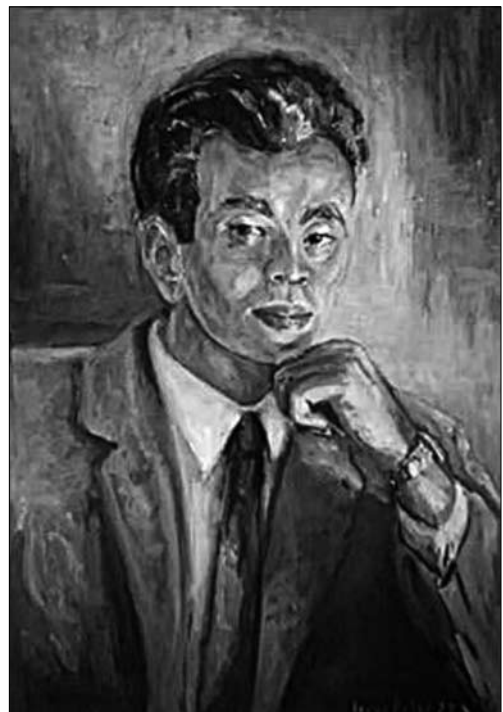
Іл. 2. «Студент», олія, фото з приватної колекції Дарії Даревич

ні скули та ледь припіднята лінія брів. Модель одягнута у білу блузку та червоний шарф на фоні студії світло голубого та рожевого відтінків.