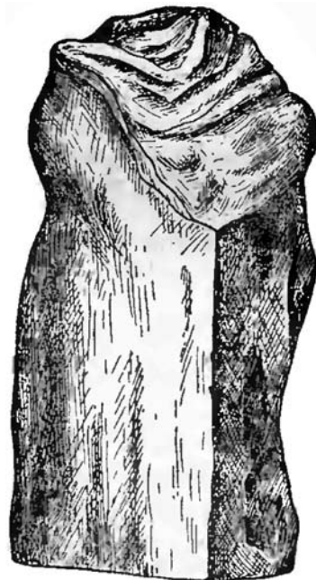
Іл. 3. Фрагмент статуї Санерга з пам'ятника цариці Комосарії (за [7, рис. 2])