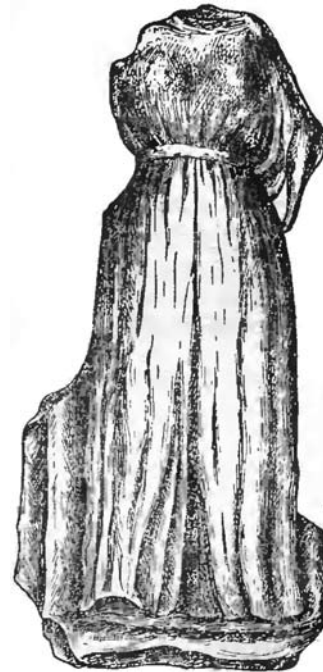
Іл. 2. Фрагмент статуї Астари з пам'ятника цариці Комосарії (за [7, рис. 1])