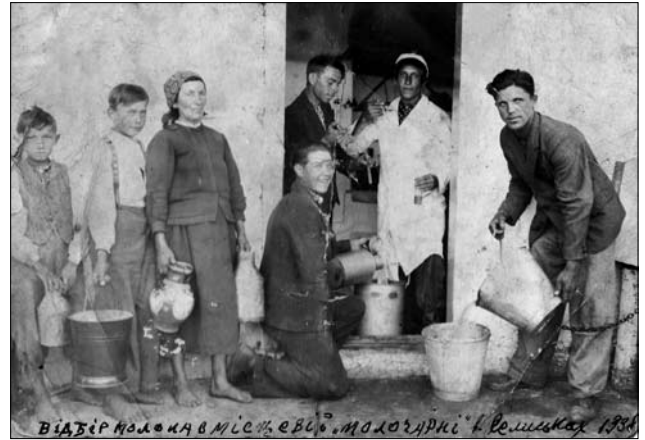
Іл. 8. На світлині підпис: «Відбір молока в місцевій молочарні с. Селисько, 1938 р.». Співпраця з «Маслосоюзом»

Усе було пороховано, розписано і необхідно було виконувати. Треба було здати певну кількість тварин та курей, обов'язково здавали шкіру тварин. При захворюванні худоби на брамі вивішували табличку, забороняли вхід стороннім. Молоко здавали в молочарні через систему «Маслосоюзу», що продовжувала працювати (іл. 8). За здані продукти платили грішми згідно зі встановленими розцінками, що не були постійними і мали тенденцію до зниження. Видавали платіжні картки — «бецунгшайти» для отоварення в склепі (крамниці). Без дозволу не можна