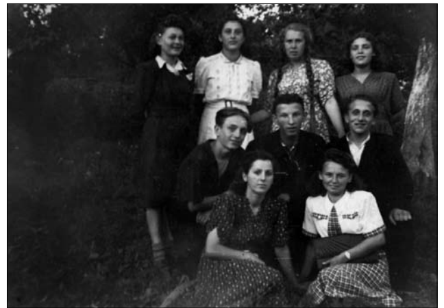
Іл. 13. Випускники 8-го класу селиської школи. 1950-й рік