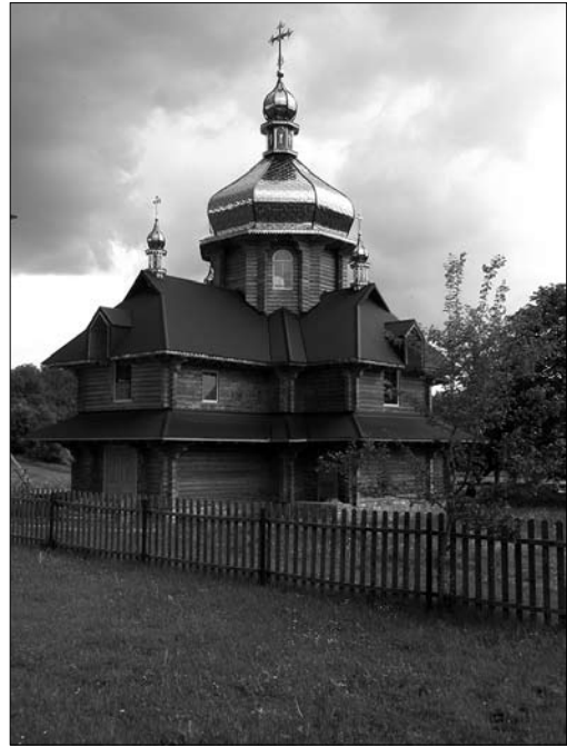
Іл. 4. Церква у с. Текуча Косівського р-ну Івано-Франківської обл.

тром (1955 р. н.) будує церкви (до речі, вони збудували й церкву у с. Космач). У той час, коли зведення подібних зрубів потребувало спеціальних навиків будівничого, з «каліброваного дерева» будувати простіше — навіть кутові врубки можна вибирати на станках, а відтак уже з готових елементів скласти споруду. Причому, коли при використанні «протес» (що характерне й для давнього традиційного будівництва) у зруб з випусками торців споруджують лише нижню (під опасанням) частину стін, а все інше — у чистий зруб («в каню»), то у церквах з «каліброваного дерева» усю будівлю зводять у зруб з лишком. Куполи та дахи вкривають листовим металом, натомість зруб залишають повністю відкритим. Лише у церквах з використанням на верхні яруси замків «в каню», цю частину зашивають дерев'яними «вагонкою» чи «фальшбрусом».