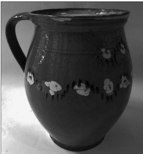
Іл. 14. Андрій Каліш. Горщик. Кінець XIX століття. Старий Санч. МЕХП