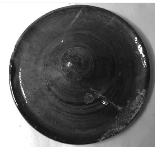
Іл. 22. Андрій Каліш. Накривка. Кінець XIX століття. Старий Санч. МЕХП