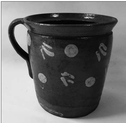
Іл. 3. Горщик. Кінець XIX століття. Милик. МЕХП

раковинний горщик, Мриголод). Натомість горщики для відстоювання молока можуть мати конусоподібну форму, ззовні і всередині були повністю вкриті по-