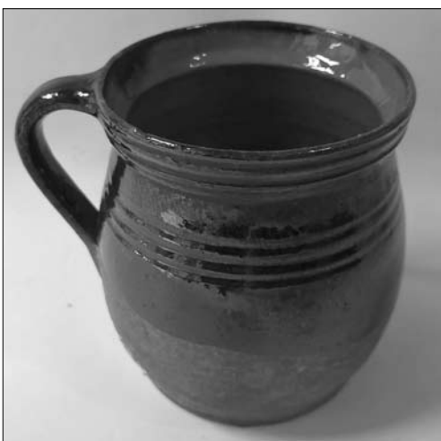
Іл. 15. Андрій Каліш. Горнятко. Кінець XIX століття. Старий Санч. МЕХП

нальне призначення цих виробів пов'язане із зберіганням у них молока (йдеться про більші горщики: h — 13, d — 12, 8 см) [41]. Такі горщики з прямими вінцями, короткою шийкою та плічками, які плавно переходять у корпус. Подібна конфігурація форми характерна для виробів бойківських майстрів, зокрема Старої Солі та Старої Ропи. У той час у декорі горщиків зі Старого Санча поєднано техніку ритуння та розпис на шийці або корпусі. Варіативність ріжкованого розпису полягає у чергуванні композицій у вигляді: