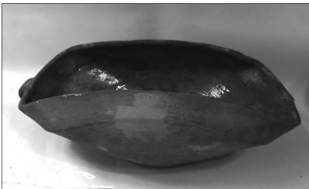
Іл. 8. Посудина. Кінець XIX століття. Мриголод. МЕХП