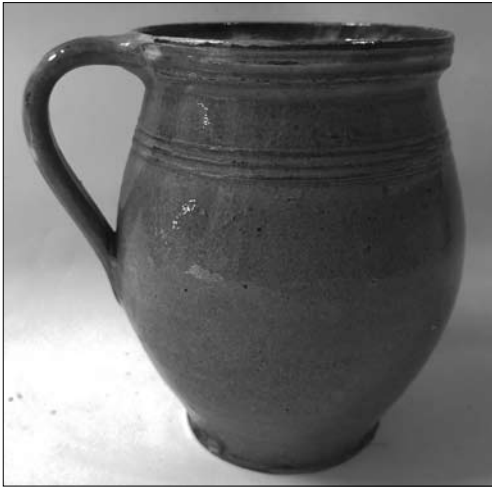
Іл. 13. Андрій Каліш. Горщик. Кінець XIX століття. Старий Санч. МЕХП