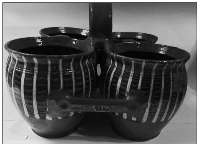
Іл. 6. Чвірнята. Кінець XIX століття. Пораж. МЕХП

Санч) або малої миски з завернутими досередини стінками (Мриголод) (іл. 8—9).