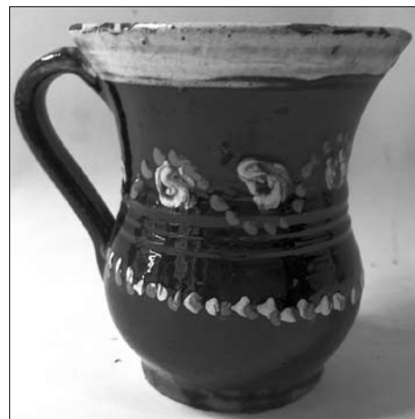
Іл. 18. Андрій Каліш. Горнятко. Кінець XIX століття. Старий Санч. МЕХП