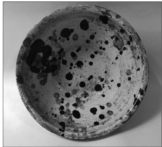
Іл. 11. Миска. Кінець XIX століття. Мушина. МЕХП