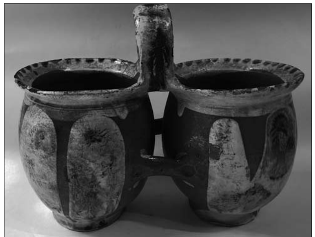
Іл. 5. Двійнята. Кінець XIX століття. Пораж. МЕХП