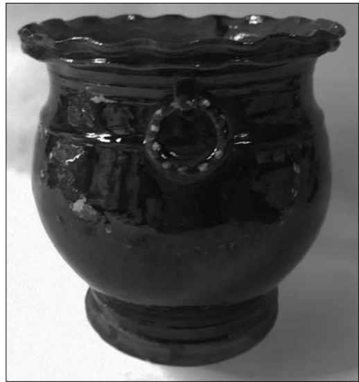
Іл. 25. Андрій Каліш. Вазон. Кінець XIX століття. Старий Санч. МЕХП

У статті акцентовано на творчості одного із найбільш яскравих майстрів Лемківщини — Андрія Ка-