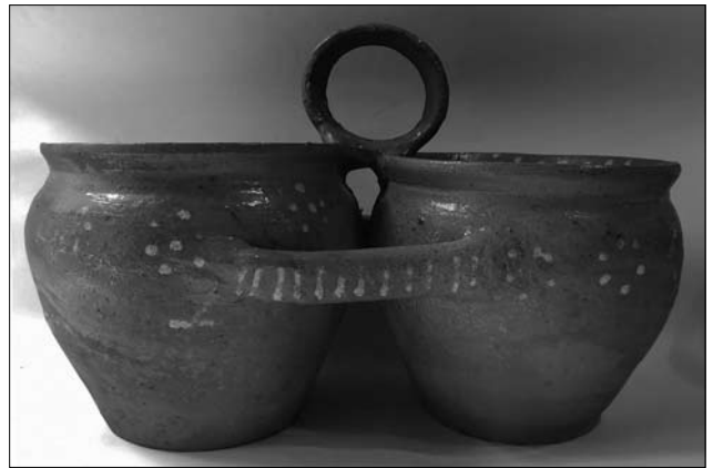
Іл. 4. Двійнята. Кінець XIX століття. Мриголод. МЕХП