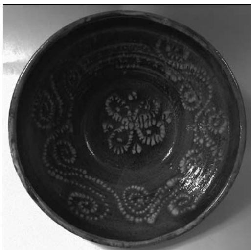
Іл. 21. Андрій Каліш. Миска. Кінець XIX століття. Старий Санч. МЕХП