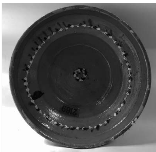
Іл. 20. Андрій Каліш. Миска. Кінець XIX століття. Старий Санч. МЕХП