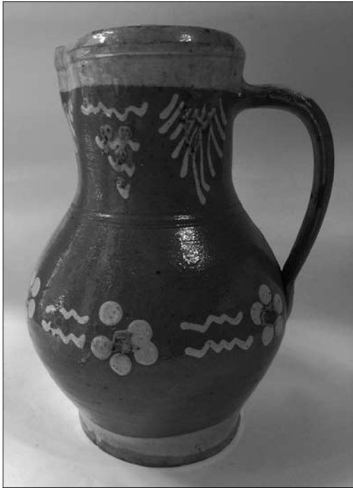
Іл. 7. Дзбан. Кінець XIX століття. Милик. МЕХП