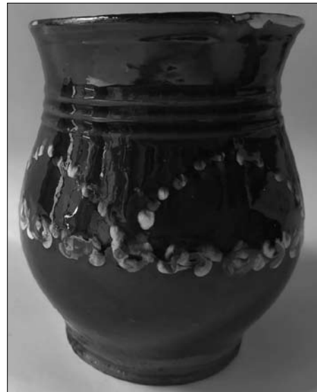
Іл. 17. Андрій Каліш. Горнятко. Кінець XIX століття. Старий Санч. МЕХП