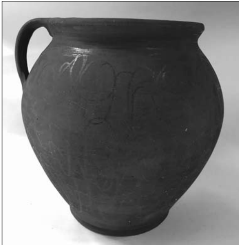
Іл. 1. Горщик. Кінець XIX століття. Мриголод. МЕХП