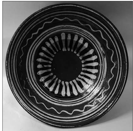
Іл. 10. Миска. Кінець XIX століття. Пораж. МЕХП