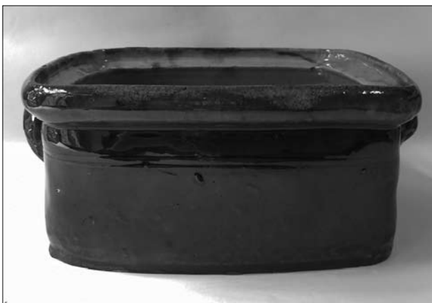
Іл. 9. Посудина. Кінець XIX століття. Новий Санч. МЕХП

та або вмивання. Їх могли вкривати одноколірною, зокрема цеглястою поливою з одного або обох боків (Йосип Перелка, Подегради). До них інколи прикріплювали два невеликі вуха, а дно та боки декорували крапчастими композиціями (Новий Санч, Старий Санч). Яскравою декоративністю відзначалися миски для мисників — їх прикрашали мотивами розеток чи «вазона» на дні та кривулькою або горизонтальними лініями на стінках (Старий Санч, Новий Санч, Пораж) (іл. 10—11).