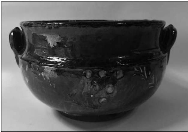
Іл. 2. Горщик. Кінець XIX століття. Мушина. МЕХП