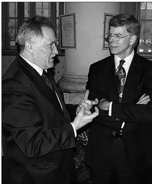
Шостий Надзвичайний і Повноважний Посол США в Україні Вільям Тейлор в Музеї Інституту народознавства НАН України [1, с. 123]