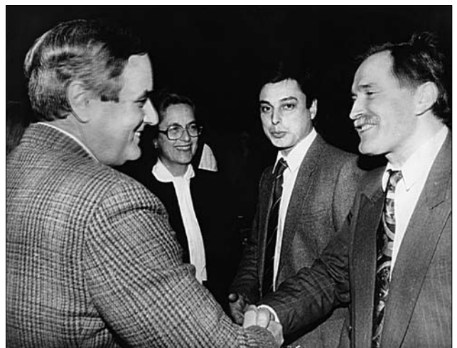
Другий Надзвичайний і Повноважний Посол США в Україні Вільям Міллер з дружиною під час відвідин ІН НАН України. Львів, 1995 р. [1, с. 97]