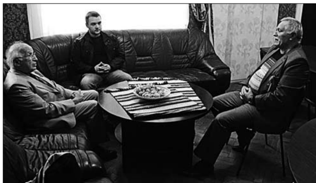
Розмова з Лауреатом Нобелівської премії Роалдом Гофманом (США, родом із Золочівщини) у директорському кабінеті Інституту народознавства НАН України [1, с. 124]

понад 500 книжкових видань, багатьма з яких захоплювався Президент НАН України Борис Патон, роздаровуючи їх під час наукових та інших заходів вченим, політикам та гостям з-за кордону.