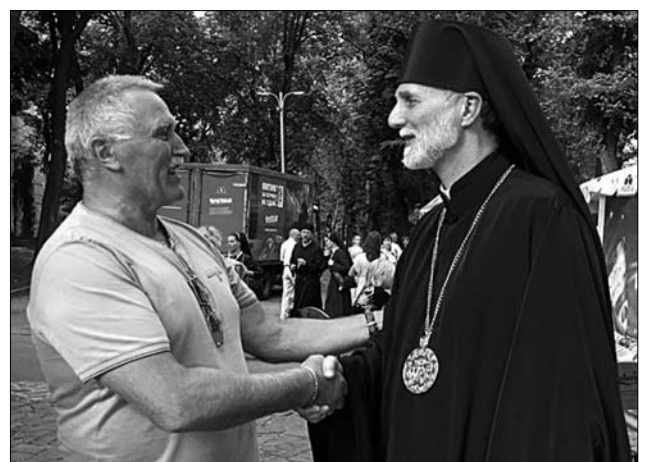
Завжди добродушна розмова з єпископом Борисом Гудзяком [1, с. 133]