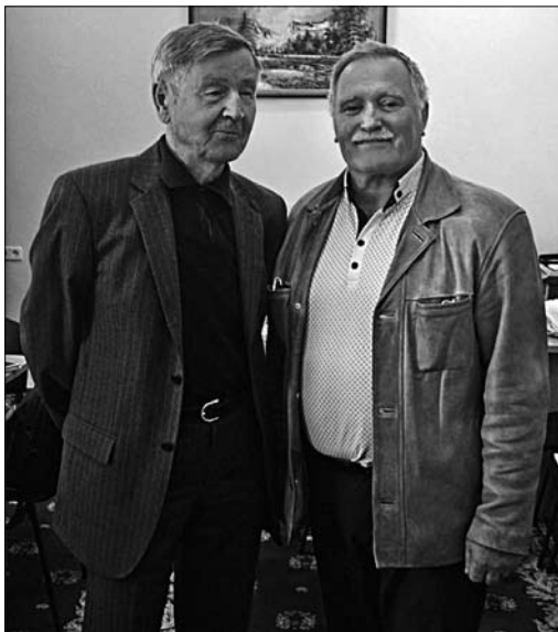
Степан Павлюк з Героєм України, академіком НАН України Іваном Дзюбою [1, с. 153]

віяв ще один парадокс, вигаданий росіянами, про московське походження, генетичну родинність жителів Галичини, зокрема Закарпаття, з московитами. Заледве вдалося «похоронити» розповсюджене москвофільство.