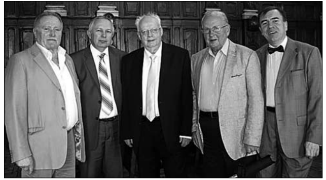
Творчий вечір Героя України, композитора Мирослава Скорика. Добірне товариство: Степан Павлюк, Роман Кушнір, Мирослав Скорик, Борис Білинський, Олександр Козаренко [1, с. 124]

ISSN 1028-5091. Народознавчі зошити. № 1 (169), 2023