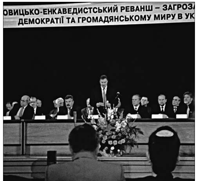
Оперний театр ім. Івана Франка. Звернення до Президента України Леоніда Кучми про організацію процесу «Нюрнберг-2» на засудження злочинів російського більшовизму [1, с. 149]

ISSN 1028-5091. Народознавчі зошити. № 1 (169), 2023