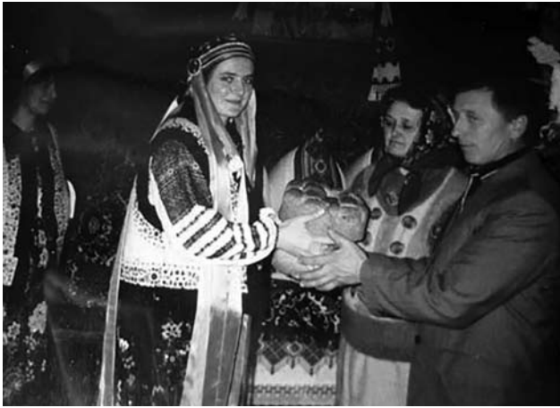
Іл. 27. Зустріч молодої після шлюбу, с. Орельці Снятинського р-ну Івано-Франківської обл. 2015 р. (Ілюстрація за виданням: [13, с. 167])

Поганою прикметою вважали okazaію, якби хтось ще пройшовся полотном, і в Орельці на Снятинщині та у Вербівцях на Городенківщині. Саме тому неподалік, у Торговиці, опісля на полотно кидали гроші, швиденько змотували його і дарували братові чи сестрі. Натомість у деяких сусідніх селах вірили, що особа, яка вслід за молодою ступить на полотно, незабаром одружиться: « За нив живо хтось незаміжній іде по тому полотні, щоб швидко вийти заміж », « Мали пройти по цьому полотні дружки, хто швидше по ньому пробіжить, то швидше одружиться » (сс. Лука, Монастирок Городенківського р-ну) [2, с. 93; 3, с. 235, 257, 274, 280, 304, 314; 5, с. 185; 6, с. 17; 7, с. 193—196; 8, с. 439; 14, с. 1354; 18, с. 157; 19, арк. 49; 24, с. 420; 30, с. 218; 31, с. 80]. Окрім того, звінчану пару частували медом, напували горілкою, яку зчаста допивати не годилося, відтак рештки вихлюпували позад себе, заводили до хати за рушник чи хліб і водили навколо столу тощо [3, с. 274, 304; 8, с. 439; 23, с. 136—137; 27, с. 33; 28, с. 169; 29, с. 81; 35, с. 203] (іл. 27).