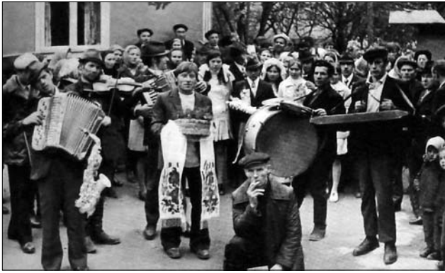
Іл. 7. Вирушають до шлюбу, с. Лука Городенківського р-ну Івано-Франківської обл. 1960-ті рр. (Ілюстрація за виданням: [34, с. 353])