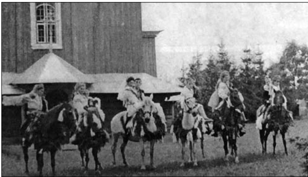
Іл. 21. Молоді з друзями і дружками після вінчання, с. Мишин Коломийського р-ну Івано-Франківської обл. 1998 р. (Ілюстрація за виданням: [36, с. 306])