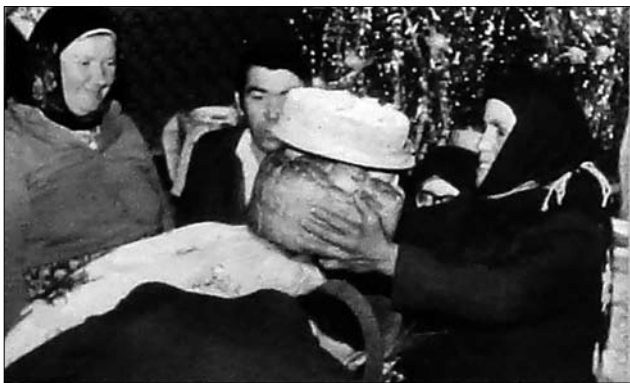
Іл. 1. Мамине благословення на Покутті. 1950-ті рр. (Ілюстрація за виданням: [34, с. 353])