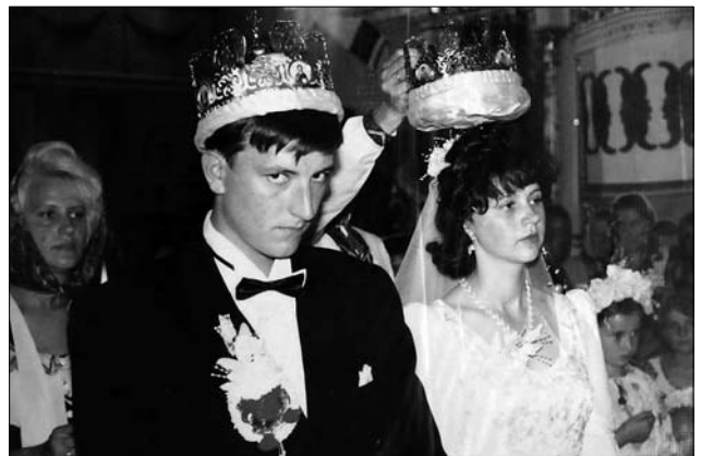
Іл. 19. Шлюб у церкві, с. Белелуя Снятинського р-ну Івано-Франківської обл. 1998 р.

його частину. Однак нині, аби забезпечити злагоду в сім'ї на самісінькому початку подружнього життя, іноді калач попередньо підрізають знизу (сс. Великий Ключів, Залуччя, Велика Кам'янка Коломий-