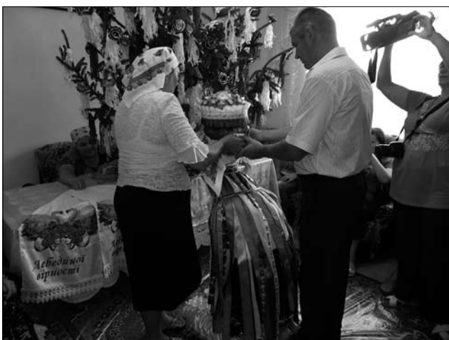
Іл. 3. Благословення молодої «колачами», с. Підвисоке Снятинського р-ну Івано-Франківської обл. 2015 р.