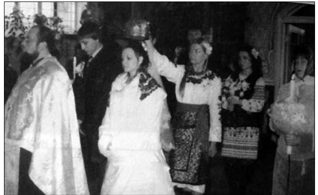
Іл. 18. Дружба й дружка тримають корони над головами молодят, с. Струпків Коломийського р-ну Івано-Франківської обл. (Ілюстрація за виданням: [27, с. 64])