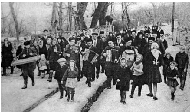
Іл. 11. Весільна хода, с. Петрів Тлумацького р-ну Івано-Франківської обл. (Ілюстрація за виданням: [24, с. 418])

цею, цукром 1 , цукерками, копійками, переливали до- рогу водою (с. Джурків Коломийського р-ну, с. Бе- лелуя Снятинського р-ну, с. Далешове Городенків- ського р-ну) і в супроводі весільних музик рушали до