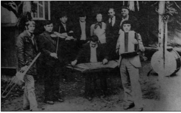
Іл. 13. Весільні музики лаштуються грати, с. Белелуя Снятинського р-ну Івано-Франківської обл. (Ілюстрація за виданням: [32, с. 80])