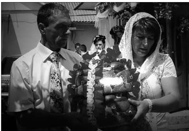
Іл. 5. Випроводження молодої до шлюбу, с. Ганьківці Снятинського р-ну Івано-Франківської обл. 2015 р. (Ілюстрація за виданням: [13, с. 166])

(окремо чи разом) переводили через поріг, на якому лежали кожух і сокира (с. Гринівці Тлумацького р-ну), вели по простеленому полотні на подвір'я