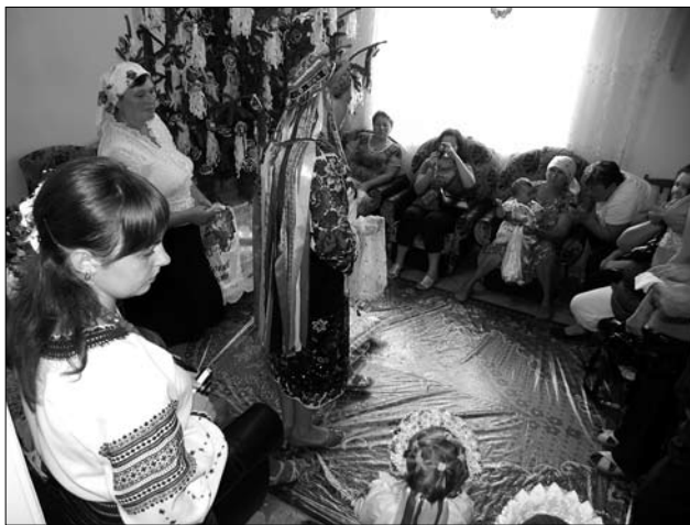
Іл. 4. Молода просить «прощі», с. Підвисоке Снятинського р-ну Івано-Франківської обл. 2015 р.