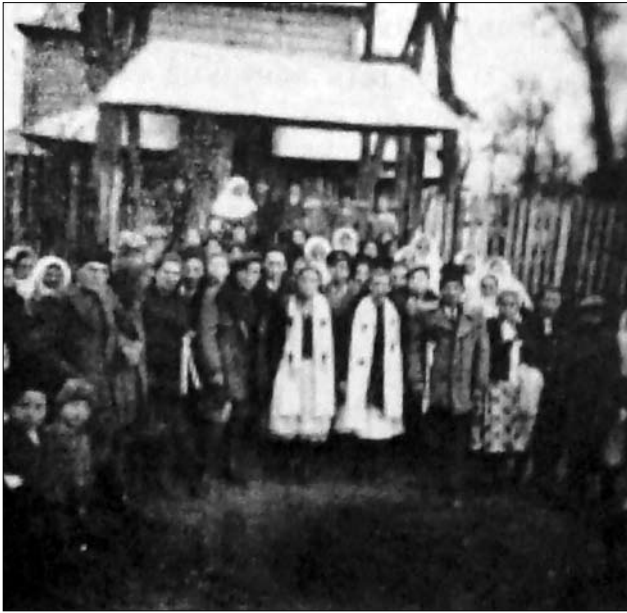
Іл. 20. Дві молоді пари на виході з церкви, с. Сілець Тисменицького р-ну Івано-Франківської обл. (Ілюстрація за виданням: [26, с. 21])