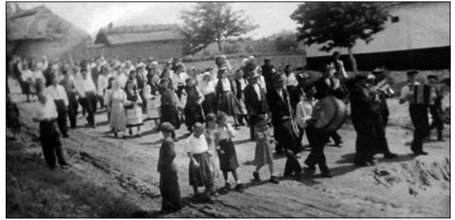
Іл. 8. До шлюбу, с. Озеряни Тлумацького р-ну Івано-Франківської обл. 1960 р. (Ілюстрація за виданням: [34, с. 351])