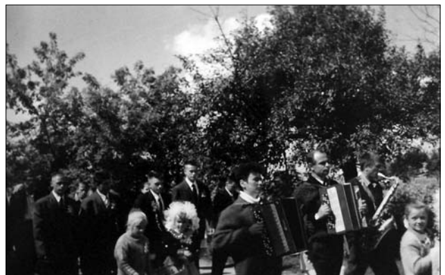
Іл. 12. Дорогою до шлюбу, с. Ісаків Тлумацького р-ну Івано-Франківської обл. 2000 р. (Ілюстрація за джерелом: [40, с. 9])

церкви [3, с. 290, 303; 6, с. 16; 8, с. 436; 18, с. 156— 157; 19, арк. 9, 14, 25, 42, 49, 57, 65, 106, 114; 20, арк. 13—14, 24, 64, 73, 86, 95; 24, с. 419; 29, с. 80; 33, с. 44; 35, с. 196; 37, с. 72; 39, с. 45] (іл. 5—6).