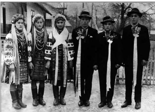
Іл. 24. Молоді з друзями і дружками. Коломийщина. 1970-ті рр. (Ілюстрація за виданням: [34, с. 349])