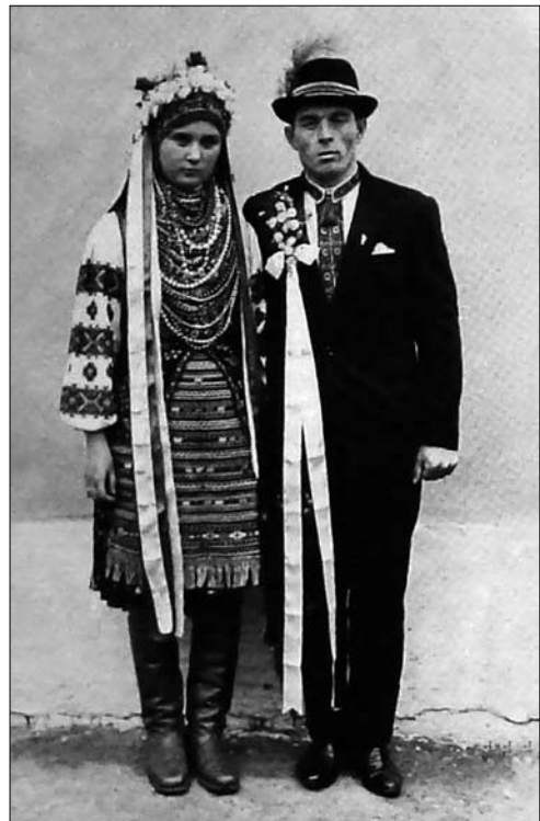
Іл. 23. Наречені. 1970-ті рр. (Ілюстрація за виданням: [34, с. 352])