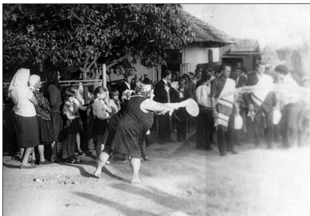
Іл. 6. Переливання дороги нареченим до шлюбу на щастливе життя, с. Далешове Городенківського р-ну Івано-Франківської обл. 1970-ті рр. (Ілюстрація за виданням: [41])

(окремо чи разом) переводили через поріг, на якому лежали кожух і сокира (с. Гринівці Тлумацького р-ну), вели по простеленому полотні на подвір'я