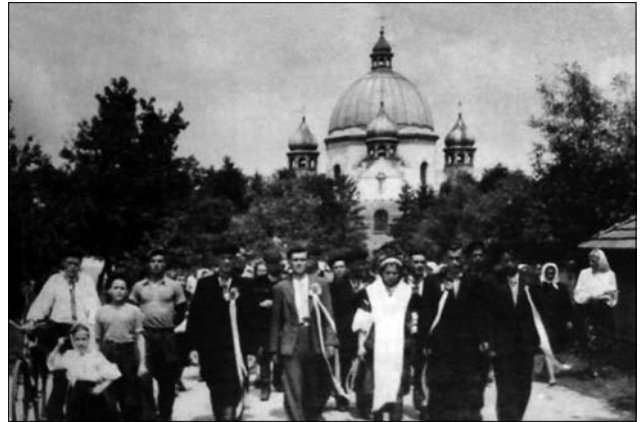
Іл. 25. Повернення зі шлюбу, с. Грушів Коломийського р-ну Івано-Франківської обл. 1951 р. (Ілюстрація за виданням: [34, с. 353])