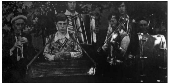
Іл. 16. Весільні музики, сс. Гринівці, Колінці Тлумацького р-ну Івано-Франківської обл. (Ілюстрація за виданням: [35, с. 195])

маччині) [3, с. 233, 256, 273, 277, 278; 7, с. 192—193; 8, с. 436; 16, арк. 28; 18, с. 157; 23, с. 136; 31, с. 79; 35, с. 196, 201] (іл. 7—16).