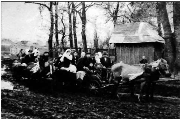
Іл. 9. Дорога до шлюбу, с. Нетребівка Тлумацького р-ну Івано-Франківської обл. (Ілюстрація за виданням: [34, с. 353])