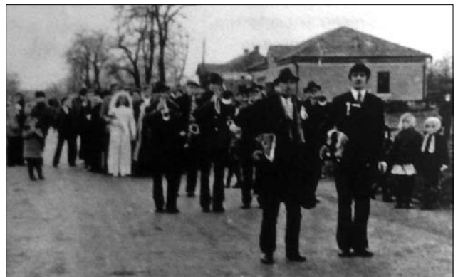
Іл. 26. Весільна хода з церкви, с. Сілець Тисменицького р-ну Івано-Франківської обл. (Ілюстрація за виданням: [26, с. 48])

Однак окремі етнографічні дані вказують на те, що співали мало, «бо ще не їли і не пили» (с. Далешове на Городенківщині), або ж звичаю співати у цей час узагалі не було (с. Чортовець на Городенківщині) [3, с. 257]. Натомість низка обрядодій дублювала дорогу до шлюбу. Шлях молодятм переливали криничною чи свяченою водою, «щоб молода пара не занесла до хати якогось зла, наговорів та ворожбитських наслань», «аби були здорові, як вода», «аби вічно жили, повік не розводилиси і багато діток мали» (сс. Белелуя, Будилів, Красноставці Снятинського р-ну) [19, арк. 106, 114—115; 32, с. 71]. Молодих благословляли на порозі (іноді — на кожному порозі в оселі) хлібом і сіллю, посипали збіжжям і заводили до хати по простеле-ному полотні, подальше поводження з яким у деяких селах різнилося. Скажімо, в Іллінцях на Снятинщині ступати на полотно могла лише молода, по чому його забирали, «шоби не була в життю бідна».