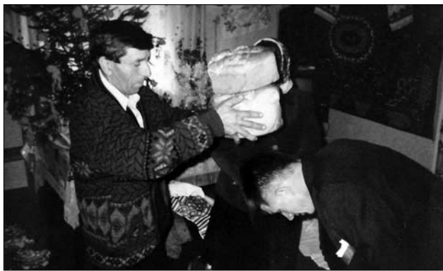
Іл. 2. Батьківське благословення, с. Ісаків Тлумацького р-ну Івано-Франківської обл. 2000 р. (Ілюстрація за джерелом: [40, с. 9])