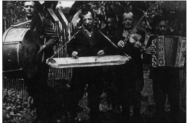
Іл. 15. Весільні музики, с. Гринівці Тлумацького р-ну Івано-Франківської обл. (Ілюстрація за виданням: [35, с. 194])