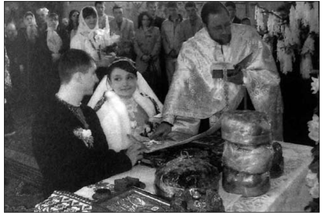
Іл. 17. Молоді дають шлюбну обітницю, с. Струпків Коломийського р-ну Івано-Франківської обл. (Ілюстрація за виданням: [27, с. 63])