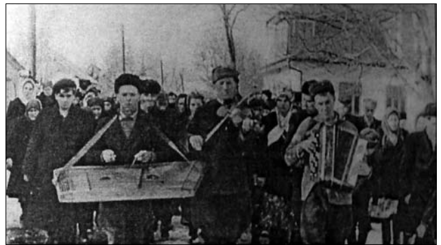
Іл. 10. Весільна хода, с. Петрів Тлумацького р-ну Івано-Франківської обл. (Ілюстрація за виданням: [24, с. 417])