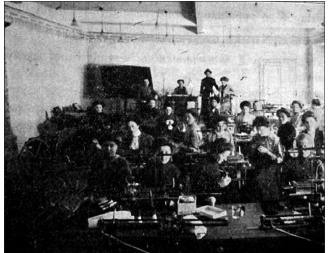
Іл. 4. Курси панчішництва і трикотажу в Семінарії домашнього промислу «Ліги Промислової Допомоги» у Львові (Джерело: Sprawozdanie z działalności Ligi Pomocy Przemysłowej za czas od 15 sierpnia 1908 do 31 grudnia 1909. Tj. za szósty rok istnienia. Lwów, 1910).

Отже, заснування осередків «Ліги Промислової Допомоги» на Станиславщині та їх успішної чи, навпаки, незадовільної діяльності залежало від активності місцевих влад і громади, їхнього розуміння важливості такого кроку, важливості відновлення традиції локальних промислів та її продовження. Окремі місцевості також часто були задіяні — і доволі успішно — у низці агітаційно-виставкових подій, не посідаючи утім таких осередків. До складу керівних і організаційних комітетів входили представники та представниці державних влад (члени магістратів, судді), промисловці, банкіри, керівни-