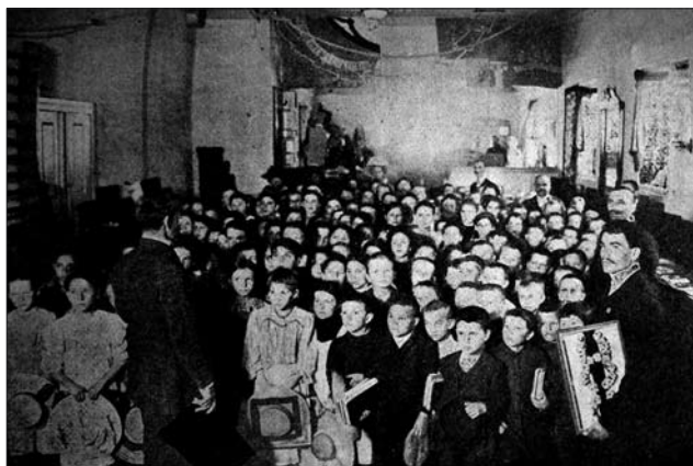
Іл. 6. Лекції про стан місцевих ремесел та промислів, організованих «Лігою Промислової Допомоги» під час Пересувної Виставки в Болахові

ціальних машинах для в'язання. Діяльність робітні розвивалася успішно, про що свідчили прибутки з реалізації продукції.