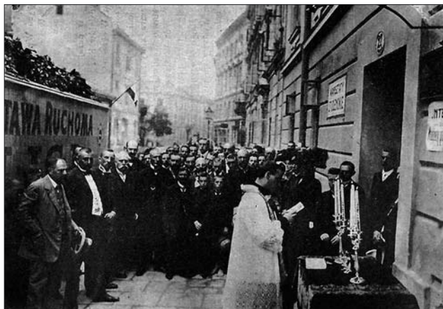
Іл. 2. Посвячення «Вагону Дримали» Пересувної Виставки