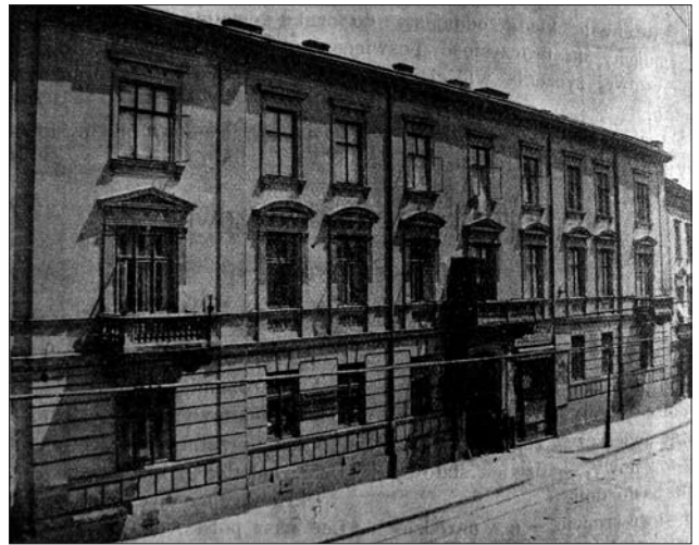
Іл. 1. Будівля «Ліги Промислової Допомоги» у Львові перед реконструкцією, вул. Панська, 11)

Актуальність статті полягає у вивченні діяльності осередків «Ліги Промислової Допомоги» на Станиславівщині початку ХХ ст., у контексті яких досліджується розвиток текстилю, вбрання та мережива. Наукова розвідка має на меті продемонструвати дієві результати промоції станиславівських локальних промислів і ремесел через агітаційну діяльність, виставки, фахові лекції, освіту, торгівлю.