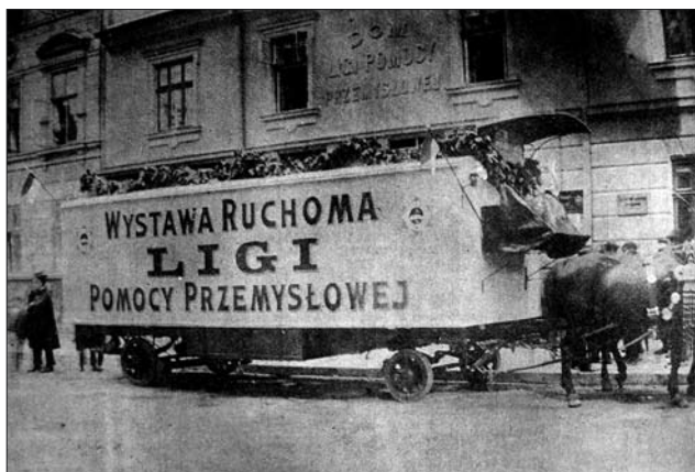
Іл. 3. Виставковий вагон Пересувної Виставки (Джерело: Sprawozdanie «Ligi Pomocy przemysłowej» za czas od 1 lipca 1911 do 31 grudnia 1914. i przegląd działalności za czas 10-lecia. Lwów, 1914. S. 134)

личини зокрема на поч. ХХ століття [16, с. 29; 17]. Особливу увагу приділяли домашнім селянським промислам, які мали давню традицію, але функціонували лише в умовах домогосподарства або були занедбані. До таких почасти належали ткацтво (ткацький промисел), вишивка; новаторським вважалося виготовлення мереживних виробів і оздоблення та трикотажний промисел.