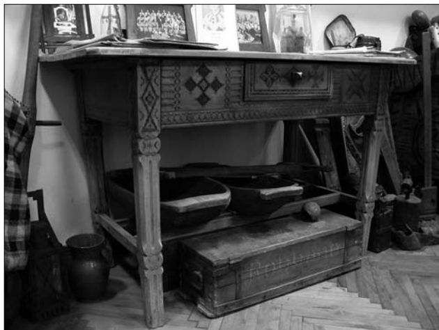
Іл. 7. Стіл із шухлядою («писаний»). Пер. пол. XX ст. Краєзнавчий музей Делятина.

щини й Покуття). Такої форми церковні скарбнички відомі ще з XVIII ст. [7, с. 318].