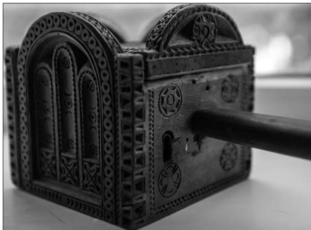
Іл. 5, 6. Скарбничка (скорбонка) з церкви Святого Іоана Богослова з присілку Луг (сmt Делятин). Василь Турчиняк. Датована 1912 р. із написом всередині: Василь Турчиняк. Краєзнавчий музей Делятина.