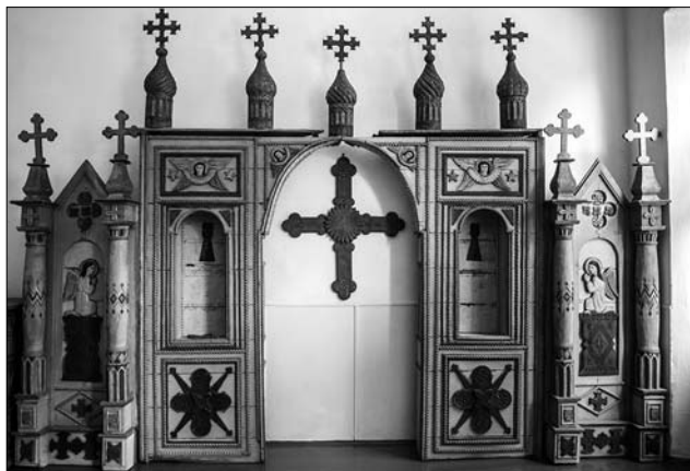
Іл. 1. Конструкція запрестольної частини вітваря церкви Святого Іоана Богослова з присілку Луг (сmt Делятин). Василь Турчиняк. 1912—1931 рр. Краєзнавчий музей Делятина.