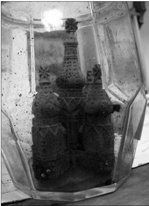
Іл. 8. Модель дерев'яної церкви в карафі. Василь Турчиняк, 1900—1939 рр. Краєзнавчий музей Делятина.