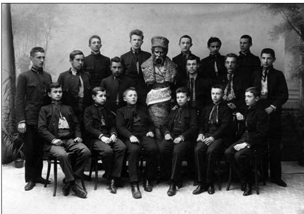
Іл. 5. Група гімназистів: Посередині погруддя Т. Шевченка С.Р. Левандовського. 1889?, фотографія