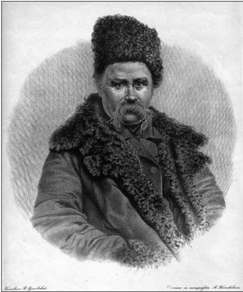
Іл. 1. Гутовський В. Портрет Тараса Шевченка. 1862, літографія; ЛННБ