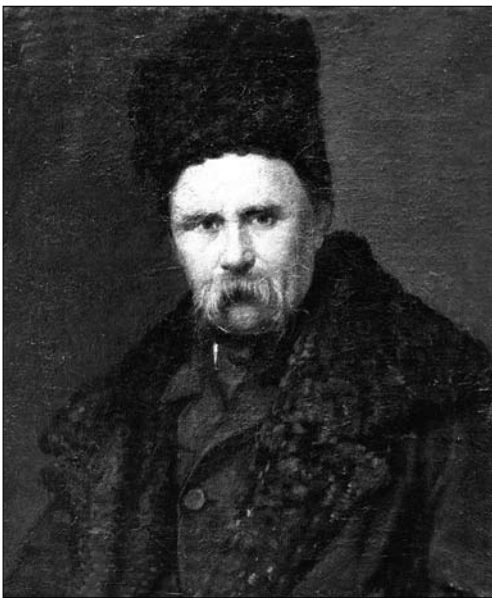
Іл. 2. Гаврило маляр. Портрет Тараса Шевченка. 1864, полотно, олія; НМЛ імені Андрея Шептицького

У 1864 р. академічна молодь купила портрет, намальований на полотні. Цього ж року його виставили у церкві на час богослужіння [23]. Згодом олійний портрет частіше згадували на святкуваннях Шевченківських днів, які, зазвичай, відбувалися у другій половині дня. Так, у 1866 р. його планували показати у світлі бенгальських вогнів після закриття вистави «Назар Стодоля» Т. Шевченка у залі Народного Дому [24, с. 75]. Про нього написали у 1869 р., коли до організації святкувань долучилося новостворене товариство «Просвіта»: «Головна саля, приу-