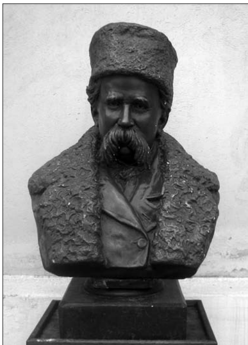
Іл. 6. Левандовський С.Р. Портрет Тараса Шевченка. 1889, гіпс; ЛННБ

якого загострилася на початку 1890-х рр. Погруддя Т. Шевченка набуло широкої популярності. Воно було у приміщеннях багатьох українських товариств, у навчальних закладах і домах. Фото-листівка початку ХХ ст. з Музею Наукового товариства імені Шевченка (топографічний шифр 32635/10; нині ЛННБ) кращим чином демонструє його значення у середовищі учнівської молоді (іл. 4).