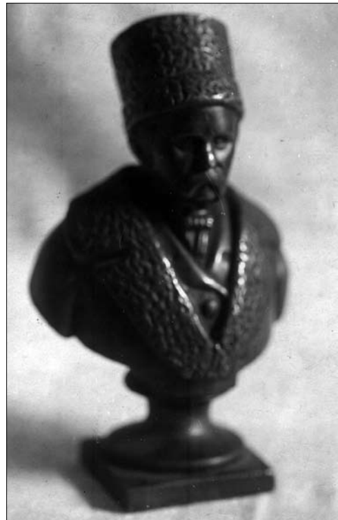
Іл. 3. Рамазанов М. Портрет Тараса Шевченка. 1859, бронза; місцезнаходження не встановлене

Портрет Т. Шевченка в скульптурі на західно-українських землях обговорювали з 1867 р., коли В. Шашкевич висловив думку про встановлення у Львові пам'ятника Кобзареві [35, с. 133]. Суспільство Галичини було обізнане з погруддям поета, яке виконав Микола Рамазанов з натури у Петербурзі (1859 [36, с. 4]). Відомо, що «портрет Т. Шевченка [був] розміром у пів натури, з базою нижче грудної клітини, в шапці й кожусі — нагадує фото 1859 р.» [36, с. 4]. На популярність твору М. Рамазанова вказує фотографія (іл. 3), яка сьогодні знаходиться у фондах Львівської національної бібліотеки України імені В. Стефаника (далі — ЛННБ). Вона походить із Музею Наукового товариства імені Шевченка (топографічний шифр 25976/6). Увагу привертає напис на її звороті: «Бронзовий бюст Шевченка | що був по переказу подарова- | ний Шевченкови його прия- | телями після повороту із | заслання | власність