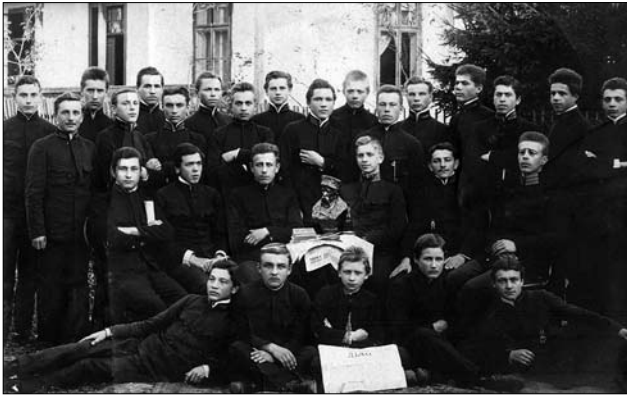
Іл. 4. Група гімназистів: Посередині погруддя Т. Шевченка Т. Баронча. Початок ХХ ст., фото-листівка