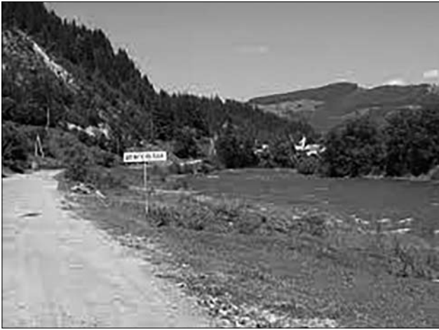
Іл. 5. Село Довгополе, Вижницький район, Чернівецька обл.

1903 рр. подорожував цим краєм, де зібрав багатий фольклорний, діалектологічний та етнографічний матеріал. Шість томів цих знахідок опубліковано у виданнях НТШ. Володимир Гнатюк переконливо довів, що українці цього краю — складова українського народу. Цей висновок вченого актуальний донині. Рецензуючи статистичні дані про Закарпаття Володимир Гнатюк доводив фальшивість та упередження мадярської влади щодо українців. Великий науковий набуток вченого — це й, поза сумнівом, значна організаційна праця о. Юрія Жатковича.