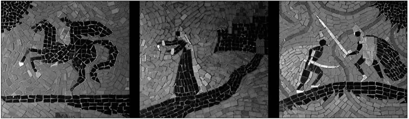
Іл. 2. І. Носик. Мозаїка, триптих з серії «Князь Ігор» («Плач Ярославни», «Князь Ігор», і «Бились день і бились другий»), смальта