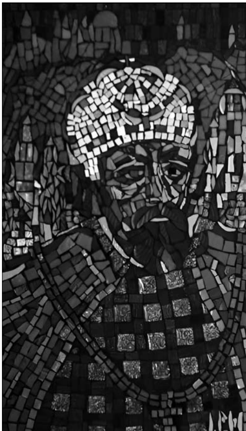
Іл. 3. І. Носик. Мозаїка «Князь Володимир Великий», смальта

історії України-Русі, відтворення знакових сюжетних ліній-персонажів: «Князь Ігор», «Плач Ярославни», «Бились день і бились другий» (іл. 2). Твір складається із трьох частин, розташованих на одній площині, усі самостійні та завершені, проте взаємодіють між собою у колористичному та композиційному плані. Вони розповідають про похід князя Ігоря на половців 1185 року з метою повернення до Руських земель Тмутараканського князівства. Ліва та права