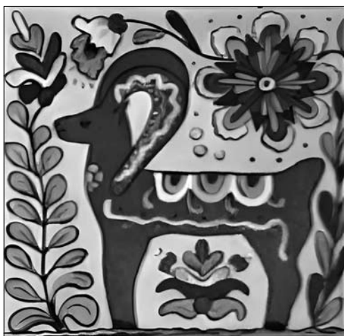
Іл. 10. І. Носик. Кахлі. Фото з приватної колекції Дарії Даревич

но виробу, виконані технікою гравірування по сирому побіленому черепку і розписані червоним ангобом та глазурами — зеленою, жовтою (іл. 10). Саме ця декоративна техніка — техніка ритунання є специфічною рисою гуцульської кераміки, яка виділила її з сусідніх гончарських центрів та обумовила розвиток своєрідної системи оздоблення кераміки» [7, с. 82].