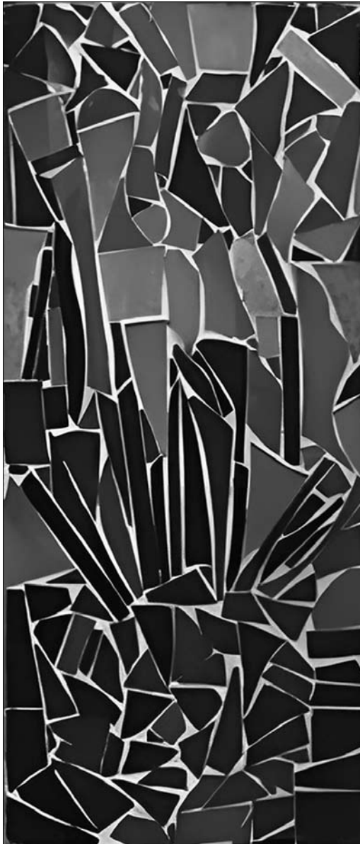
Іл. 9. І. Носик. Абстрактне мозаїчне панно № 3

єю поєднання різноманітних кольорів для створення оптичної ілюзії, злиття кольору, в результаті якого умовно простежуються обриси об'єктів. На абстрактних панно Ірени Носик присутні геометричні фігури, візерунки, лінії, кола.