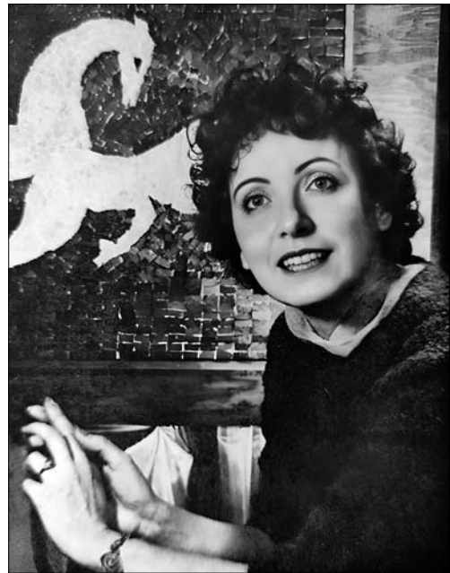
Іл. 1. І. Носик. Фото з обкладинки «Ми і світ». Торонто, грудень 1959 р.

Твори Ірени Носик наповнені національно-патріотичним змістом, багато з них прямо пов'язані з історією України, відображають героїчні події та явища суспільного життя українців. Багато її робіт створені на історичну тематику, зокрема триптих «Слово о полку Ігоревім», «Княгиня Ольга», «Князь Володимир», «Король Данило», «Лови». На міфологічну тематику — «Купало», «Лукаш і Мавка». Анімалістичні, натюрмортні, пейзажні мозаїчні панно: «Коні», «Соняшник», «Квіти у синьому горщику»,