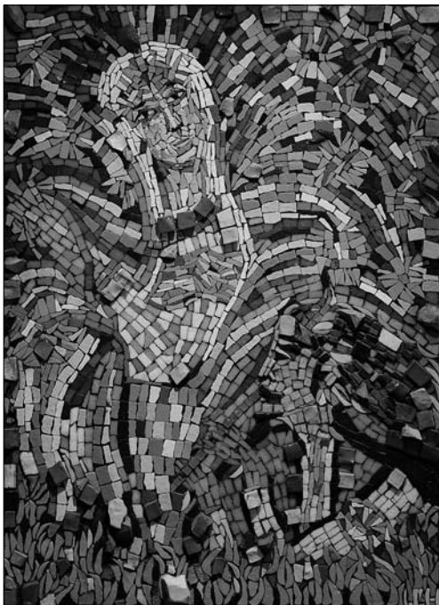
Іл. 7. І. Носик. Мозаїка «Мавка і Лукаш», фото з вистави УСОМ, вересень 2017 р.

зуб»). У цій роботі авторка акцентує емоційний стан героїні. Ірина зображає Ольгу у величі, хоча залишає місце для жіночої туги.