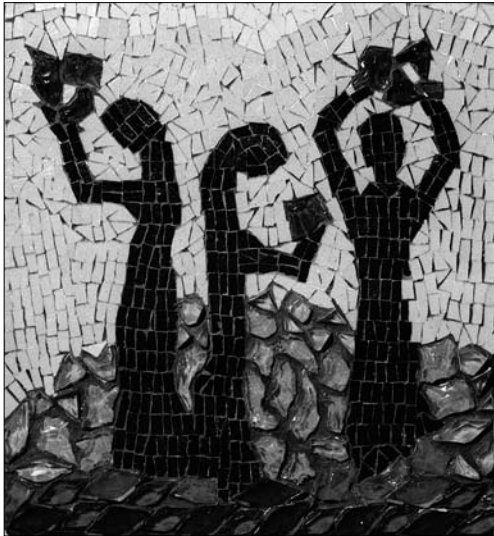
Іл. 6. І. Носик. Мозаїка «Купало», 1979—1980-ті.