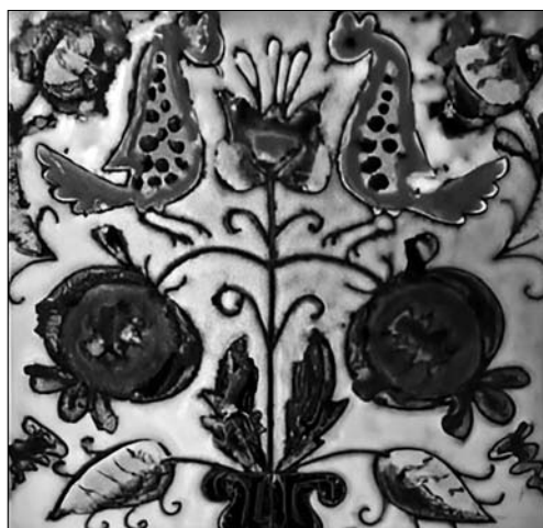
Іл. 12. І. Носик. Декоративний кахель «Дерево життя».

пільців III тисячоліття до нашої ери. Даний образ є популярним в українському декоративному мисте-