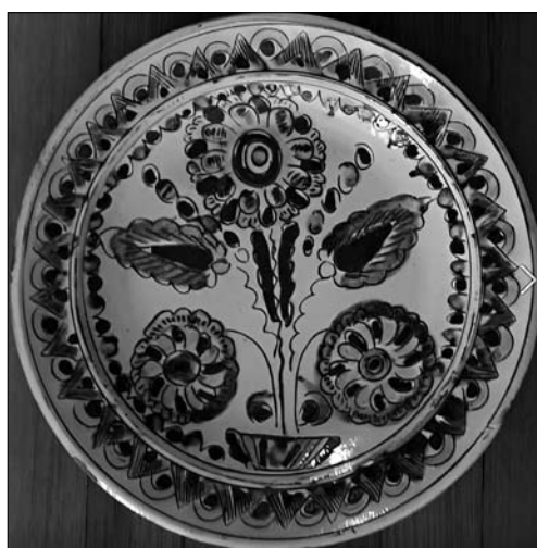
Іл. 11. І. Носик. Керамічні декоративні тарілки.