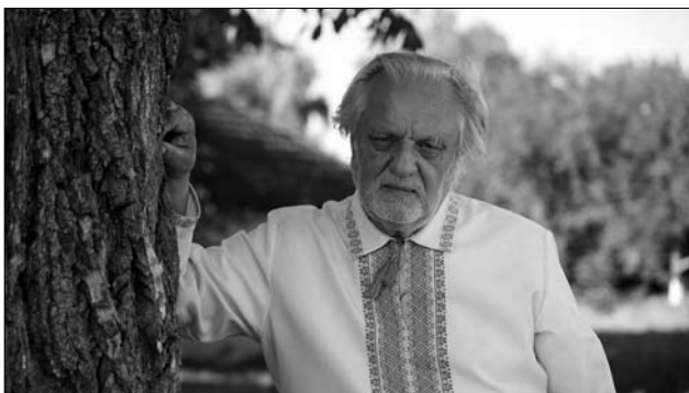
Іл. 1. Микола Андрійович Горбаль

Відомий український правозахисник, політик (Народний депутат України 1994—1998 рр.), шістнадцятилітній політичний в'язень радянського режиму, громадський діяч, поет і прозаїк Микола Горбаль (іл. 1) якось сказав таку фразу: «Коли нації важко, то Бог посилає потрібних людей». У Символі Віри, тобто в молитві «Вірую», про Духа Святого сказано, що Він є Той, «що говорив через пророків». Отже, через окремих, вибраних, Бог доносить до людей