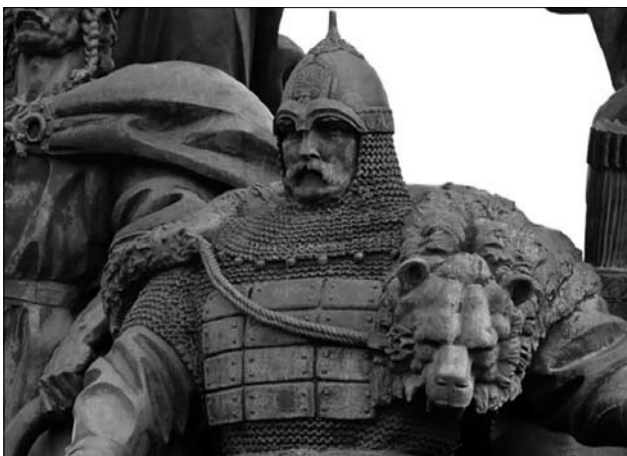
Іл. 4. Фрагмент скульптурної композиції на Майдані Незалежності, присвяченій засновникам Києва. За Інтернет-джерелом [14]

Одцурається брат брата І дитини мати. І дим хмарою заступить Сонце перед вами, І навіки прокленетесь Своїми синами! Умийтесь! образ Божий Багном не скверніте [13].