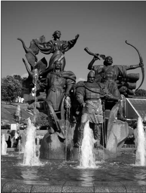
Іл. 3. Скульптурна композиція на Майдані Незалежності, присвячена засновникам Києва.