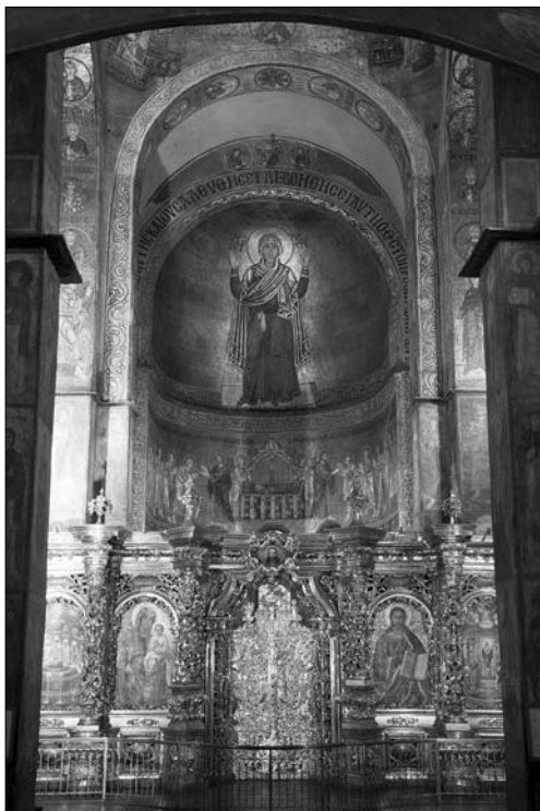
Іл. 1. Храм Святої Софії. Видля на апсиду з Богоматір'ю Орантою. Мозаїка. Київ, бл. 1018 р.