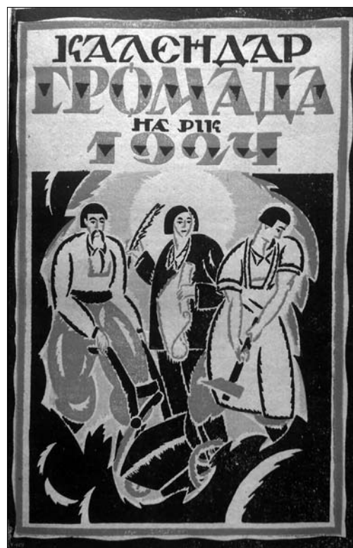
Іл. 1. Календар «Громада» на рік 1924. Обкладинка