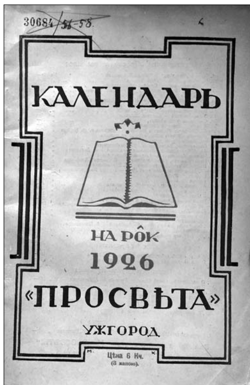
Іл. 3. Календарь «Провіста» на рік 1926. Обкладинка

природи бджоли та її роботи внаслідок відсутності сучасної пасічницької літератури і свідомості, ігнорування суспільної значимості пасічництва. При-