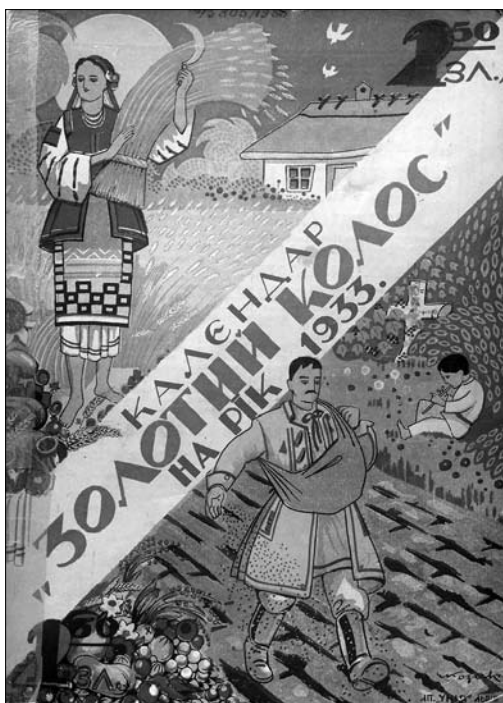
Іл. 6. Календар «Золотий Колос» на рік 1933. Обкладинка

номічну кризу, чисельно помітно зріс та охоплював понад 400 членів і до 10 організацій, посідав власні майстерні для виготовлення водини, вуликів, приладдя з найкращим закордонним обладнанням. Замовлення виконувалися якісно і вчасно. Кооператив почав забезпечувати своїх членів неоподаткованим цукром, проводив комісійний продаж меду, торгував пасічницьким інвентарем, першокласною штучною водиною, насінням медодайних рослин, вуликами нових модифікацій.