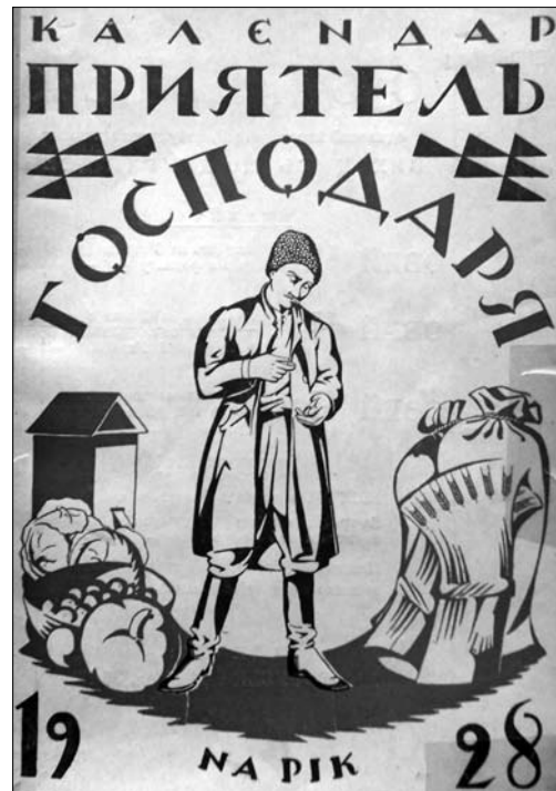
Іл. 4. Календар «Приятель Господаря» на рік 1928. Обкладинка

У пасічницькій рубриці календаря за 1929 р. [14], що вийшов накладом уже 15000 примірників, вміще-