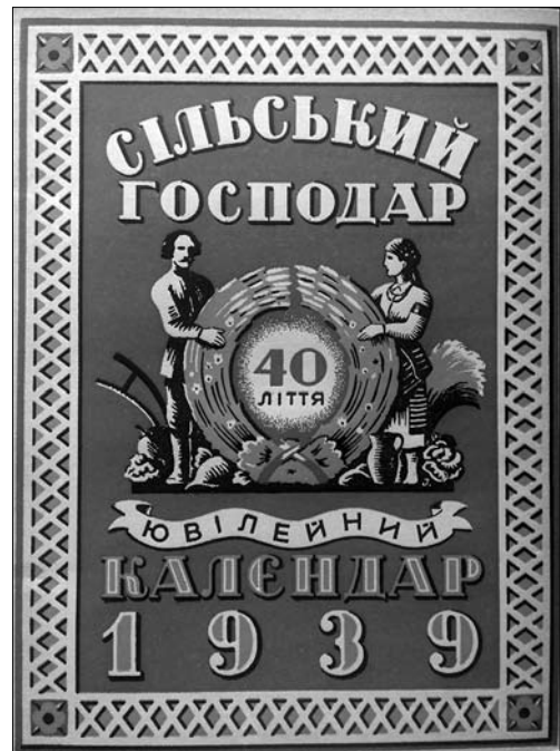
Іл. 7. Ювілейний календар «Сільський Господар» на рік 1939. Обкладинка