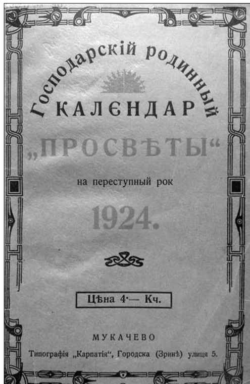
Іл. 2. Господарський родинний календар «Провіста» на рік 1924. Обкладинка