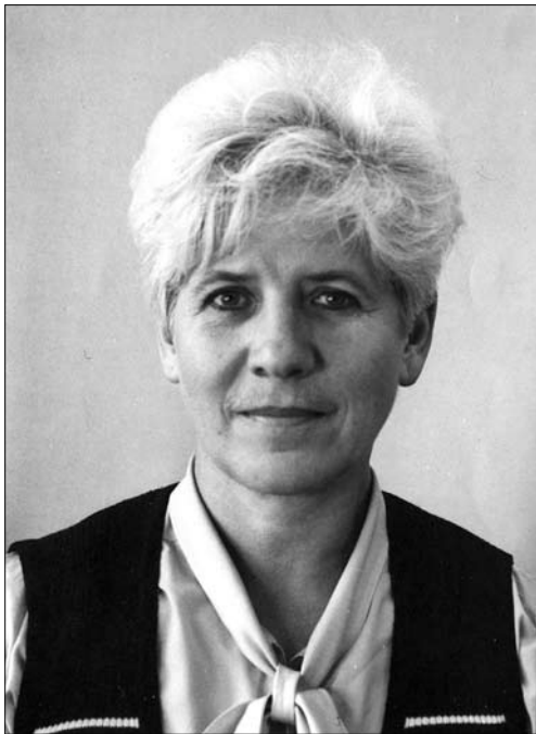
Іл. 6. Ріоріта Старовойтова (1943—2020).