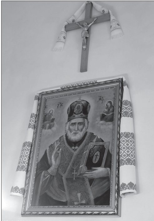
Іл. 2. Храмова ікона Миколая Чудотворця в селиській церкві, осв'яченій на честь Святого Миколая