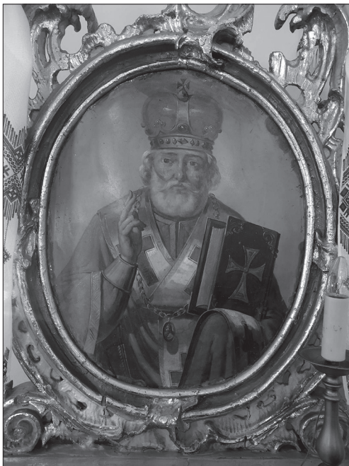
Іл. 3. Селиський образ-феретрон (двобічний) Святого Миколая

лівський Золотоверхий монастир, де зберігалися моці Варвари, що стало для вірян ще одним доказом їхньої чудотворності та сили заступництва великомучениці [6].