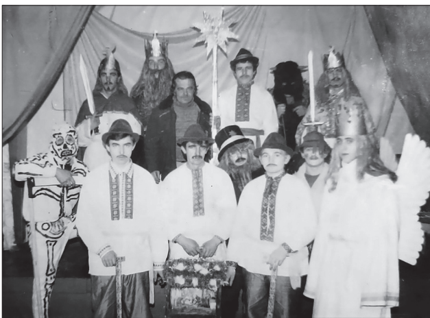
Іл. 6. Селиські вертепники, 2006 рік. Фото Марії Войтків