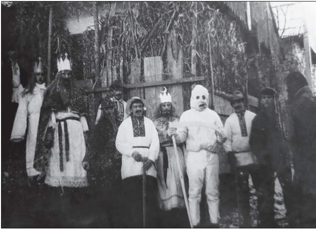
Іл. 5. Селиські вертепники, 1990 рік.