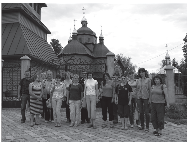
Іл. 5. Учасники експедиції «Покуття» біля церкви Різдва Пресвятої Богородиці. м. Тисмениця, 2014

гуцульську, лемківську, буковинську, закарпатську і біля десятка підтипів та груп. Монографія вченого «Сакральна дерев'яна архітектура українців Карпат: культурно-традиційний аспект» стала основою його наукового зростання — Ярослав Тарас здобув ступінь доктора історичних наук.