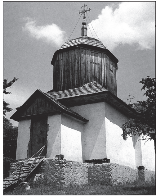
Іл. 2. Церква в с. Ворнічени, 1791 р. Молдова. Реставрована в 1970-х рр. Архітектор Я. Тарас

Ще тільки наукове середовище з насолодою обмірковувало вагомість словникового видання, базоване на величезному масиві фактографічного матеріалу, спеціальних історіографічних відомостей, доречній компаративістичній даних сакральних конструкцій і будівельної культури багатьох європейських народів