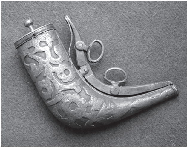
Іл. 4. Порохівниця-натруска зі збірки старожитностей М. Грушевського.

графії, народного мистецтва українців. Він уважав, що батьківщинознавство немислиме без вивчення минувшини тих спільнот, з якими наші предки віддавна перебували в тісних економічних, політичних і культурних взаєминах. А це ж доволі широке ареальне дослідницьке поле, пов'язане насамперед із близьким розташуванням України до Сходу: «Степовий пояс на полудні служив широким шляхом з Азії в Європу» [22, с. 12].