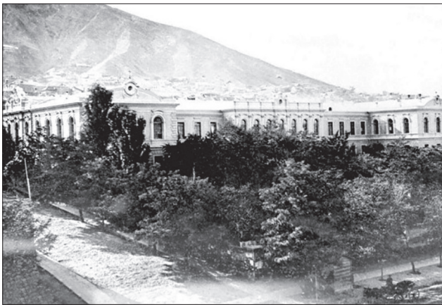
Іл. 2. Перша Тифліська чоловіча гімназія.

1880 рр. він мешкав у Кутаїсі, Ставрополі та Владикавказі, де батько обіймав посади вчителя, інспектора й директора училищ; протягом 1880—1886 рр. навчався в гімназії Тифліса (іл. 1, 2). Однак інтерес до культури тамтешніх народів не був тоді головним для юнака. Під впливом батькових розповідей і літніх поїздок до родини на Батьківщину він найперше зацікавився історією, культурою та літературою власного народу. Заповзятю студював пра-