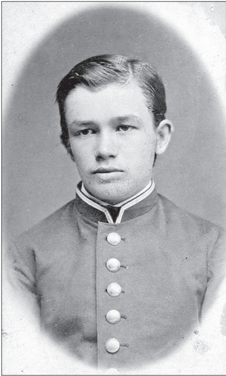
Іл. 1. М. Грушевський — випускник Тифліської гімназії (1885 р.).