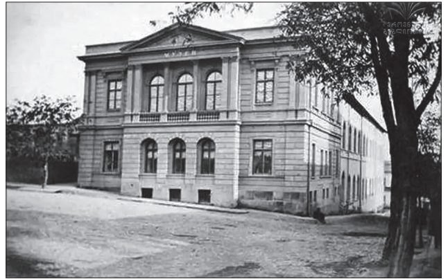
Іл. 3. Кавказький музей у Тифлісі. 1880—1890.

Відтоді ж майбутнього історика почало захоплювати колекціонування предметів старовини. У неділь-