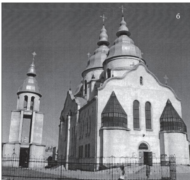
Іл. 4. а) Церква св. Петра в м. Тернополі (1997—2005); б) церква Вознесіння Господнього в м. Львові (1993—2004); в) церква Воскресіння Господнього в м. Білому Стоці, Польща (1980—1990-ті рр.)

св. Стефана в Калгарі, Канада; церква св. Йосифа в Чикаго, США; храм Воскресіння Господнього в Білостоці — Сонячний Стік, РП, 1980—1990-ті рр. чи церква Преображення Господнього в Білостоці, РП. Тут представлено формування баневих завершень храмів як певні асоціативні вираження, проте їхнє матеріально-образне втілення сакральної суті не