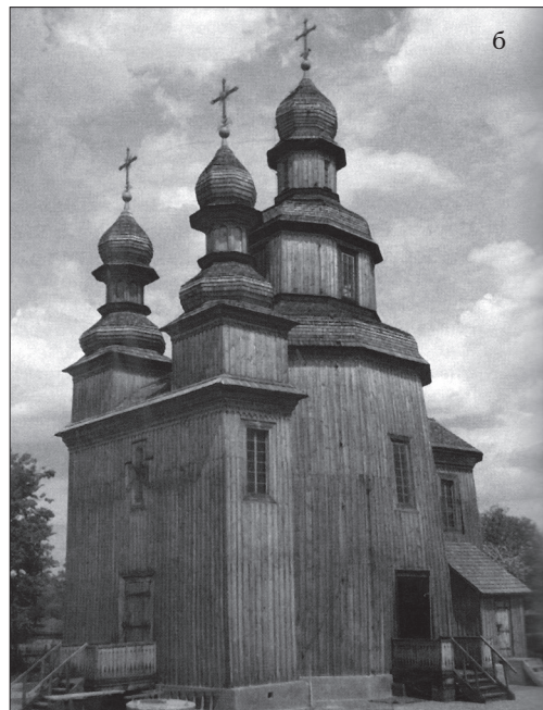
Іл. 2. а) Церква Всіх Святих у Києво-Печерській Лаврі (1698); б) церква св. Миколи Чудотворця в м. Новограді Сіверському (1747)

Пресвятої Богородиці в Мразиці, 1929 р.; церкві в Михайлівцях на Закарпатті, 1935 р., церква Преображення Господнього, с. Люблинець Старий, Любачівщина, Польща, 1926 р., церква св. Арх. Михаїла м. Неслухів, Львівщина, 1896 р., церква Вознесіння Господнього на Старому Знесінні у Львові, 1897—1901 рр. та інші. Взірцями дерев'яних церков є храми: церкви в с. Климці, 1926 р., в с. Гребенові, 1928 р., у с. Верхньому Синьовидному, 1940-ві рр. чи церква Зіслання Святого Духа в с. Лінені Великій, 1905 р. (іл. 3).