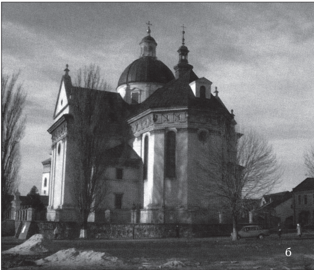
Іл. 1. а) Церква св. Успіння Богородиці та каплиця Трьох Святителів у Львові (1591—1629); б) собор св. Лаврентія в м. Жовкві (1606—1618)

церков з вежоподібними верхами. Вони групувалися, як і в дерев'яних взірцях по одній лінії в тридільних церковних будівлях чи навхрест, як у п'ятидільних (хрещатих) храмах. Одноверхі церкви найчастіше зводили на хрещатій планувальній основі, а у планувавальному вирішенні переважали гранчасті форми храмових просторів над рівнобічними (прямокутними), так і підбанники зустрічаються частіше гранчасті, аніж круглі (циліндричні) [18, с. 159—165; 19, с. 288—296; 20, с. 51—59].