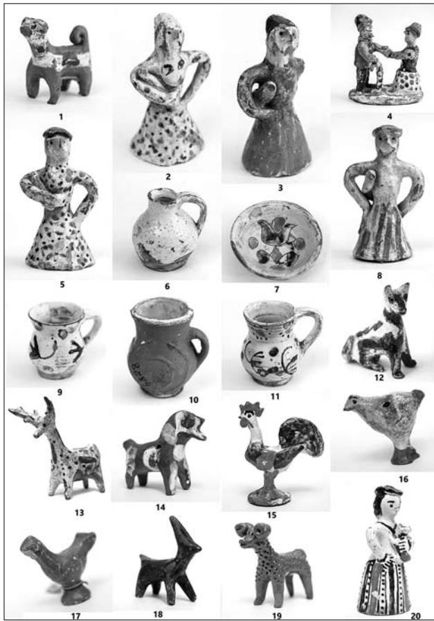
Іл. 3. Іграшки. Автори невідомі, м. Бар, друга половина ХІХ — перша чверть ХХ століття. Вінницький обласний художній музей (1—11), Національний музей декоративного мистецтва України (12), Національний центр народної культури «Музей Івана Гончара» (13), Музей етнографії та художнього промислу Інституту народознавства НАН України (14—20).

лася І Всеукраїнська артрезиденція «Три площини Барської кераміки», яка об'єднала 55 кращих гончарів, художників та фотографів з 11 регіонів України. Учасники створили понад 50 картин, більше 300 гончарних виробів та понад три тисячі художніх світлин, центральним сюжетом яких стала барська кераміка. Ці мистецькі роботи виставлялися у Вінницьких обласному художньому музеї та центрі народної творчості, артпросторі «ЕтноЧари» (м. Вінниця), закладах освіти м. Бар. Надходять запрошення на проведення виставок в інших регіонах України.