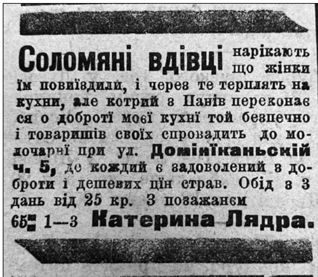
Іл. 4. Оголошення Катерини Лядри. URL: Обід за 25 кр. Діло. Львів, 1903. Ч. 198