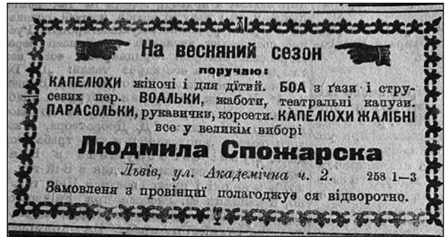
Іл. 2. Оголошення Людмили Спожарської. URL: На весняний сезон поручаю. Діло. Львів, 1905. Ч. 61

Окрім того, багато українок було «власницькими» продовольчих магазинів — Катерина Криштальська відкрила перший український магазин з вудженіною у будинку Товариства «Дністер» на Руській [36, с. 4]; Руська овочарня Антоніни Мурської на вул. Чарнецького, 4 [37, с. 4]. Популярними серед жіноцтва були цукерні. Наприклад, «Цукорня Анелі Курнах» (іл. 3) на площі Ринок, 34 щороку перед