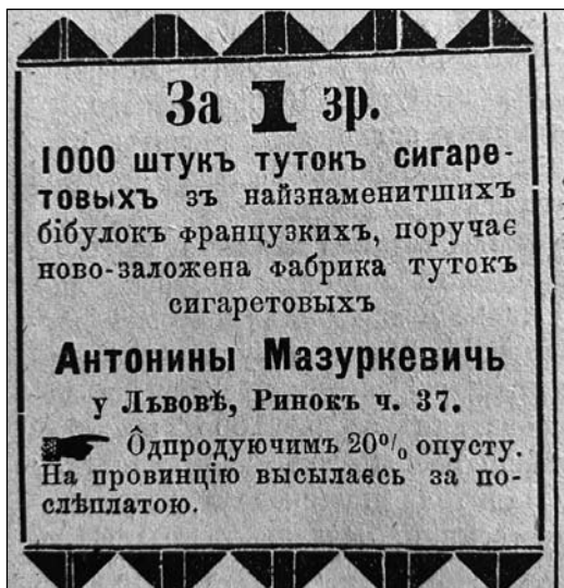
Іл. 5. Оголошення Антоніни Мазуркевич. URL: Тутки. Діло. Львів, 1890. Ч. 8