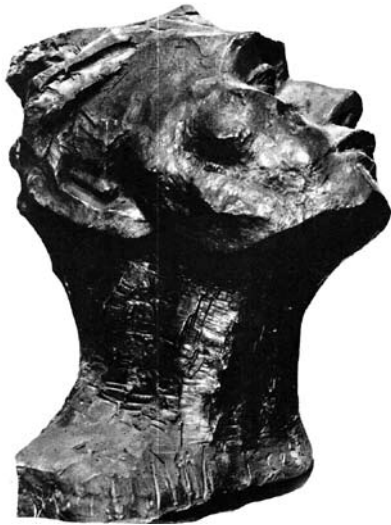
Іл. 4. Іван Севера. Пацифікація. 1933