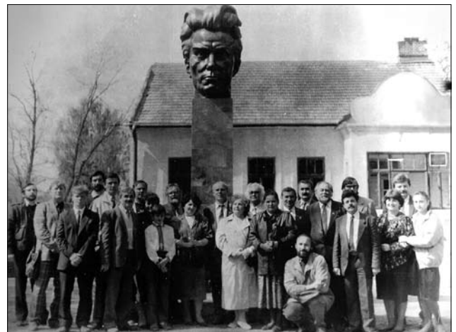
Іл. 8. Відкриття пам'ятника І. Севері авторства Юліана Савка 4 червня 1991 р. Село Новосілки Яворівського р-ну

Висновки. В історії українського образотворчого мистецтва Іван Севера посідає вагомe місце як скульптор і педагог. Разом з тим його великий творчий спадок досі залишається освоєним лише частково, а фахова кваліфікація його авторської пластично-образної мови потребує більш системного підходу. Реалізувати цю задачу необхідно разом з питаннями популяризації знань про його родинне життя, ціннісні зв'язки з місцями його дитинства, з комплексом питань національної культурної пам'яті опосередковано через його складну творчу біографію. Враховуючи дієвість такої галузі, як культурний менеджмент, село