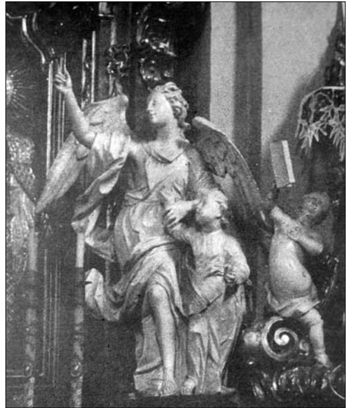
Іл. 7а. Й.Г. Пінзель. «Ангел-охоронець», костел Внебовзяття, Бучач (злам 1740-х —1750-х рр.)

Подібним змістом наділена меморіальна скульптурна група пам'яті Джузеппе Мангілі, виконана бл. 1811 р. скульптором Луїджі Трецца у церкві Св. Апостолів / Chiesa dei Santi Apostoli у Венеції. Ця скульптура також репрезентує ангела-охоронця, як того, що після смерті супроводжуватиме душу свого підопічного до раю: вгорі ангел піднімає душу померлого Мангілі у вигляді малого хлопчика. Вказані приклади лише підтверджують як популярність, так і розмаїтість іконографічного сюжету «Ангел-охоронець» у католицькому мистецтві XVIII ст. А