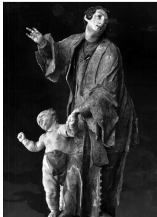
Іл.2. Й.Г. Пінзель. «Св. Вікентій» костел Успіння/Внебовзяття у Бучачі (1750-ті рр. ТОКМ)

Один із перших взірців такої іконографії віднайшовся в описах руської унійної церкви в Римі — колишнього храму Св. Сергія і Вакха/Santi Sergio e Vasso, неподалік від парафіяльної латинської церкви Madonna dei Monti. З 1641 р., згідно з брєве папи Урбана VIII, ця церква стала храмом для усіх вірних унійної конфесії з теренів Речі Посполитої та адмініструвалася василіянами під наглядом конгрегації Propaganda Fidae [23, с. 138]. Питаннями реновації цієї церкви і підтримки руського кліру у Римі опікувався кардинал Антоніо Барберіні — брат папи Урбана VIII, великий патрон оновлення церков і знавець мистецтва. Цей кардинал завершив беатифікаційний процес Свмч. Йосафата і вшанував його великою церемонією в церкві Іль Джезу (1643) та фундацією для обнови руської церкви Св. Сергія і Вакха. Ці факти з XVII ст. важливі для розуміння контактів між Святим престолом та унійним духовенством, в тому числі щодо шляхів поширення нових тем і мотивів релігійного мистецтва. Зокрема, із описів цієї церкви середини XVII ст. відомо, що спершу вона мала три вітварі — присвячені Діві