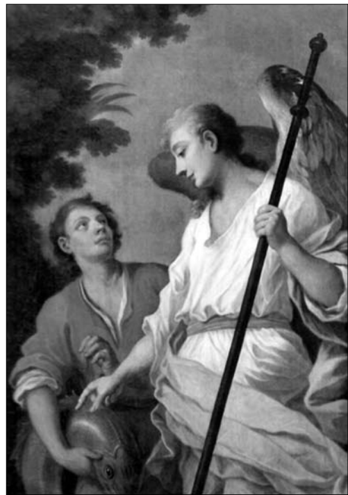
Іл. 4 б. С. Чехович «Товій і ангел» (до 1768 р., ЛННМ)

літів в 1730-х рр. На склепінні при вході до костелу оо. кармелітів фрагментарно зберігся розпис «Молитва Св. Йосифа», базований на апокрифічному тексті, в якому Св. Йосиф перед смертю просить Господа надати йому при переході у вічність супутника — архангела Михаїла [27, с. 137]. У програмі розписів львівського костелу кармелітів цей сю-