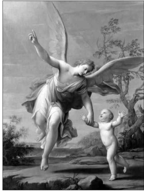
Іл. 4 а. М.-А. Франческіні. «Ангел-охоронець», 1715 р.

Із релігійної традиції трансформації зображення архангела Рафаїла у ангела-охоронця можна назвати твори з різних видів мистецтва XVII—XVIII ст., починаючи від образу Марка Антоніо Франческіні «Ангел-охоронець» (1715 р., іл. 4а), до цілком нарративних біблійних образів «Товій із ангелом» Антона Лосенка середина XVIII ст., чи Симона Чеховича «Ангел і Товій» (до 1768 р., ЛНГМ) (іл. 4б). Як одне потенційне джерело до переосмислення образу ангела-охоронця в нашому контексті варто згадати фрески учня Марка Антоніо Франческіні — Джузеппе Карло Педретті, який працював у Львові над розписами костелу Архистратига Михаїла оо. карме-