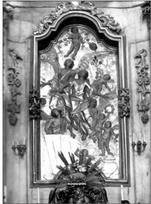
Іл. 9. А. Штіль. «Вознесіння Богоматері» із вівтаря костелу Внебовзяття Пресвятої Діви Марії в Монастирських (1740-ві—1751 рр.)

Не можна також оминати цей мотив у інших, пост-пінзелівських проектах декору унійних церков Галицько-Львівської єпархії. Насамперед, це дияконські двері собору Св. Юра у Львові, виконані за проектом Себастьяна Фесінгера сницарем Михайлом Філевичем (1768—1770 рр.) у техніці ажурного різьблення-трельяжу. В описі цих дияконських дверей вірно згадано барельєф з зображенням архангела Михаїла, і помилково атрибутований архангел Гавриїл, хоча зображення фігури з посохом і рибою однозначно вказує на архангела Рафаїла, саме в іпостасі ангела-охоронця [8, с. 906]. Очевидним наслідуванням внутрішньої композиції низького іконостасу та вівтаря собору Св. Юра є опорядження львівської Успенської церкви (1772 р.), де також представлені два горельєфи на дияконських дверях — архангел Михаїл та архангел Рафаїл як ангел-охоронець