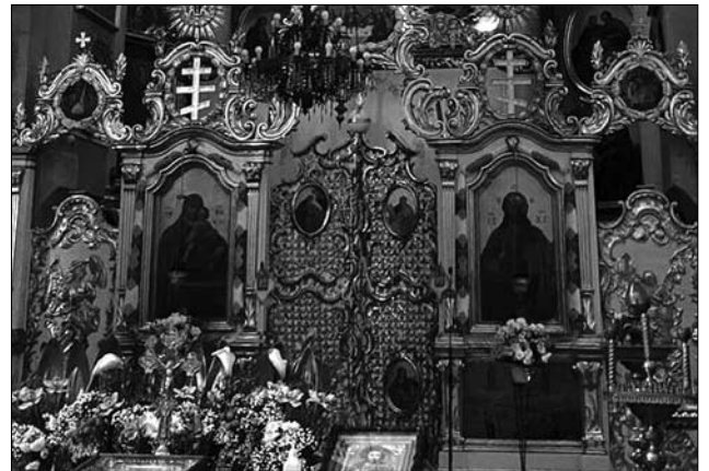
Іл. 10. М. Філевич. Царські врата і дияконські двері Успенської церкви у Львові (1772 р.)

(іл. 10). Дещо епігонським зразком наслідування пост-пінзелівської стилістики, можуть сприйматися барельєфи дияконських дверей церкви Св. Ахристратига Михаїла із с. Жирівка (сер. 1770-х рр., тепер в НМЛ), з зображеннями архангела Михаїла та ангела-охоронця [8, с. 913]. Ця парафіяльна під-львівська церква є цікавим зразком внутрішнього опорядження простору і оновленого репертуару деяких композицій іконостасу. Зокрема, тут також прослідковується низка виражених марійних мотивів — у Царських вратах замість Благовіщення за-