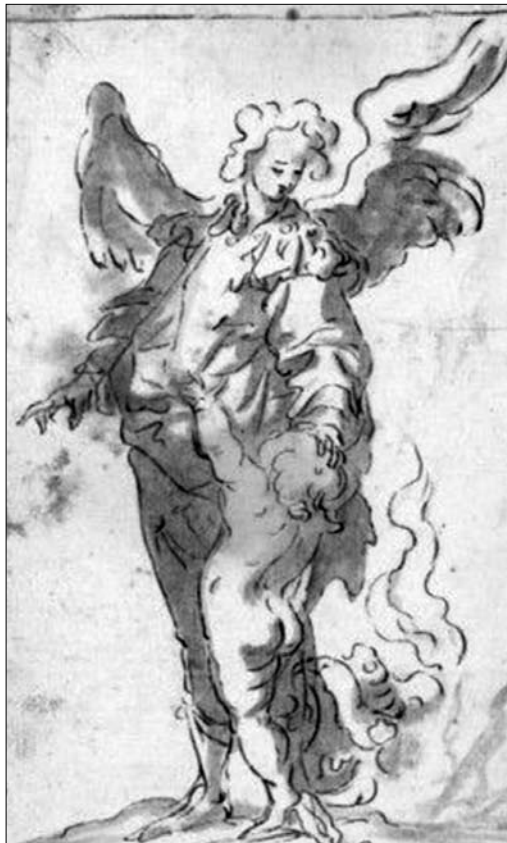
Іл. 5 б. Ф. Ерера-молодший (іспанська школа XVII ст.). «Ангел-охоронець», перо. URL: https://www.delamano.eu/work/the-guardian-angel

жет молитви про добру смерть кореспондує із розписом головного склепіння — зображенням архангела Михаїла.