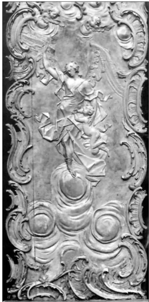
Іл. 7 б. Й.Г. Пінзель, рельєф дяконських дверей з мотивом «Ангела-охоронця», церква Покрови у Бучачі (1750-ті рр.)