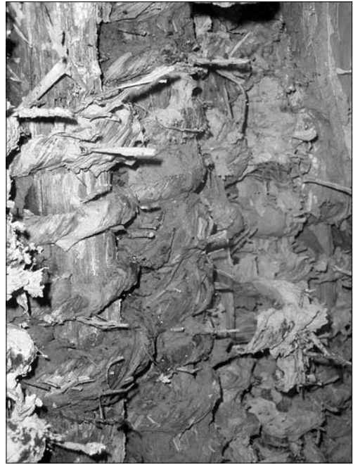
Іл. 4. Заповнення стіни плотом з солом'яних перевесел; с. Моринці Корсунь-Шевченківського р-ну Черкаської обл.

Не можна оминати увагою ще одну модифікацію стін з плоту. Зокрема Ф. Вовк відзначав: «Нам траплялося чути, що в деяких місцевостях стіни робили з подвійної ліски, а в проміжжя між лісками набивали якомога щільніше глину; глиною обмазували й ліски зовні, але на свої очі бачити таких плетених хат нам не довелося» [9, с. 100]. Оселі з такою модифікацією стін згадуються у джерелах середини ХІХ ст. на теренах лівобережжя: «В інших місцевостях плетень роблять у два ряди і вузький простір [між рядами] набивають глиною, вимішаною з соломою» (Полтавська губернія) [17, с. 25—26]. Згадок про подібні житлові споруди на теренах правобережжя не маємо, проте такі хліви («сараї») у першій половині ХІХ ст. (1852 р.) відзначав І. Фундуклей на пограниччі Полісся та Середньої Наддніпрянщини (південь Радомиського повіту). Автор зауважував, що «у місцевостях, де мало якісної деревини, на сараї використовують стовпи тонші, які називають присошками ; замість дощатих стін простір між стовпами забивається колами чи плотом у два ряди, порожнину між цими рядами набивають гноєм, непридатною для годівлі [худоби] соломою та ін.» [1, с. 268]. Як відзначив дослідник, «такі сараї значно зручніші і тепліші для худоби, особливо для овець, ніж дощаті» [1, с. 268]. Подібні стіни у Васильківському повіті влаштовували у вівчарнях: «стіни роблять з двох плетнів в кожному простінку, на відствні \frac{3}{4} , інколи