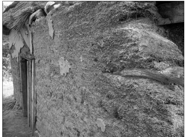
Іл. 2. Стіна, споруджена технікою «в переклад»

багатих людей — то хата робиться вилика... І в заміт закидають деревом кругом і забивають підвалки, що місять з глини іс соломою...» (с. Колодне Тал. Чер.) [3, с. 32]. Оселі, споруджені у такій техніці, обстежені дослідниками у низці населених пунктів: хати 1870 р. у с. Лісове [7, с. 831], 1856 р. у с. Пугачівка [7, с. 832] (Тал. Чер.), 1889 р. у с. Синиця [7, с. 833] (Уман. Чер.), 1861 р. та 1879 р. у с. Заячівка [7, с. 837] (Христ. Чер.). Побутовали вони і на Вінниччині: Джулінка, Флорине (Берш.) Мала Мочулка, Степанівка (Тепл.), Ширмівка (Погриб.) тощо [7, с. 9—11, 71—72].