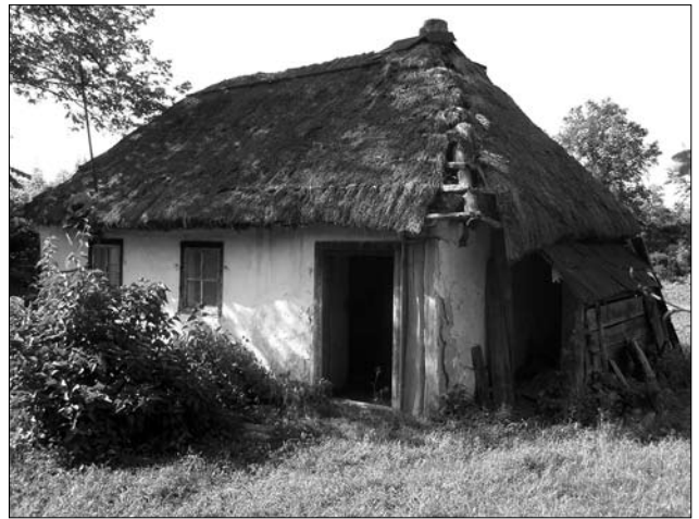
Іл. 1. Хата початку ХХ ст. у с. Деренківець Корсунь-Шевченківського р-ну Черкаської обл.

Будівлі споруджені у цій техніці відомі на більшій частині правобережжя (Корсунь-Шевченківський, Тальнівський, Уманський, Христинівський, Черкаський, Смілянський, Чигиринський р-ни Черкаської; Погрибищенський, Теплицький, Бершадський Вінницької областей тощо). Скажімо, відповідно до інформацій, на переломі ХІХ та ХХ ст. такі будівлі траплялись доволі часто у с. Козаче (Христ. Чер.). Це ж торкається й с. Мельниківці (Сміл. Чер.). Проте коли на півночі та північному сході (у зоні дерев'яного будівництва) хата «в переклад» була ознакою бідніших господарств, на південному заході так будували багатші селяни: «От у