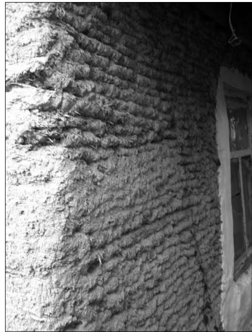
Іл. 6. Монолітна стіна з вальків

Однак, глинобитні хати входили у побут населення Середньої Наддніпрянщини доволі діахронно і з різною інтенсивністю (навіть у сусідніх селах). Однією з найдавніших модифікацій глинобитної хати вважається «хата з вальків» («валькована хата», «мурована хата») (іл. 6). Як уже відзначалось, у південних районах правобережжя Середньої Наддніпрянщини ця техніка поступово входить у побут селян лише на переломі ХІХ—ХХ ст. Скажімо на півдні колишнього Звенигородського повіту (с. Колодисте Тальн. Чер.) у 1905—1906 рр. була лише одна хата «мурована» з глини. Натомість у сусідньому с. Глубічок (Тальн. Чер.) їх уже було більше: «... у Глубічку! — ви де побачете де дирив'яна хата робиться? Але то на сміх не побачете! Все, де ни подивись, то все муровані з глини... Я цієї висни налічив, що в Глубічку мурується з глини цілих тринадцять хат...»