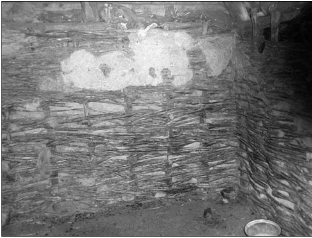
Іл. 3. Заповнення стіни господарської споруди горизонтальним плотом («лісою»); с. Мельники Канівського р-ну Черкаської обл.

ні з лози, відзначав тут Д. П. де ля Фліз (1854 р.): «Селянські житла Київської губернії [...] У деяких місцевостях, де бракує лісу, стіни будинку виплітають з лози або соломи, обмазують глиною і білять [...]» [2, с. 153]. Я. Маркович згадував про їх побутування тут ще у кінці XVIII ст. (1798 р.): «[...] дефіцит лісу замінюють вони застосуванням соломи, нехворощі (Полин звичайний. — Р. Р.), очерету і кізьяків, тобто висушеного гною. Житла свої будують з хворосту і обмазують глиною, так вміло, що здалеку [вони] видаються кам'яними» [11, с. 67].