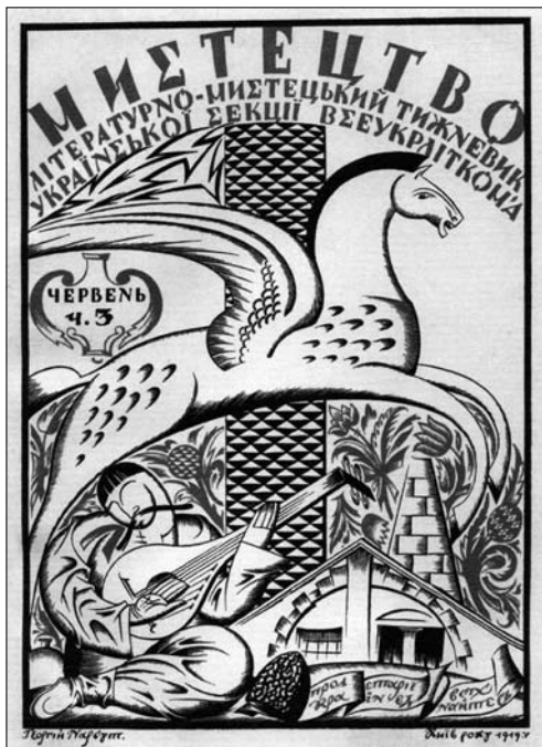
Іл. 8. Георгій Нарбут. Фронтиспіс журналу «Мистецтво». Туш, гуаш, 1919 р.

ніст сюжет розпису. Зауважимо, що композиція Мамаєва із собакою не є поширеною на народних картинах, передусім відома на роботі Домініка де ля Фліза «Розбійник Мамай» (іл. 6), але інтертекстуально ця художня деталь відсилає до українського химерного роману з народних вуст Олександра Ільчен-