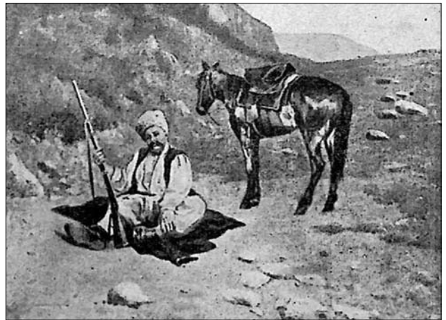
Іл. 5. Сергій Васильківський. Козак Мамає. («Ілюстрації з українського життя до книг та журналів»). Центральный державний архів вищих органів влади та управління України

Хоча в альбомах Васильківського годі знайти сюжет Мамає, втім у Центральному державному архіві вищих органів влади та управління України зберігається робота С. Васильківського «Козак Мамає» у розділі «Ілюстрації з українського життя до книг та журналів» (іл. 5), де у позі Мамає сидить козак, тримаючи в руках рушницю, а позаду осідланий кінь. «У «Козаку Мамає», пише романіст, — весь Васильківський. Веселий. Дотепний. Глибоко