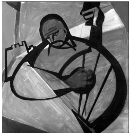
Іл. 10. Алла Горська. Козак Мамає. 1963 р.

жар-птиці» [19, с. 5], у якій використано репродукцією картини Алли Горської «Козак Мамає» 1963 року. Ця робота символічна і для цієї казкової історії про художницю, і для творчості самої Горської, як свідчить артмонографія за матеріалами виставки «Алла Горська. Боривітер» [20, с. 41—47], козак Мамає для мисткині є центральним символом України, окрім репродукованої у дитячій книжці роботи 1963 року (модерного образу Мамає з бандурою, 59 x 58, папір, гуаш) (іл. 10), на виставці й у монографії представлено ще дві роботи Горської під назвою «Мапа України» (1960-ті, папір, гуаш, аплікація). На обох картинах символічно центральною постаттю є Мамає, що грає на кобзі. Портретно різний, але однаково символічно