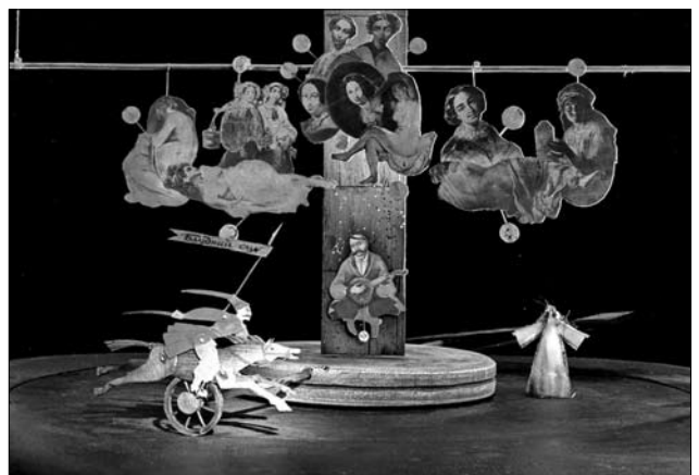
Іл. 2. Сценографія вистави «Боже-ственна самотність» за п'єсою Олександра Денисенка. Режисер Олександр Білозуб, сценографія Андрія Александровича-Дочевського. Театр імені Івана Франка, 2003 р.

та ін. Попри актуалізацію досліджень, присвячених образу козака Мамає в сучасних медіа та наукових студіях, ця проблема досі не була досліджена на матеріалі саме біографічних творів про художників, а також в інтермедіальному аспекті, тож відкриває новий погляд на репрезентацію міфологеми Мамає в художніх творах.