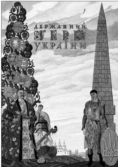
Іл. 7. Георгій Нарбут. Обкладинка проекту великого герба Української Держави, 1918 р.