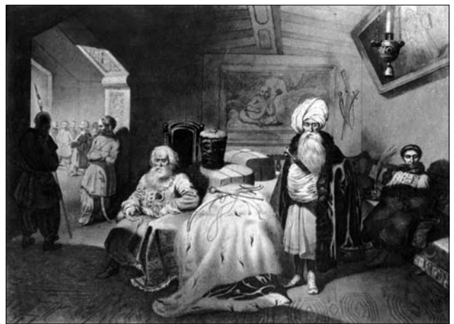
Іл. 4. Тарас Шевченко. Дари в Чигирині 1649 року. Малюнок до офорта. Папір, туш, 1844 р. Національний музей Тараса Шевченка

повіді й живописі Тараса Шевченка, відтак цей образ з'являється і в художній біографії. Шевченко намалював Мамає на роботі «Дари в Чигирині 1649» (1844), де зображення козака-характерника прикрашає інтер'єр гетьманської резиденції Богдана Хмельницького (іл. 3—4) [7, с. 221—223], а в повісті «Прогулянка із задоволенням і не без моралі» у середині 1850-х років зазначав, що в помешканні отця Сави висіло дві картини — портрет Хмельницького та «Козак Мамай» — «портрет, або, як матінка його називає, Запорожець», — «старовинного, але нехитрого письма» [8].