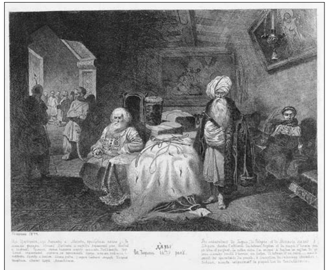
Іл. 3. Тарас Шевченко. Дари в Чигирині 1649 року. Офорт, 1844 р. Національний музей Тараса Шевченка

Шевченків Мамай у біографічному романі Єжи Єнджеєвича. Інтермедіальні перегуки виявляємо в