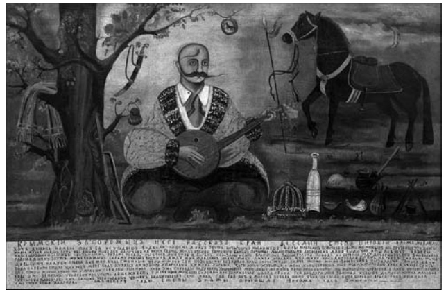
Іл. 1. Народна картина «Козак Мамай». Музей Івана Гончара

Пропоноване дослідження має на меті дослідити образ козака Мамає в художній біографістиці про митців, виявити звернення до образу з народної картини у корпусі літературних творів про видатних українських художників, та проаналізувати функціональність образу Мамає у біографічних текстах. Основним матеріалом для дослідження були охудожнені біографії митців, у яких найвиразніше представлений образ козака Мамає, насамперед це белетризовані біографії Тараса Шевченка, Корнила Устияновича, Антіна Лосенка, Сергія Васильківського, Георгія Нарбута, Катерини Білокур