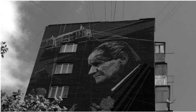
Іл. 14. Мурал на стіні львівської багатоповерхівки на вул. Петлюри, 2 з портретом Героя України Бориса Возницького. URL: https://suspinne.media/lviv/34556-u-lvovi-pamaluvali-mural-prisvacenij-muzejniku-borisu-voznickomu/

чний внесок у національне відродження України, багаторічну подвижницьку діяльність на ниві збереження та популяризації духовної спадщини українського народу, особисті заслуги у розвитку музейної справи директору Львівської галереї мистецтв Борису Григоровичу Возницькому присвоєно звання Герой України з врученням ордена Держави (іл. 13).