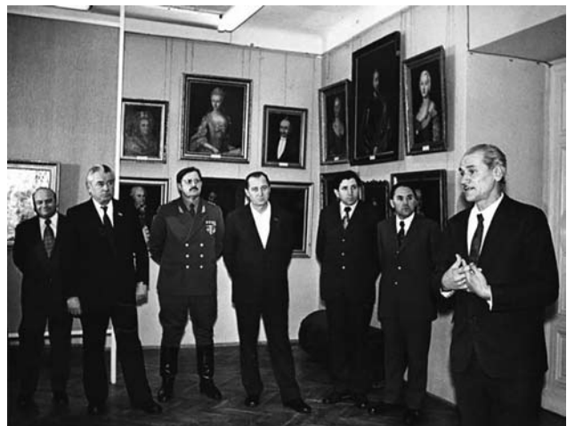
Іл. 8. Відкриття експозиції Олеського замку 21 грудня 1975 року

рей та вже розпочав робити експозицію. Домагався надання коштів для даху надбрамного корпусу в Золочівському замку, який ще у 2011 році зніс буревій. В Олеському та Золочівському замках підготував стіни для експозицій унікальних для України батальних широкоформатних полотен Мартіно Альтомонте «Битви під Віднем» та «Битви під Парканами». Як патріарх музейної справи, вважав — місце цим творам тільки в музеї.