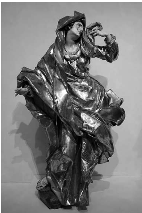
Іл. 10. Богородиця із костелу в селі Годовиця на Львівщині

рінки їхнього життя безперестанно надавали йому романтичного нетерпіння віднайти і зібрати воедино прожите та створене цими людьми. Захоплювався величчю меценатства Миколи Потоцького, який збудував понад сімдесят храмів на нашій землі, запросив Бернарда Меретина — архітектора та вітварного скульптора Іоана Пінзеля, які продовжили свою творчість. Як писав Борис Возницький, великий вплив на них мала наша ікона, візантеїзм. Пінзель довів свою майстерність до вищої мистецької параболи. У рукописах батька можна бачити численні знаки запитань та оклики, сумніви та стверджен-