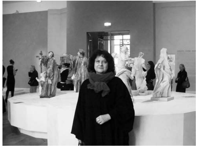
Іл. 15. На відкритті виставки Пінзеля в Луврі, 2012-й рік замок — 2004 р.; Музей модерної скульптури Михайла Дзиндри — 2009 р.; Музей мистецтва та історії Жидачівської землі (задум та розпочаті роботи Б. Возницького, відкрили у 2014 р.).

Завдяки його натхненній і героїчній праці історія українського мистецтва поповнилася численними сторінками, саме йому ми завдячуємо збереженням національної культурної спадщини більше п'ятдесяти тисяч унікальних врятованих пам'яток. Це врятовані ним усі віднайдені 32 скульптури Івана Георга Пінзеля, створений у 2000 р. та діє музей цього унікального скульптора 18 ст.; Каплиця Боїмів — 1967 р. [9]; Музей мистецтва староукраїнської книги — 1975 р.; Олеський замок — 1975 р.; Музей-садиба Маркіяна Шашкевича — 1993 р.; Музей найстаріших пам'яток м. Львова — 1994 р.; Підгорецький замок — 1980—1995; П'ятничанська вежа — 1996 р.; Музей Теодозії Бриж — 2000 р.; Палац Потоцьких (Європейське мистецтво 14—18 ст.); Мистецько-історичний сектор «Жовківський замок» — 2003 р.; Музей-меморіал гетьмана Івана Виговського — 2004 р.; Золочівський