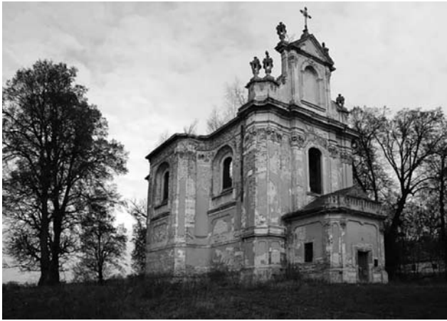
Іл. 9. Костел у селі Годовиця на Львівщині