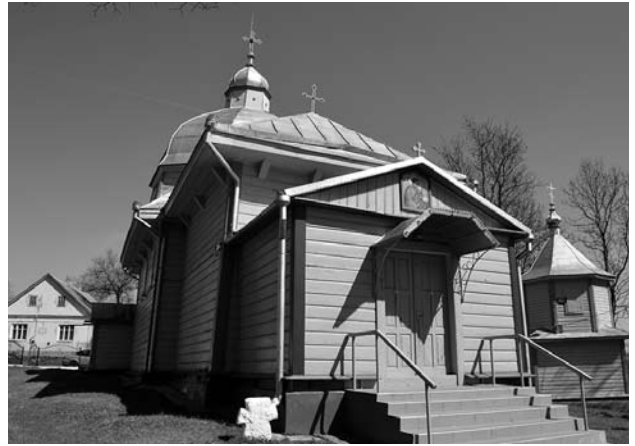
Іл. 3. Церква в селі Ульбарів

Дорога у рідному селі проходила попри рідну хату. Там уже жили інші люди, переселенці. Боляче було дивитися на неї, машиною лише призупинявся і ніко-