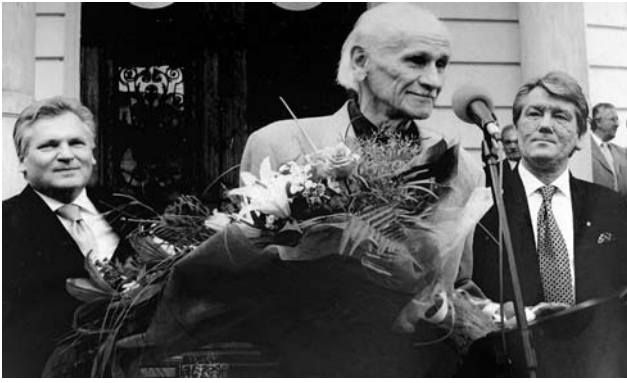
Іл. 13. Вручення Борису Возницькому ордена Держави — Герой України. Справа — Президент України Віктор Ющенко, зліва — Президент Республіки Польщі Александр Квасневський. 2005-й рік