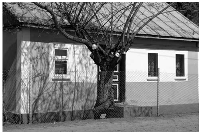
Іл. 4. Родинна хата в селі Ульбарів

ли не виходив. Батьки Возницького були добрі господарі, і це знало усе село. Хата під горбом, а горб вкривали дерева вишень та черешень. Коли навесні зацвітали рожевим та білим цвітом, а потім вкривалися червоними ягодами, годі було відвести очі. Перед хатою росли мальви та матіоли, — я до сих пір пам'ятаю той сильний п'янкий аромат, який огортав усе навколо. Ідеально чисте подвір'я і сама хата, яку часто білили.