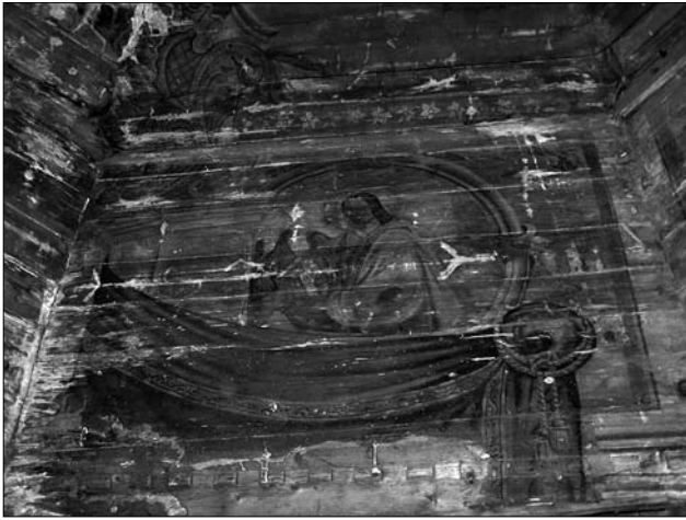
Іл. 11. Євангеліст Іван. Пандатива у наві церкви Різдва Пресвятої Богородиці. М. Горбовий, 1894 (фото Р. Грималюк, 2006; публікується вперше)