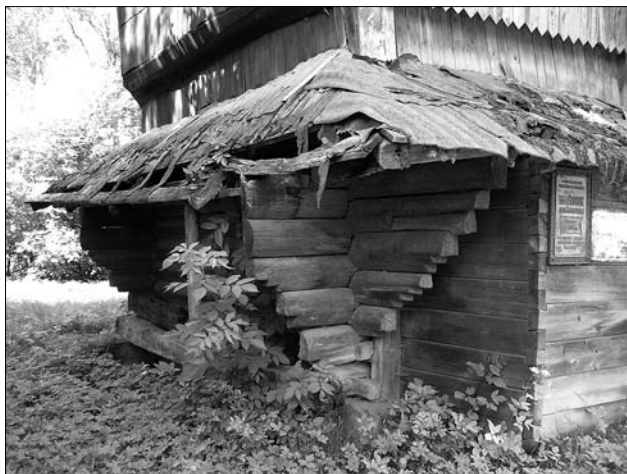
Іл. 7. Церква Різдва Пресвятої Богородиці села Бережниця. Пам'ятник архітектури XVIII ст.