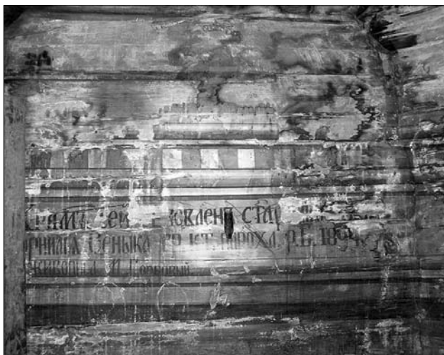
Іл. 8. Напис на стіні церкви «Храм цей оновлений стараннями пароха о. Корнелія Сеника року Божого 1894. Живописець М. Горбовий» (фото Р. Грималюк, 2006)