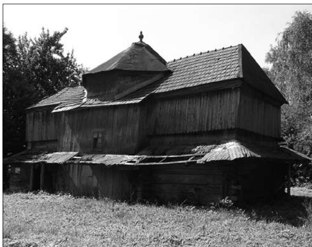
Іл. 5. Церква Різдва Пресвятої Богородиці села Бережниця (фото 2006 року). Вигляд з південної сторони (2006)