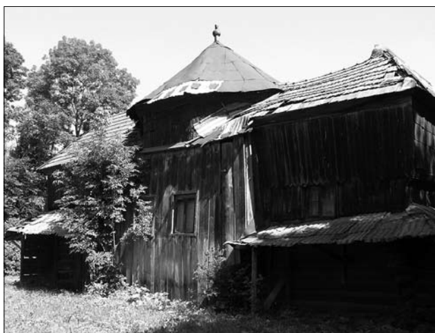
Іл. 6. Церква Різдва Пресвятої Богородиці села Бережниця. Вигляд з північної сторони

те коли ми прибули з Борисом Возницьким (повторююся, це був 2006 рік), все довкола було змінене до невпізнання: будівлю поступово поглинали бур'яни, кущі, дерева, а стіни та дах зазнали жахливих руйнацій від дощів, вітрів та неприпустимої недбалості (іл. 5, 6, 7).