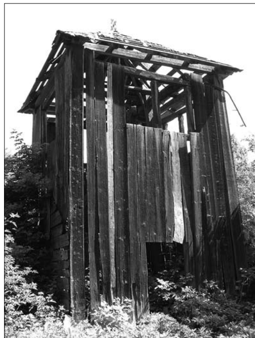
Іл. 3. Дзвінниця 1724 року церкви Різдва Пресвятої Богородиці в с. Бережниця (фото Р. Грималюк, 2006; публікується вперше)

пи, що захищало дерев'яні стіни від дощу та снігу (завдяки винесенню даху). Над навою знаходився дуже низький восьмигранник, вкритий наметовим верхом. Бабинець та вівтар вкриті трисхилими дахами [4, с. 106].