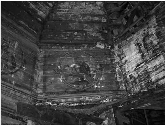
Іл. 12. Євангеліст Лука. Пандатива у наві церкви Різдва Пресвятої Богородиці. М. Горбовий, 1894 (фото Р. Грималюк, 2006; публікується вперше)