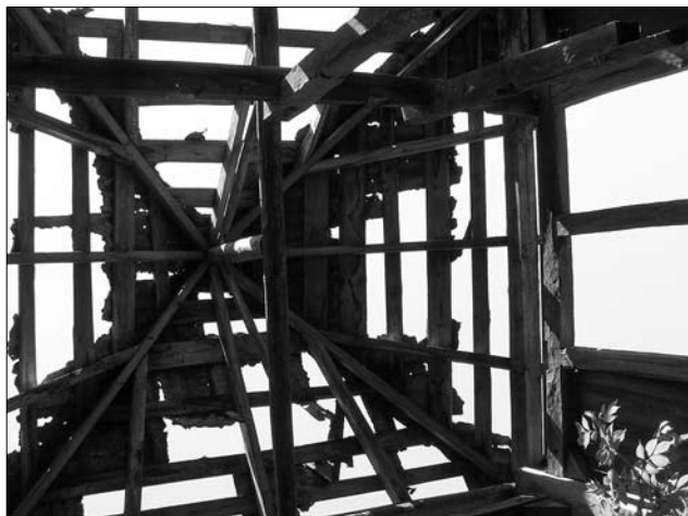
Іл. 4. Наметовий дах дзвінниці церкви Різдва Пресвятої Богородиці в с. Бережниця (фото Р. Грималюк, 2006; публікується вперше)