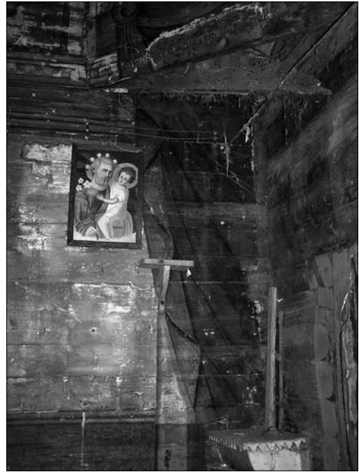
Іл. 9. Стінопис у вівтарній частині церкви Різдва Пресвятої Богородиці. М. Горбовий, 1894 (фото Р. Грималюк, 2006; публікується вперше)

Над навою церкви дуже низький восьмерик, вкритий наметовим верхом. На пандативах подекуди збе-