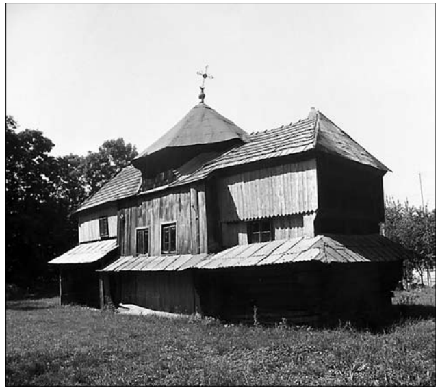
Іл. 2. Церква Різдва Пресвятої Богородиці села Бережниця (фото 1989 року.)

Вхід до церкви був у південній стіні нави. Будівлю оточувало піддашся (крім південної стіни нави), яке опиралося на випусти вінців зрубів і дерев'яні стов-