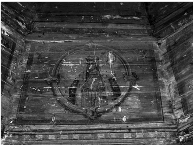
Іл. 13. Князь Володимир. Пандатива у наві церкви Різдва Пресвятої Богородиці (2006; публікується вперше)

Решта стінописів є втраченими, тому відтворити та охарактеризувати загальну картину колишньої оздобы церкви зараз уже неможливо, як і дати належну оцінку художній манері живописця та її особливостям. Найбільш парадоксально, що на такій руїні церкви донедавна висіла охоронна табличка «Пам'ятка архітектури XVIII століття», адже церква Різдва Пресвятої Богородиці в селі Бережниця є пам'яткою архітектури національного значення.