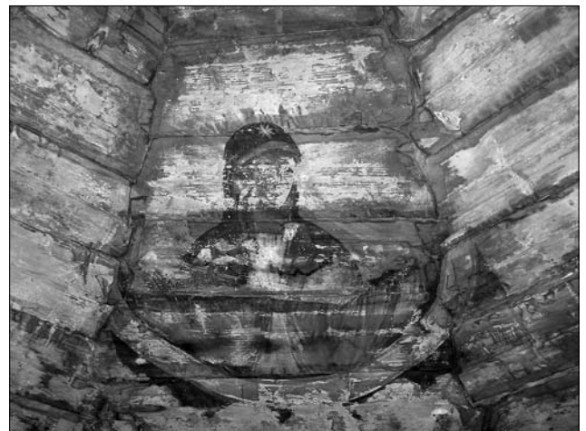
Іл. 10. Покрови Пресвятої Богородиці. Стінопис вівтарної частині церкви Різдва Пресвятої Богородиці. М. Горбовий, 1894 (фото Р. Грималюк, 2006; публікується вперше)

реглись зображення євангелістів, серед яких можемо впізнати євангеліста Івана та євангеліста Луку (іл. 11, 12). Інші зображення євангелістів, на жаль, втрачені.