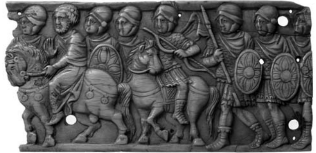
Іл. 4. Стратіоти та skutарії на марші. Пластина зі слонової кістки, Єгипетський діоцез, VI ст. Райнський краєзнавчий музей, Трір.

Ще одним пунктом дій Петра було поповнення сил магістерія з числа населення міст, повз які проходив корпус. Яскравим прикладом цього слугує прецедент, що відбувся того ж 595 р. у місті Асім