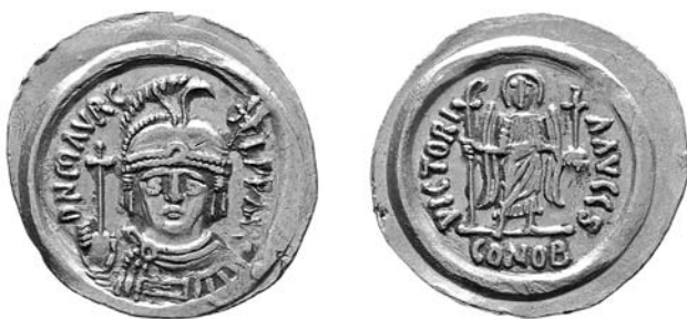
Іл. 2. Імператор Маврикій (582—602), зображений аверсі соліда. Імовірно, монетний двір Константинополя. Легенда на аверсі: «D[omin]N[us] MAVR[i]C[ius] [напис стертий, імовірно Тіб[erius]] Р[ater] Р[at]riae] AVG[ustus] [лат. «Володар Маврикій Тиберій, Батько Батьківщини, Великий»]. Легенда на реверсі: VICTORI A, AVCCS [лат. «перемога двох августів», нижче — CON[stantinopolis] OB[RYZA] [лат. Константинополь. Чисте золото]. Судячи з легенди на реверсі, монета карбована у 589—601 рр. Переклад легенд наш

Іншим чинником, який сприяв поразкам Константинополя у ході кампаній 568—570, 581 та 583—584 рр., була відсутність цілеспрямованого