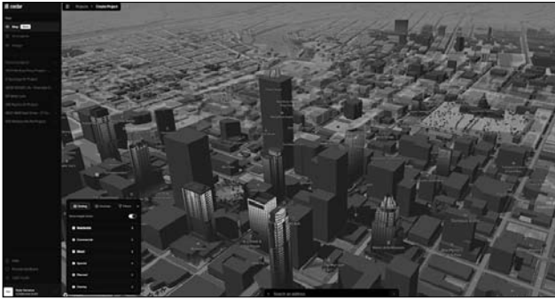
Іл. 3. Детальне лазерне 3D-сканування собору Нотр-Дам. URL: https://edition.cnn.com/style/article/notre-dame-andrew-tallon-laser-scan-trnd

хітектурний дизайн поступово виходить за межі суто утилітарного проектування будівель і споруд. Сучасна архітектура дедалі більше розглядається як комплексна культурна та соціальна практика, що формує не лише фізичний простір, а й естетичний образ міста, впливає на якість життя людей та відображає цінності сучасного суспільства. У цьому контексті особливого значення набуває формування цілісного та виразного візуального образу архітектурних об'єктів [5, с. 3].