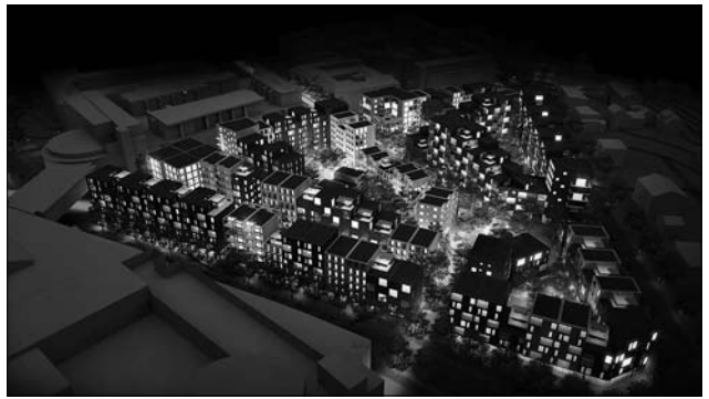
Іл. 1. Проектна пропозиція, створена за допомогою Space-maker.

У цьому контексті особливого значення набуває розвиток цифрових технологій, зокрема систем штучного інтелекту, що відкривають нові можливості для архітектурного проектування. Використання алгоритмів машинного навчання, генеративного дизайну та автоматизованого аналізу даних дозволяє розширити межі традиційного творчого процесу. Штучний інтелект може виступати не лише як допоміжний інструмент, а й як активний учасник формування архітектурної концепції, здатний аналізувати різнома-