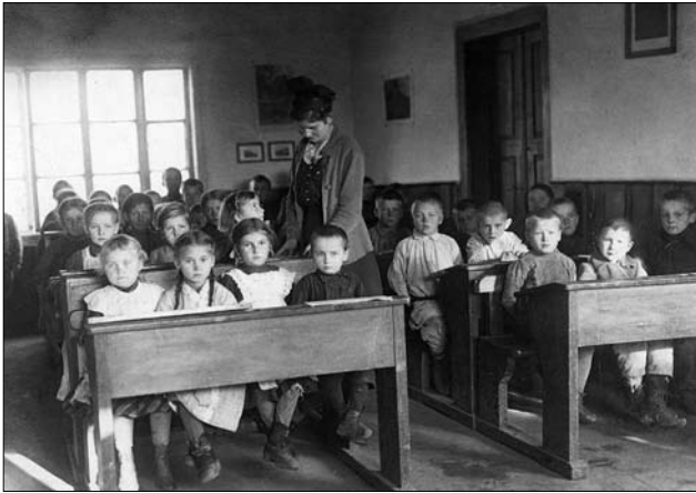
Іл. 5. Савина під час уроку в класі Української народної школи імені Шевченка у Володимирі-Волинському. Орієнтовно 1916—1918 рр. [8, с. 29]