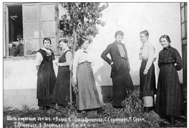
Іл. 4. Вчительки народної школи. Володимир-Волинський, 1916 р. [8, с. 27]