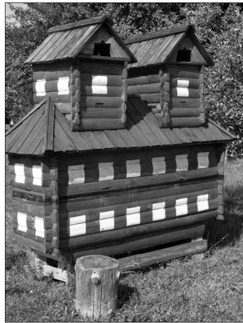
Іл. 7. Слов'янський вулик роботи В. Петричука на 8 бджолосімей у вигляді хати. Пасіка св. Миколая у с. Кобаки Косівського р-ну Івано-Франківської області. 2013 р.

тичної та економічної монографії Калуського повіту Станіславського воєводства, збережений у фондах Державного архіву Івано-Франківської області, інформує, що із загальної кількості вуликів (3291) у 66 населених пунктах повіту слов'яни склали більш ніж половину (1873) й концентрувалися у селах Довге Калуське, Довгий Войнилів, Павликівка, Пійло, Старий Угринів, Верхня, Войнилів, Довпотів, Завій [48, арк. 40].