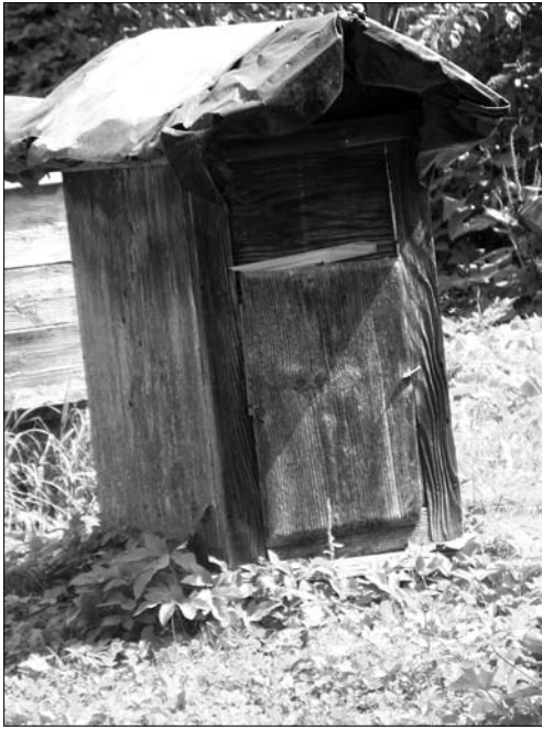
Іл. 8. Слов'янський вулик в діючій бойківській пасіці. с. Вовче Турківського р-ну Львівської області. 2019 р.