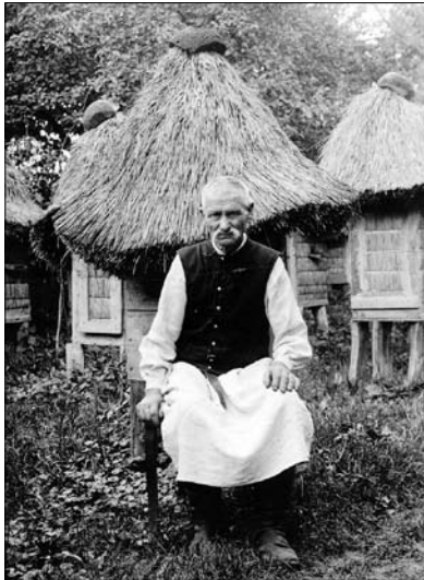
Іл. 3. Пасічник на фоні слов'янського солом'яного вулика (с. Зіболки Жовківського повіту).