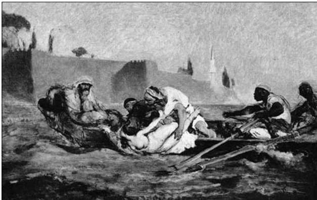
Іл. 7. Матейко Ян. «Хасан топить невірну дружину». Джерело: [12]

початку ХХ ст. там навіть розмістили читальню родини Альтенбергів.