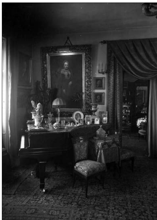
Іл. 11. Збірка Костянтина Бруницького.

Грудзинська (1795—1831), друга дружина великого князя Костянтина Павловича (1789—1831) з відповідною дедикацією французькою мовою.