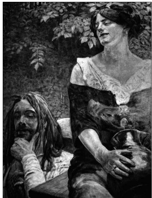
Іл. 4. Мальчевський Яцек. «Христос і самарянка». Джерело: [12]

Бездоганне управління маєтками дозволяло отримувати чималі доходи [10, с. 5, 6].