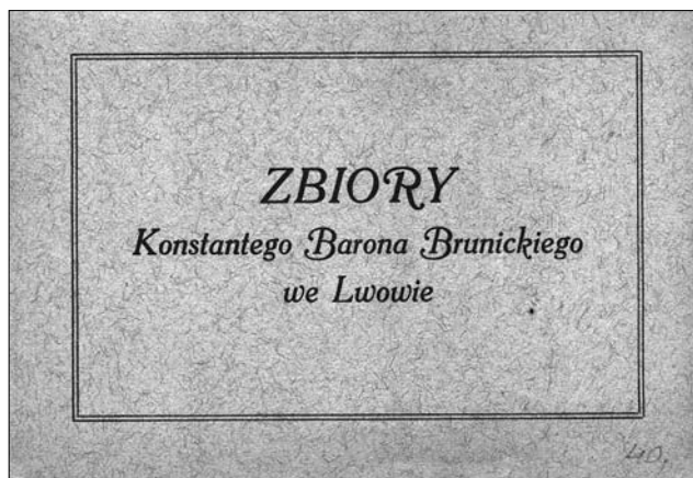
Іл. 10. Титульна сторінка комплекту поштівок. Джерело: [12]