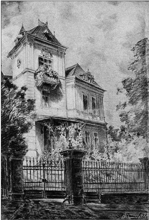
Іл. 5. Розенфельд Камілла. Вид вілли Бруницького. URL: https://esu.com.ua/article-886890